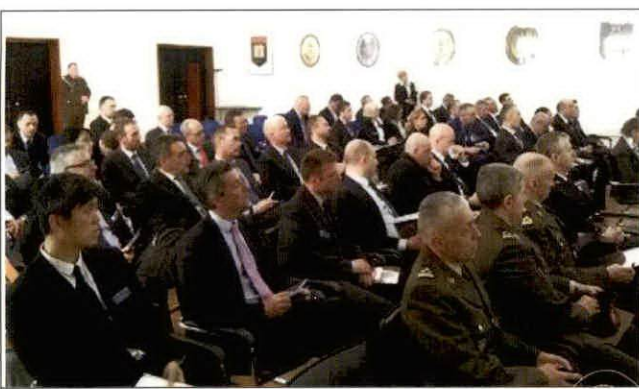
克羅埃西亞國防部參訪