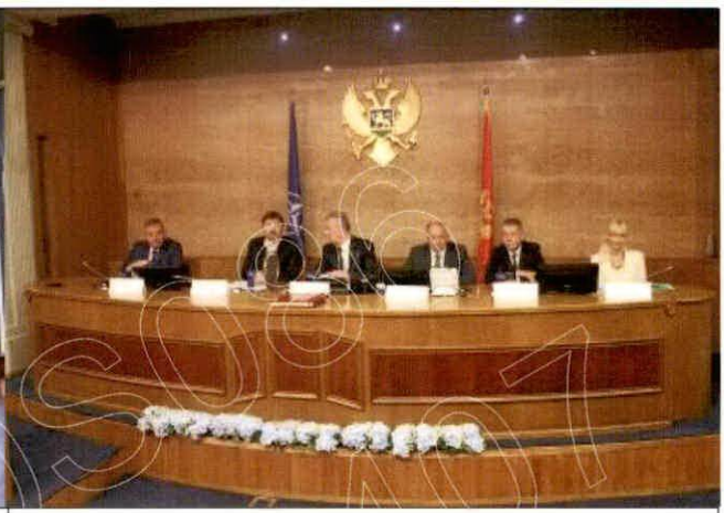
蒙特內哥羅議會參訪