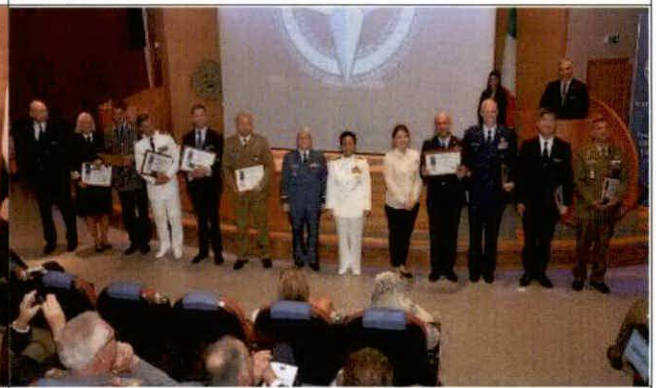
本教授班獲頒艾森豪獎