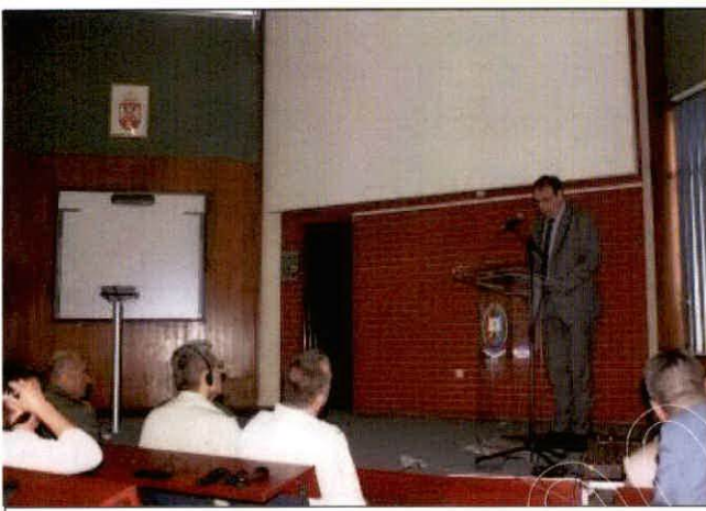
塞爾維亞國防大學參訪