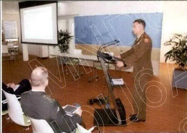
盧森堡國防部參訪