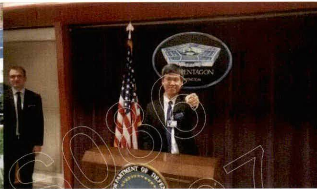
美國五角大廈參訪