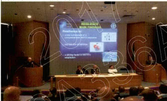
本教授班論文簡報