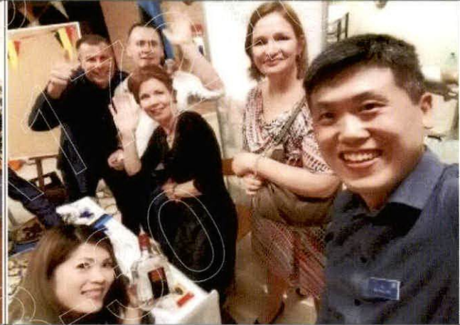
各國傳統食物分享日(1)