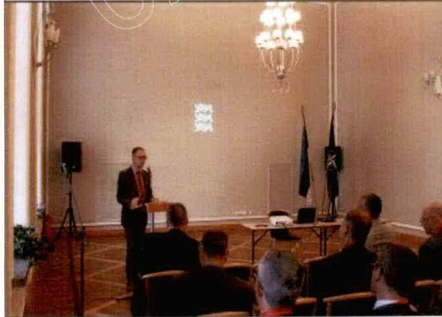
愛沙尼亞國防部參訪