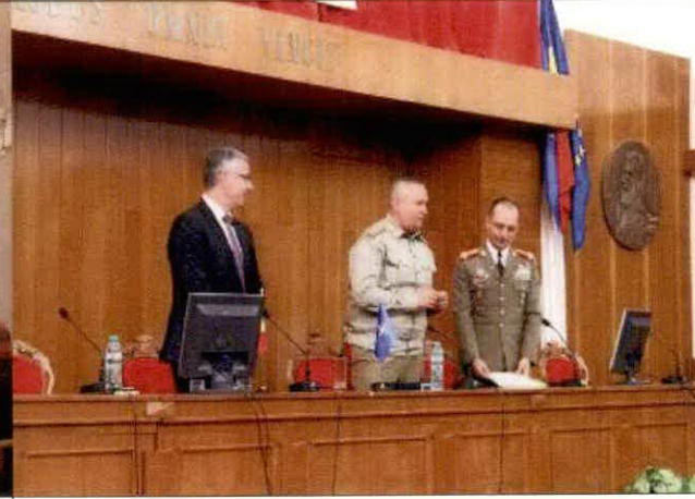
羅馬尼亞國防大學參訪