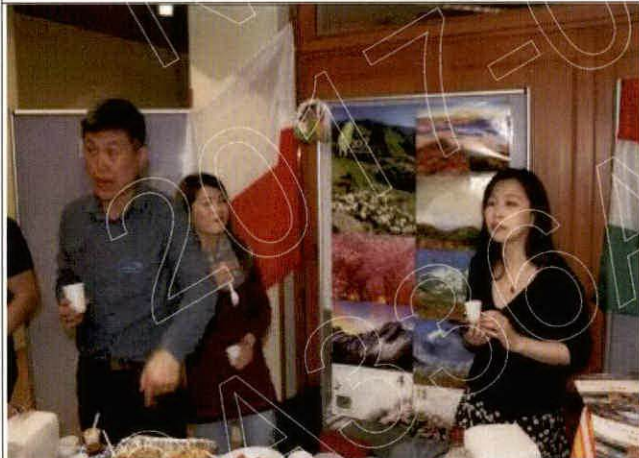
各國傳統食物分享日(2)