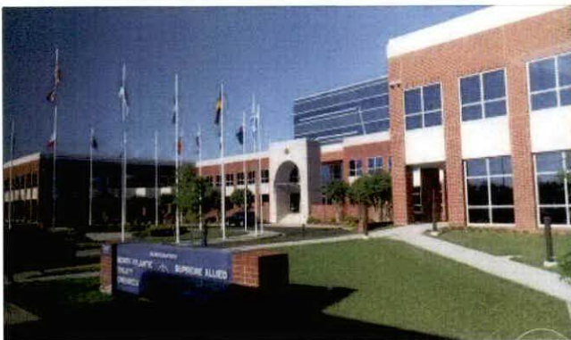
北約駐美總部參訪