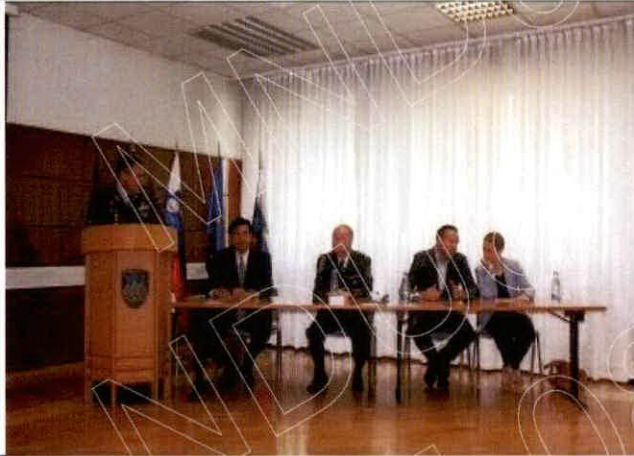
斯洛維尼亞國防部參訪