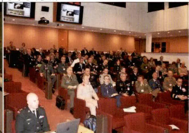
加拿大國防部參訪