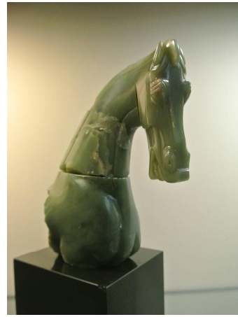
維多利亞與艾伯特博物館「漢玉馬」