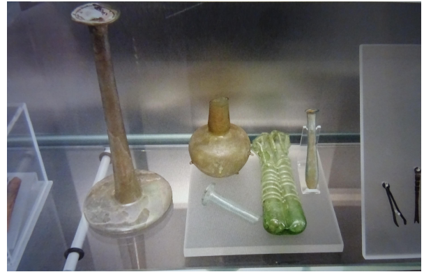
羅馬浴場博物館出土文物