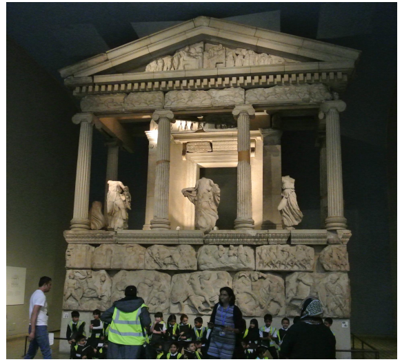
大英博物館希臘展場