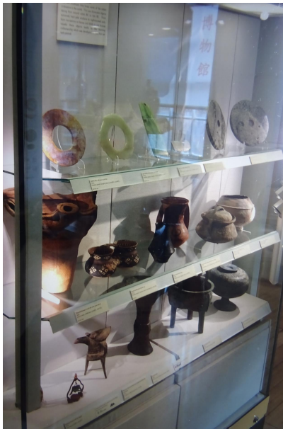
東亞藝術博物館所藏文物