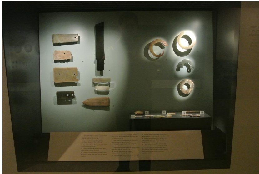
阿什莫林博物館收藏的玉器