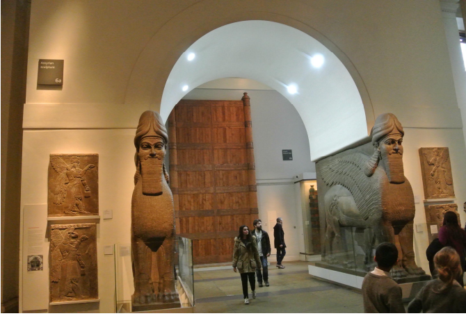
大英博物館亞述展場