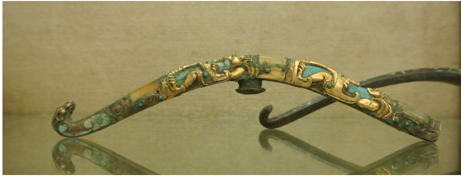
菲茨威廉博物館「戰國晚期錯金銀嵌寶石銅帶鈎」