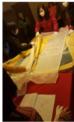
no.3(繡丙 1041)清 黃綢繡三蘭雲蝠金龍袍料 附件