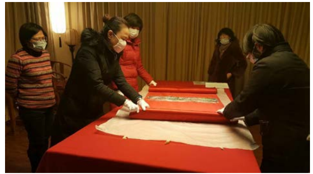
no.6 (繡乙 145)清 紅色大蟒緞料