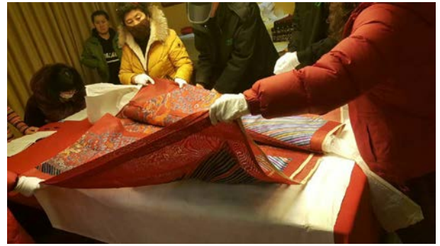
no.5(繡乙 347)清 紅色納紗彩雲蝠金龍袍料 附件