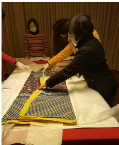
no.4(繡乙 287)清 絳色緞絲五彩雲蝠壽金龍 袍料