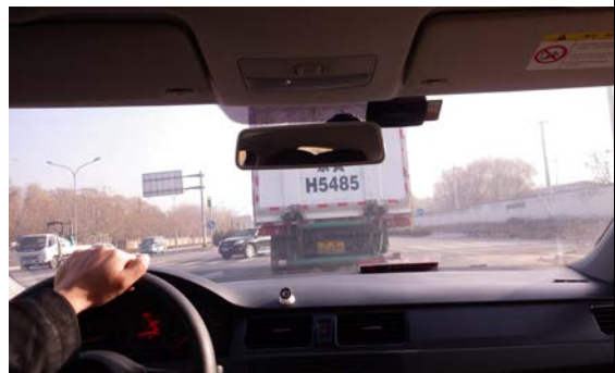
文物貨車由北京出發，經高速公路開往瀋陽