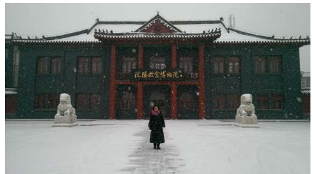
105年12月8日下大雪，攝於瀋陽故宮博物院。