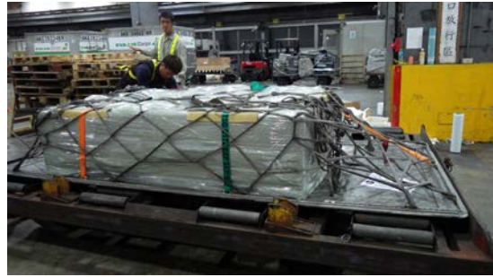
桃園機場海關庫房箱外包裝後運送上機