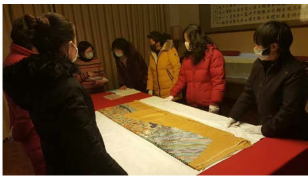
no.3(繡丙 1041)清 黃綢繡三蘭雲蝠金龍袍料