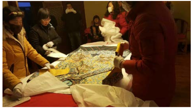
no.2(繡乙 47)清 明黃江綢彩繡平金夾龍袍