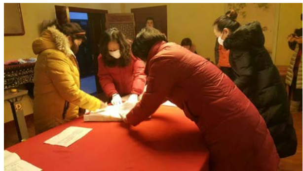
no.4(繡乙 287)清 絳色緞絲五彩雲蝠壽金龍 袍料附件