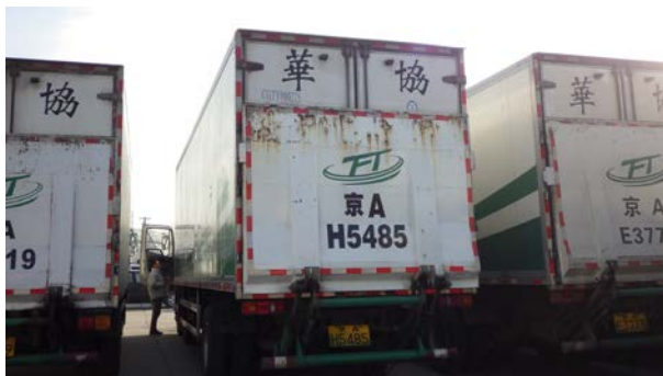
文物至北京機場由大陸包裝運輸公司承運

文物箱由桃園機場空運至北京機場，文物的運輸轉為陸路運送，由大陸包裝運輸公司承運。105年12月7日一早工作人員至北京機場倉儲地區，會同當地包裝運輸公司，準備運送已經裝車的文物至瀋陽。早上約10:00出發，經由北京-瀋陽的高速公路，約至下午7:00抵達瀋陽市外，由於瀋陽市交通管制，貨車需至晚上10:00後才能進城。幸由瀋陽故宮李主任立即電話連絡瀋陽市交通大隊，方能從外環高架入城，將文物貨車駛進瀋陽故宮內的停車場。