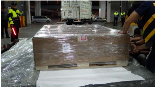
桃園機場海關加驗封簽