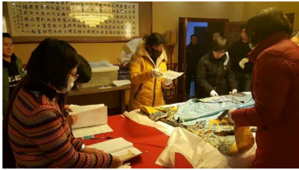
no.2(繡乙 47)清 明黃江綢彩繡平金夾龍袍