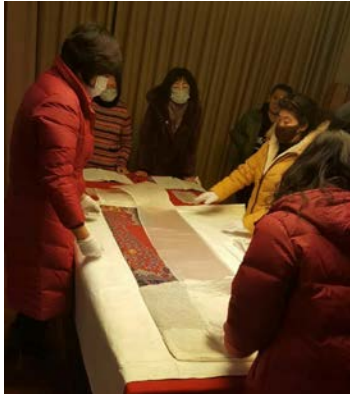
no.5(繡乙 347)清 紅色納紗彩雲蝠金龍袍料