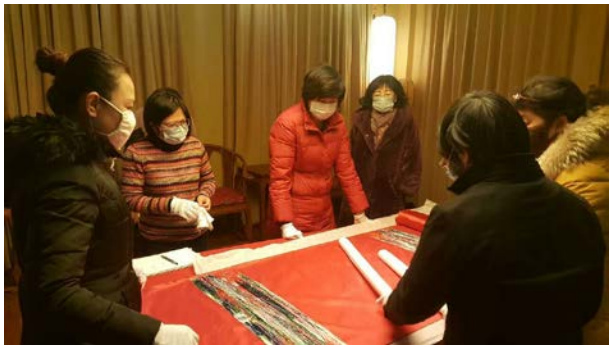
no.6 (繡乙 145)清 紅色大蟒緞料