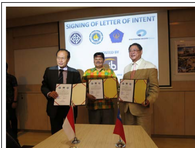
與巴淡國際大學及 Batam State Polytechnic 簽署共同合作協議