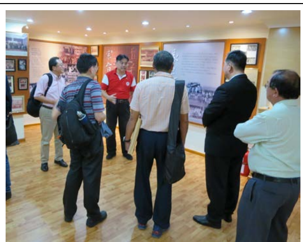
參訪留台聯總歷史走廊