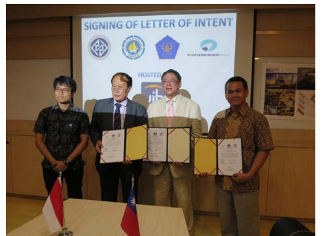
與巴淡國際大學及 Universitas Maritim Raja Lai Haji 簽署共同合作協議