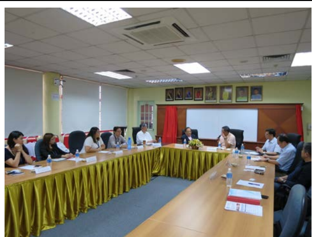
兩校代表人員交流討論