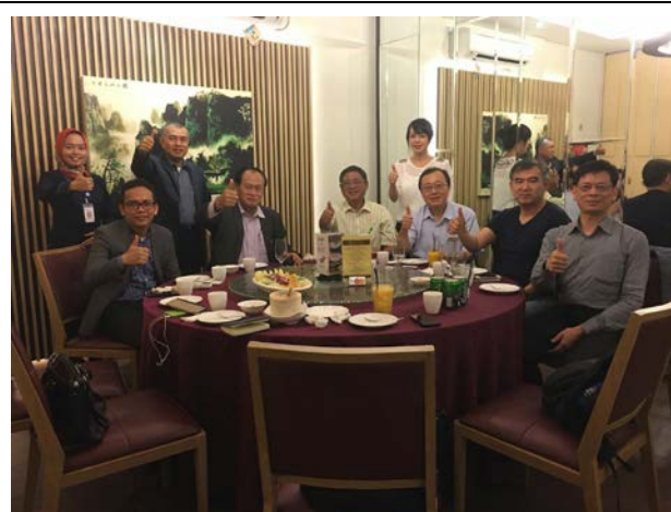
與巴淡國際大學校長等人餐敘