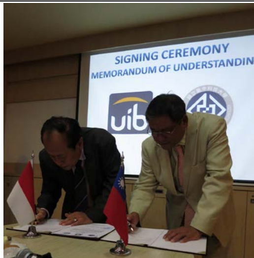
與巴淡國際大學簽署兩校合作協議