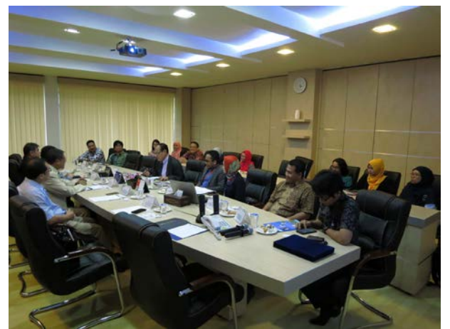
與印尼 4 校代表學術交流座談會