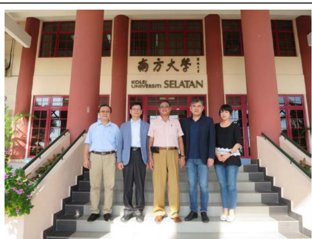
本校代表人員於南方大學留影