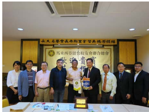
雙方交換紀念品合影留念