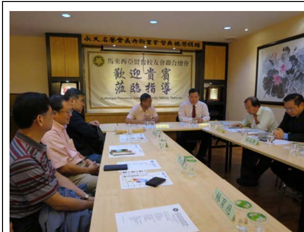
與留台聯總代表座談交流