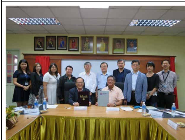
兩校簽署合作協議