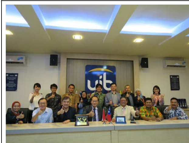
各大學出席代表合影