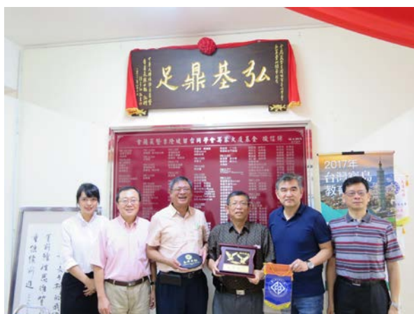
雙方交換紀念品合影留念