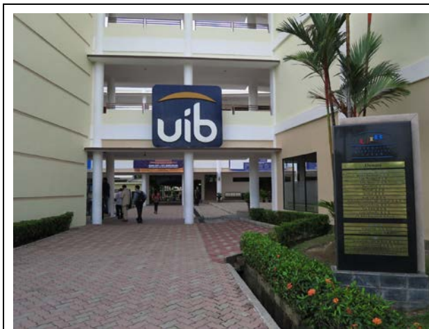
參訪巴淡國際大學校園

鄰近新加坡，搭船約 40 分鐘。巴淡島近年來為印尼政府發展觀光重點，集商業、工業及旅遊發展的島嶼。本校代表於 12 月 15 日下午拜會該校，會中與該校及印尼另外三所大學(Universitas Maritim Raja Lai Haji、Batam State Polytechnic 及 Universitas Slamet Riyadi Surakarta)舉行聯合學術交流座談會，同時並與該 4 所大學分別簽署兩校合作協議，未來希望能先從兩校學生交換、教師互訪、共同舉辦研討會活動等議題上發展合作。