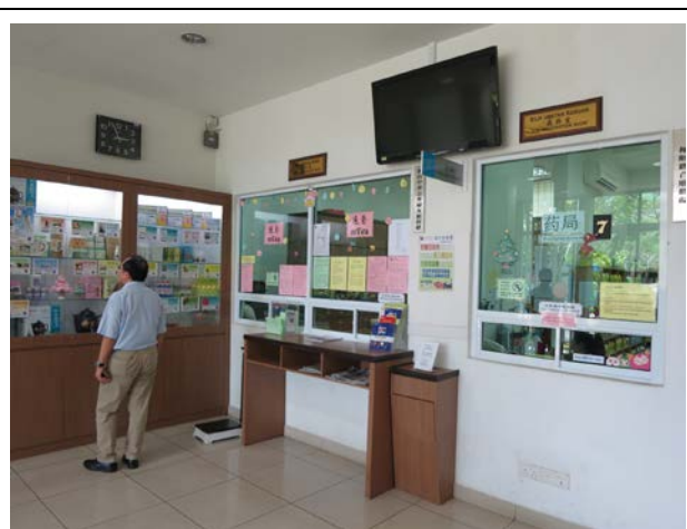
參訪該校中醫藥學院及其中醫診所