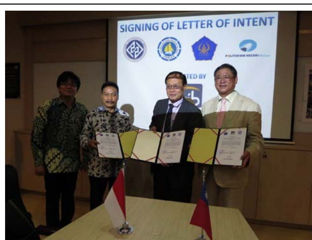
與巴淡國際大學及 Universitas Slamet Riyadi Surakarta 簽署共同合作協議