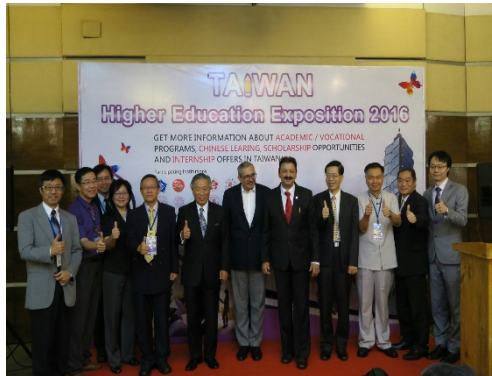
右圖說：代表團與開幕式致詞嘉賓合影