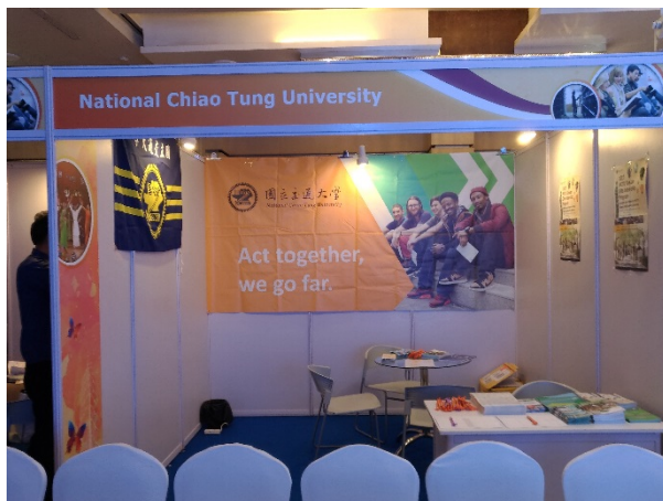
圖說：本校參展攤位全景

因昨晚抵達飯店時間較晚，故本日主要為進行教育展展場佈置，並整理明後兩日教育展及之後參訪各單位行程所需之資料，以期順利圓滿達成此次參展及出訪目的。