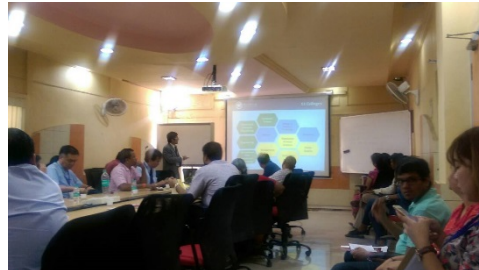
右圖說：向孟買大學簡介本校及國際招生資訊