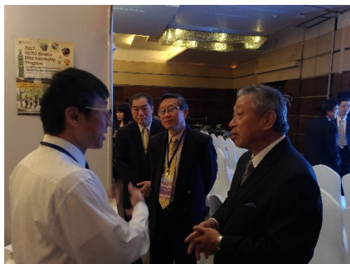
左圖說：向田大使說明及介紹本校學程資訊