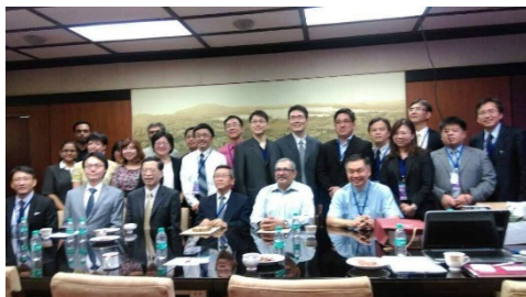
左圖說：臺灣代表團員與 IITB 代表合影

領域廣泛，並培育出不少印度知名人物，如甘地即是該校校友。孟買大學提供臺灣各校介紹學校的機會，促進雙方學校的認識，並期許日後能與臺灣學校有學術合作交流機會。於會談當中，該校也表示因印度人口數眾多，青年學子占非常高的比例，且對於追求國外留學優質高等教育機會十分積極，故對臺灣高等教育能夠有更豐富的資訊，相信對該校學子將會是一大利多。