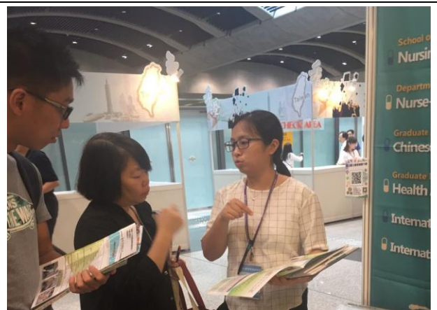
圖 2: 與香港學生及家長解說本校及系所特色