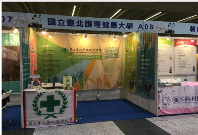
圖 1: 香港教育展攤位