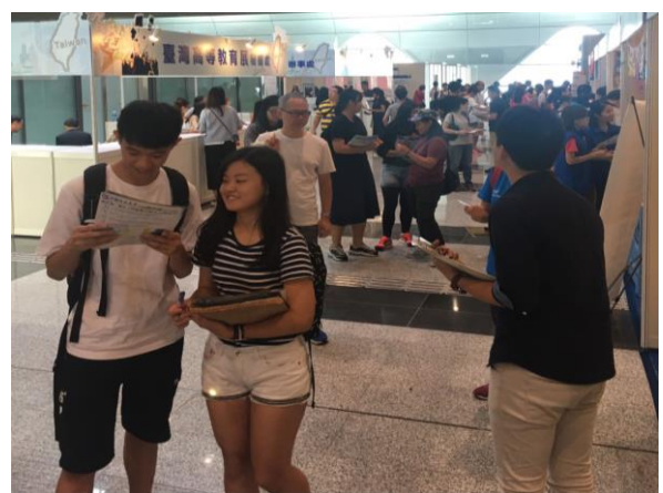
圖 6: 香港教育展活動盛況