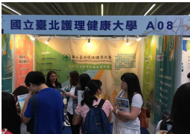
圖 3: 與香港學生解說本校課程