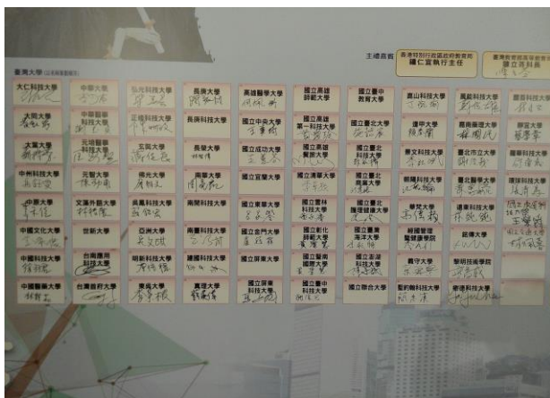
圖 5: 香港合作意向書簽約