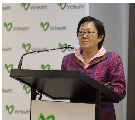
王主秘代表我國報告