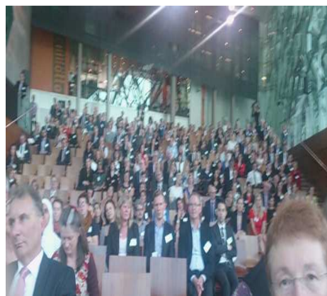
健康促進獎決選頒獎典禮