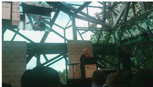
維多利亞省衛生局長出席健康促進獎決選頒獎典禮