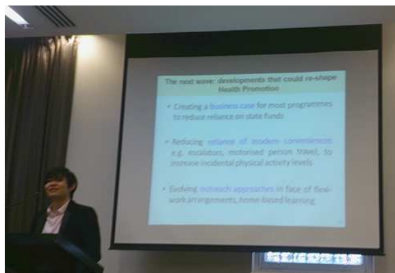
會員國報告業務推動現況