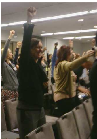
年會現場帶大家做健康操