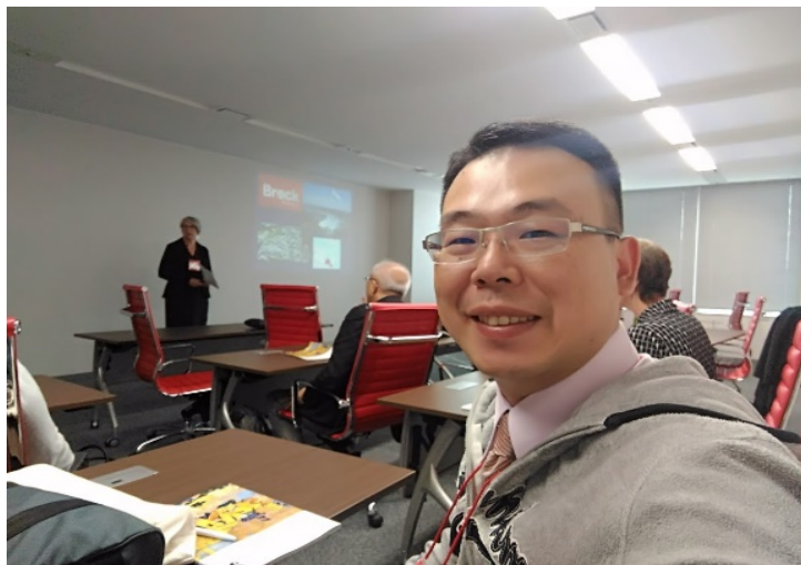
圖二、Asian Conference on Education 2016 會議會場照片(二)