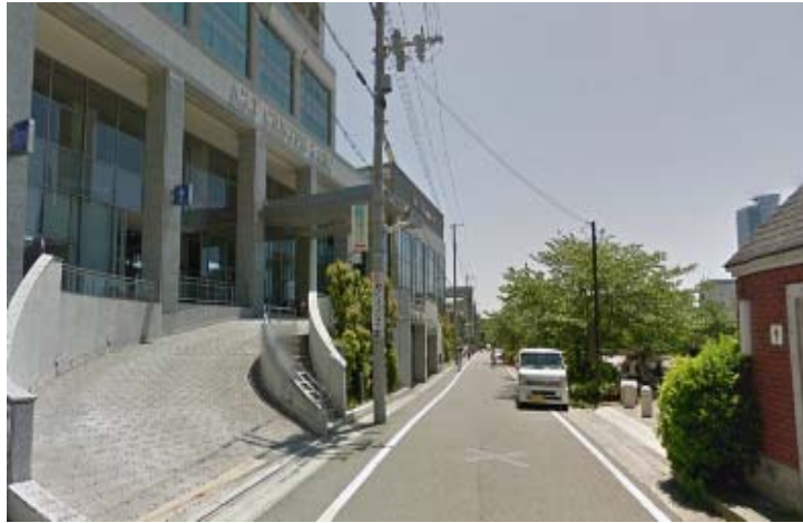
圖一、Asian Conference on Education 2016 會議會場照片(一)