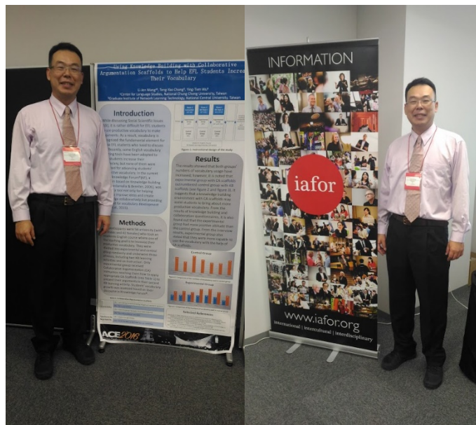
圖三、Asian Conference on Education 2016 會議會場照片(三)