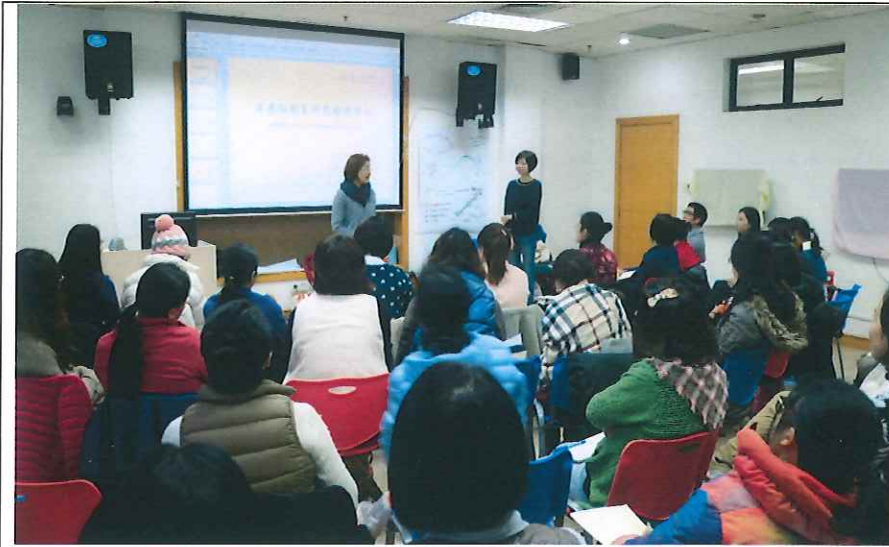
2017 暑期師訓課程說明會