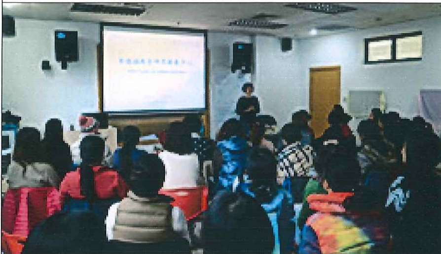
2017 暑期師訓課程說明會 簡報