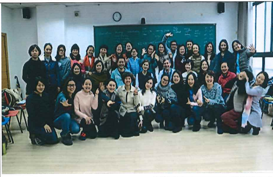
上海師訓課程講師及學員 合影