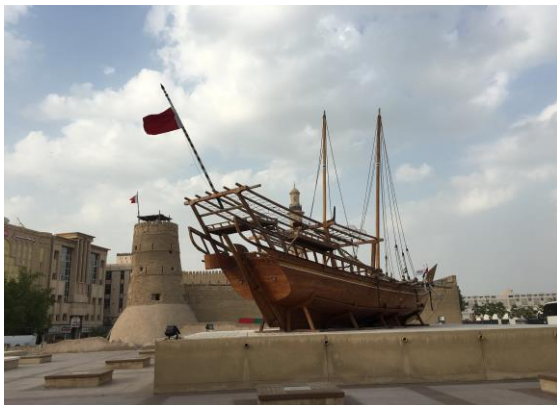
圖 22 杜拜博物館