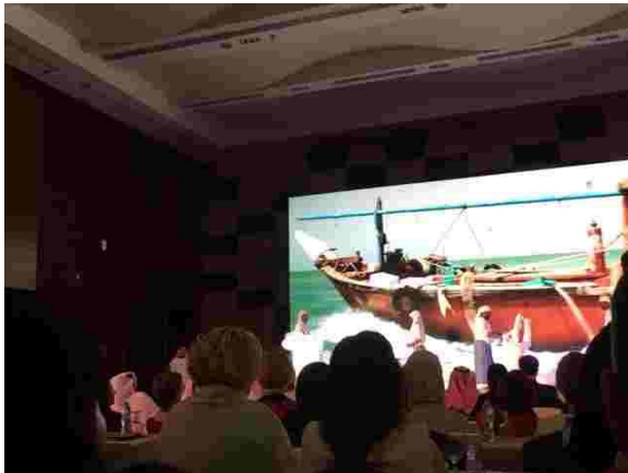
圖 3 舞台劇(捕魚)

間安全無虞，將依據世界高標準來運轉電廠，目前本公司員工人數已由 1100 人增加到 1800 人，大部分在巴拉卡核電廠現場工作，4 部 APR1400 的完工比例分別為 91%、78%、62%、32%，1 號機明年裝填燃料，他表示巴拉卡核電廠已有 2 位持照女性運轉員，電廠女性同仁表現優異。