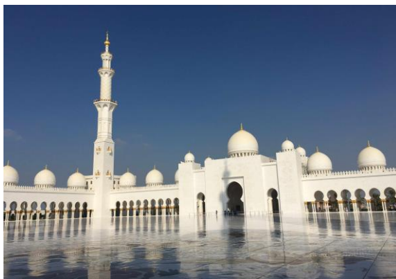
圖 18 大清真寺

阿布達比市區內，風格各異、式樣新穎的高樓大廈林立，形成美麗的天際線(圖 19)。此外，傳統市場內的椰棗一條街，陳列不同品種的生椰棗與椰棗乾，據了解椰棗是伊斯蘭國家特有的果實，生長在乾旱的沙漠，由於它的營養等功效顯著，被稱為沙漠麵包。