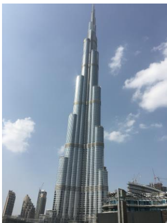
圖 20 哈里法塔

最後在夜幕低垂時分，路過杜拜王宮(圖 23)，欣賞絢麗的夜景，也結束這段難得的旅程。