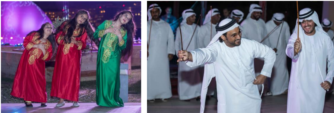
圖 14 Gala 晚宴的民俗舞蹈表演

12月22日會議活動結束當晚，主辦單位舉辦 Gala Dinner 款待出席年會的各國人員，主辦單位在宴會場地安置的各種攤位，介紹阿拉伯民俗文化，有：製作魚網、養鷹、阿拉伯文書法、用砂畫和指甲花在身上形成圖案、以阿拉伯咖啡與椰棗迎客等攤位；現場有當地的民俗舞蹈表演（圖 14），並架設舞台表演精采的歌唱，曲目為「One Moment in Time」（圖 15）。