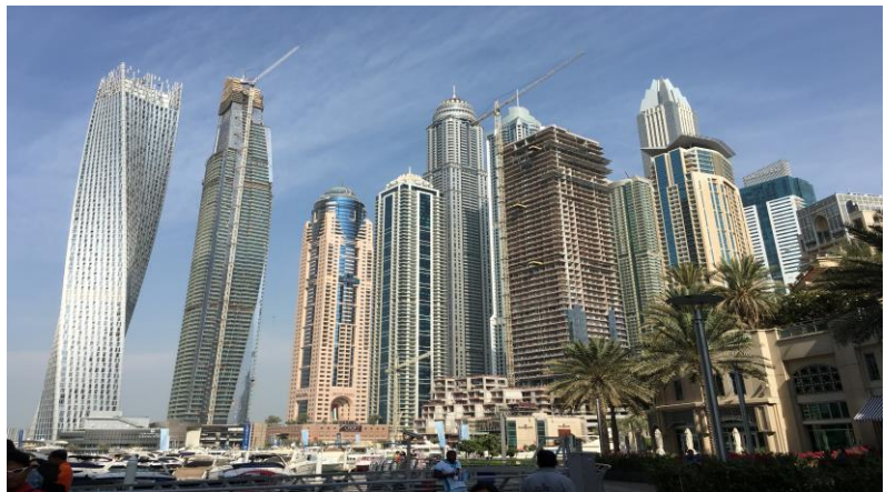
圖 21 杜拜高樓大廈