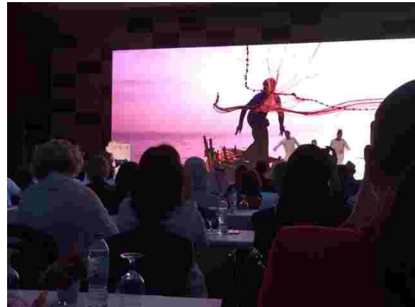
圖 4 舞台劇(採珍珠)