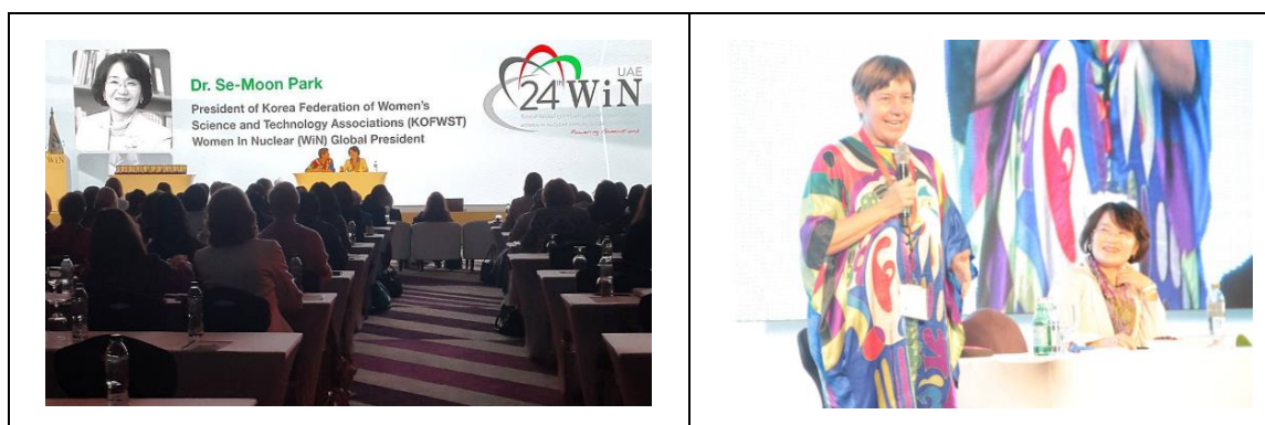
圖 10 新舊任理事長交接