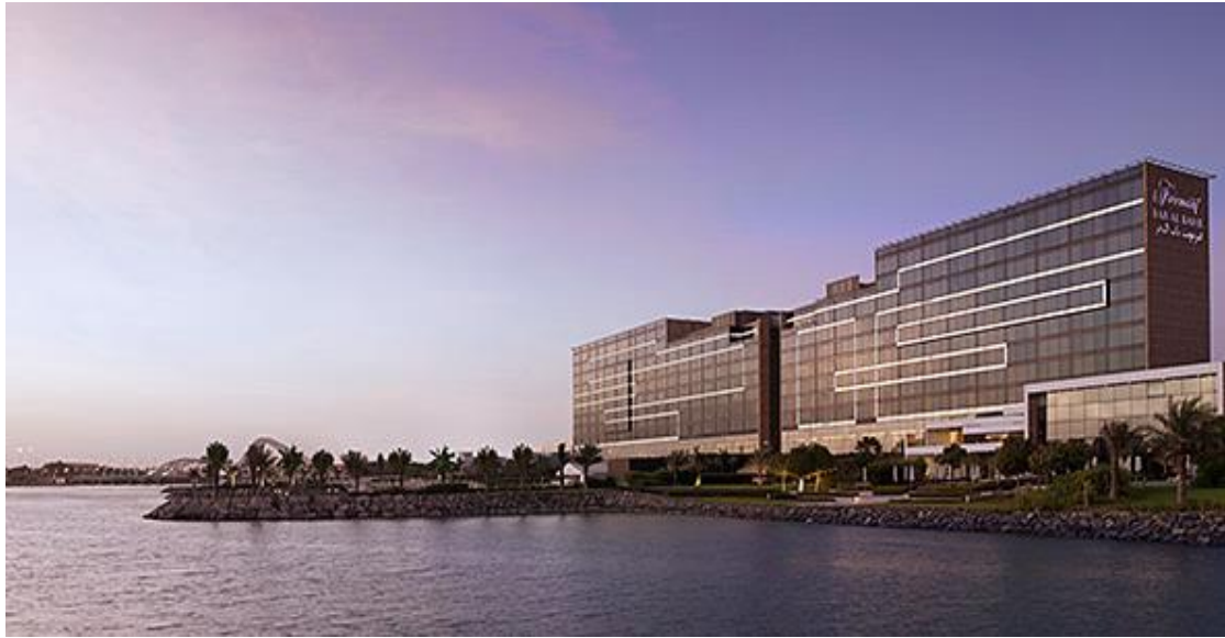
圖 1 會議地點阿布達比之 Fairmont Bab Al Bahr Hotel