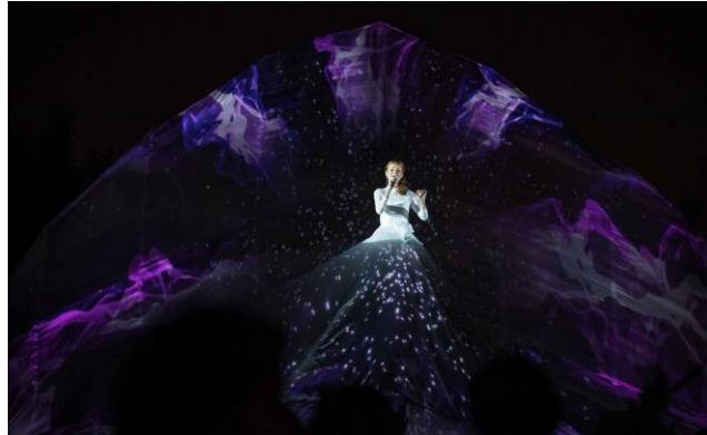
圖 15 Gala 晚宴的歌唱表演