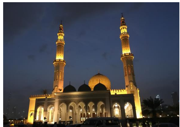
圖 23 杜拜王宮