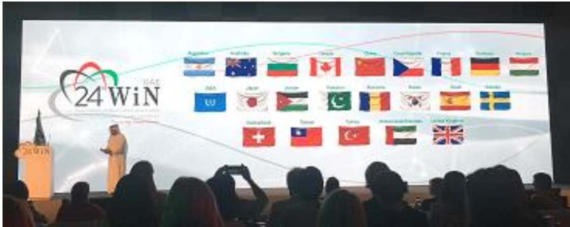
圖 12 各報告分會國旗

各分會代表上台報告會務，今年有 22 個分會進行會務報告，我國由鄭憶湘會長報告（圖 12、圖 13），會務報告資料和簡報詳如附件 2。