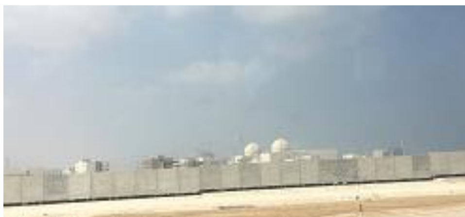
圖 14 巴拉卡核電廠 (最右邊是 1 號機，4 部機自右至左排列)

11 月 23 日上午 7 時自飯店出發，搭了 3 個多小時車程抵達巴拉卡核電廠，由於保安檢查嚴格，花去很多時間，原排定參觀模擬中心的行程只好取消。Nawah 執行長 Mohammed A. Sahoo AlSuwaidi 接待，由核燃料部門的女性主管簡報，介紹 4 部機組的施工現況，並說明安全有關規定，其表示巴拉卡核電廠以安全第一(Safety)、表裡一致(Integrity)、透明(Transparency)、效率(Efficiency)四項(SITE)為核心價值，因此將依據世界高標準來運轉電廠，以確保在 60 年的壽命期間安全無虞。聽取簡報後，依電廠要求將隨身行李留在簡報室，搭乘電廠安排的車輛，繞行工地一圈。但因進入廠區不能拍照，故只能在離開電廠時回首遙望，在廠區外的遊覽車上拍下猶如海市蜃樓般的一幕（圖 14）。