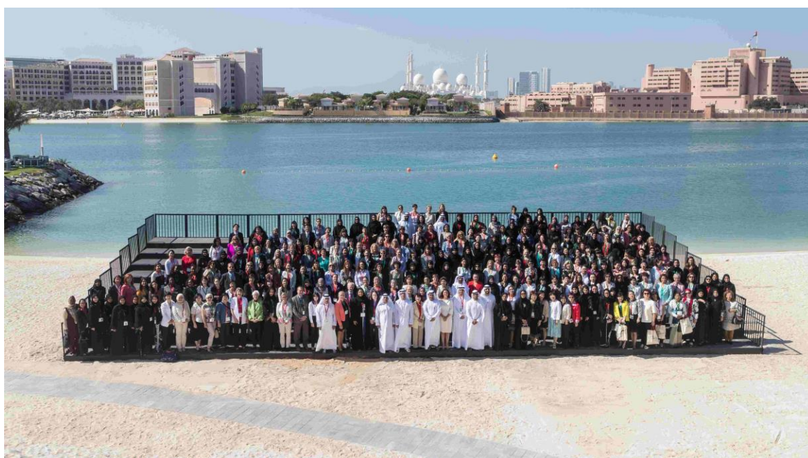
圖 9 2016 全球核能婦女會年會團體照

年會團體照為會議進行的主要活動之一，今年也不例外。由於會議場所的 Fairmont Bab Al Bahr Hotel 擁有美麗的沙灘與無敵的海景，且可遠眺阿布達比最著名的大清真寺，因此大會便於沙灘上特別搭建一座照相的階梯，使沙灘、海景、大清真寺與團體照同時入鏡。(圖 9)