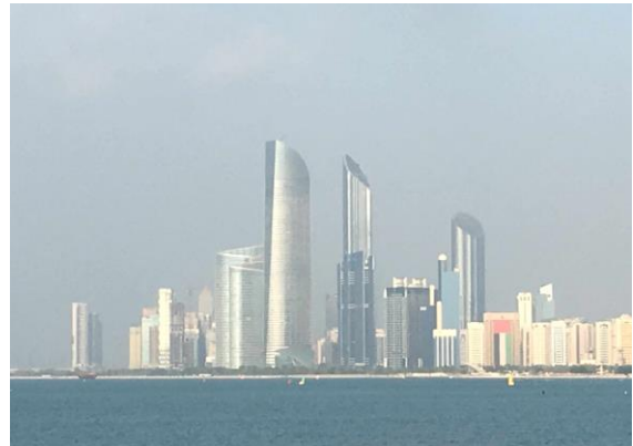
圖 19 阿布達比天際線