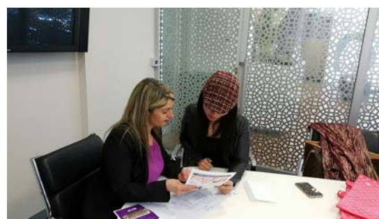
討論合作意向書草案