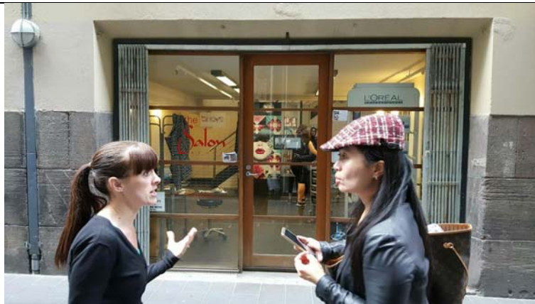
企業進駐校園合開課程~參觀 SPA 企業