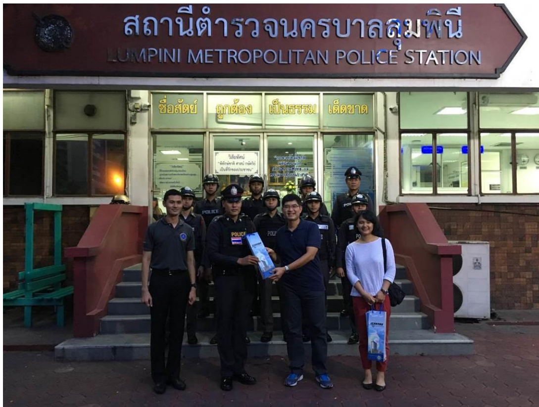
參訪 LUMPINI 派出所，出勤前的勤教