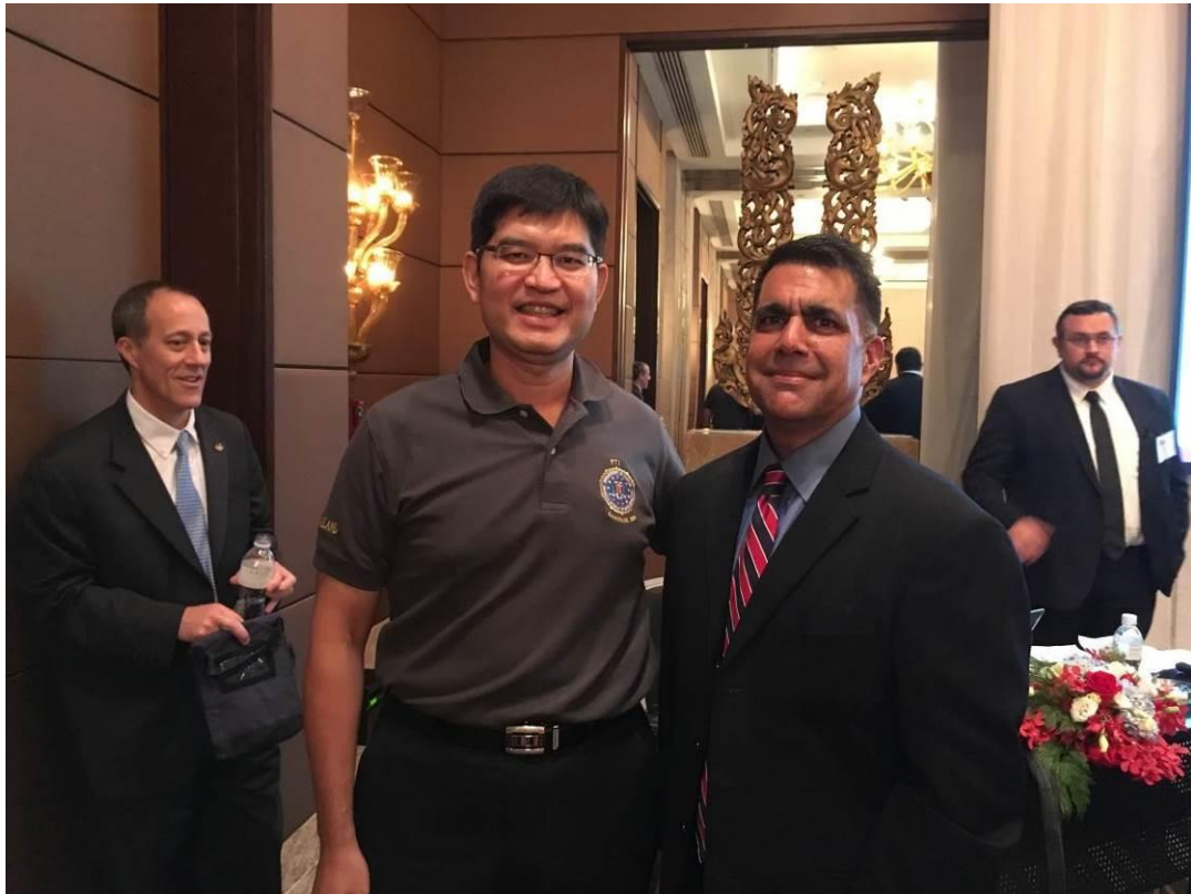
與 ALAN 講師曾合作偵辦過 OP Pacifier 撤播兒童色情圖片案