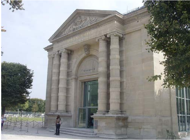
橘園美術館創立於1856年。

奧塞博物館及橘園博物館公共機構(l'Etablissement public du musée d'Orsay et du musée de l'Orangerie)隸屬於文化通訊部(Ministère de la Culture et de la Communication)，橘園美術館(Musée d'Orangerie)及(Musée Herbert)皆隸屬於該館。奧塞博物館在法國國立博物館中排列前五大，館長由法國總統任命，第一任為五年任期，續任為三年任期。