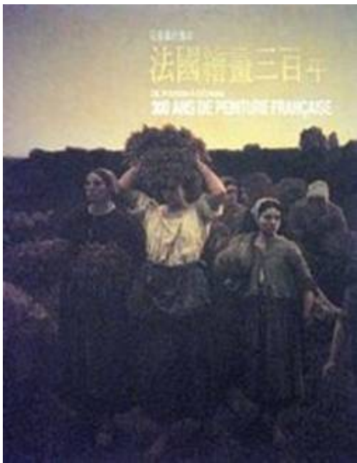
「從普桑到塞尚—法國繪畫三百年」特展圖錄

1998年10月22日，國立故宮博物院應邀在巴黎大皇宮（Grand Palais）舉辦「帝國的回憶—台北國立故宮博物院瑰寶」（Mémoire d'Empire: Trésors du Musée national du Palais, Taipei）特展，當年促成的合作的單位包括法國藝術活動協會（AFFA）、法國國立博物館聯合會（Réunion des Musées Nationaux）、法國吉美亞洲藝術博物館、法國贊助廠商（Dassault Industrie）以及臺灣的中央研究院等。依雙方文化交流的協定，法方回饋本院「帝國的回憶」特展為「從普桑到塞尚—法國繪畫三百年」（De Poussin à Cézanne: trois cent ans de peinture française）。此特展由法國國立博物館聯合會（Réunion des Musées Nationaux）統籌法國二十七家國立博物館、美術館共襄盛舉，總計參展作品為六十五幅油畫及十五幅素描。該展覽劃分為七大時期，法國繪畫範圍由1627年Simon Vouet的法國巴洛克到1905年的野獸派時期。法國繪畫三百年的黃金時代以兩位法國繪畫大師為代表：普桑（Poussin）和塞尚（Cézanne）皆影響了歐洲的藝術風格。該展為當年台法交流之一大盛事，三個月吸引了三十多萬參觀者。奧塞博物館為「從普桑到塞尚—法國繪畫三百年」特展重量級之借展單位，曾慷慨出借19幅重量級名家代表作品。該特展建立了兩館第一次的合作關係，合作單位包括本院、聯合報系、文化部博物館、法國文化部博物館司及法國國立博物館聯合會。