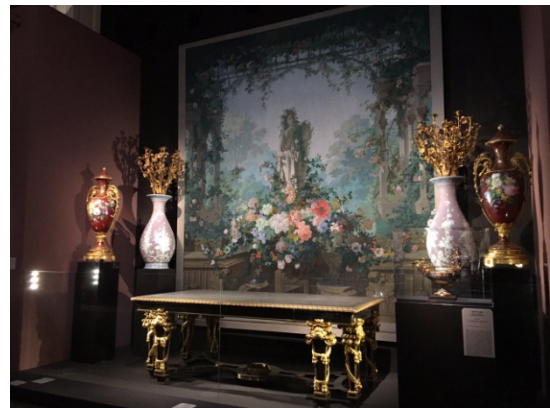
「輝煌的第二帝國」特展展廳。