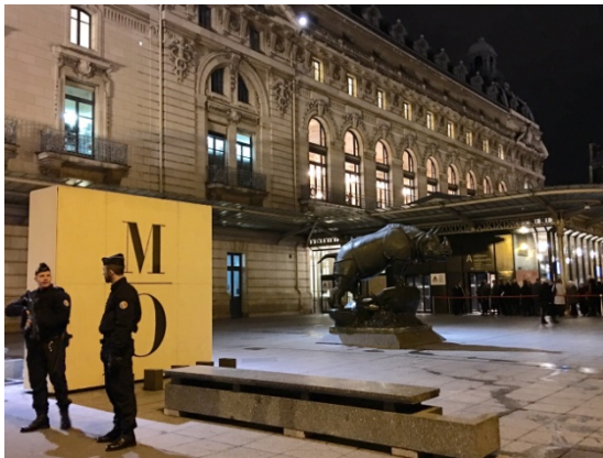
奧塞博物館館慶入口。