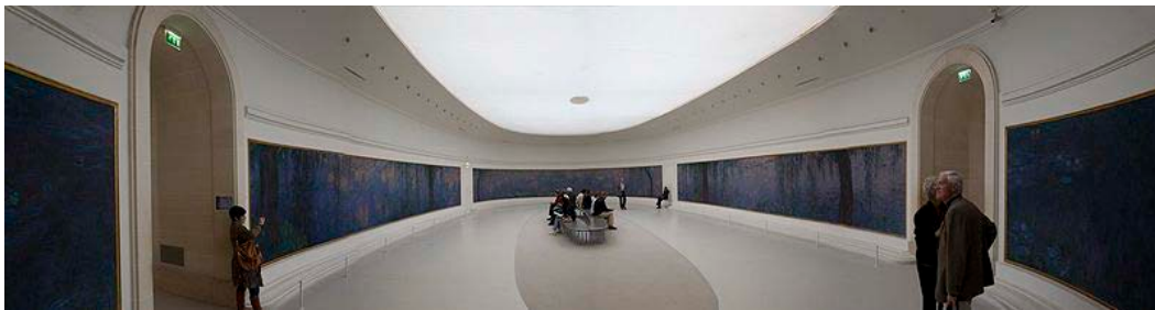
橘園美術館展示之Claude Monet著名睡蓮系列畫作。