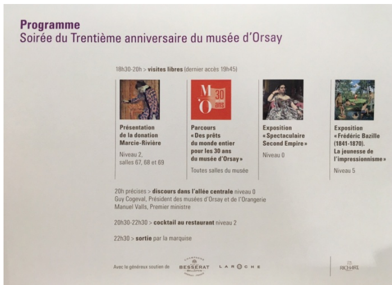
三十周年館慶慶典晚會開放四個特展特別參觀簡介。