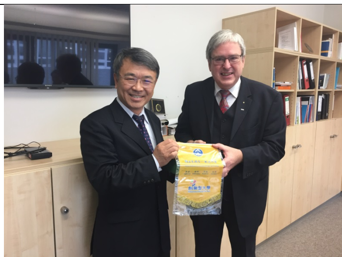
11/30 拜會布蘭登堡科技大學校長