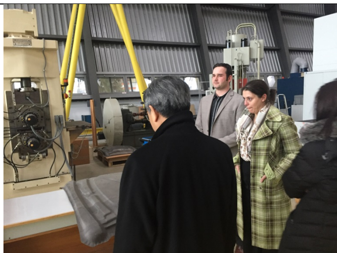
11/30 參訪布蘭登堡科技大學實驗室