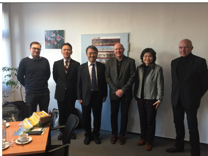
11/29 拜會馬格德堡-施滕達爾應用科技大學