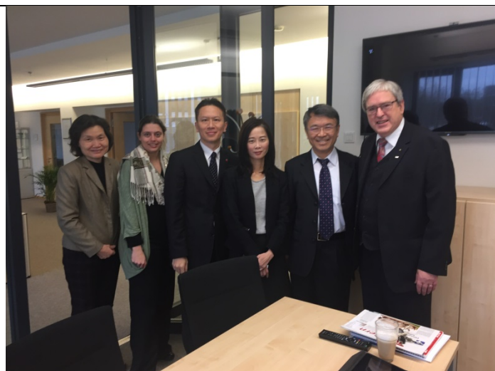
11/30 參訪團與布蘭登堡科大接待主管合影