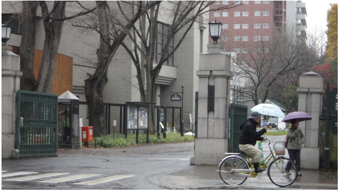
圖三：北海道大學正門