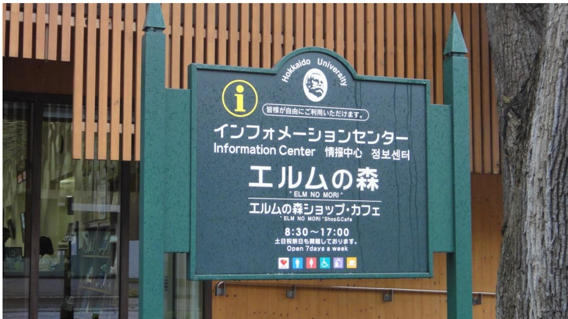
圖二：北海道大學資訊中心