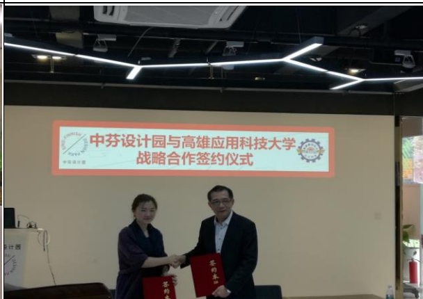
活動說明:高應大校友總會與中芬設計園海峽兩岸青年創業基地簽約儀式