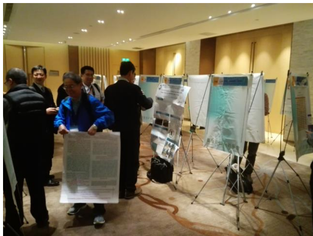
圖 2 與會學者於海報發表區熱烈討論