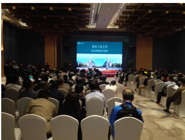
圖 1 大會會場(西安工業大學校長致辭)