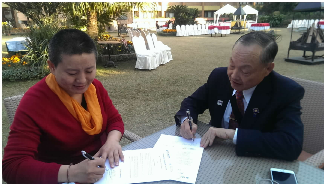
照片 9 與本會人員娥舟文茂簽定表演內容