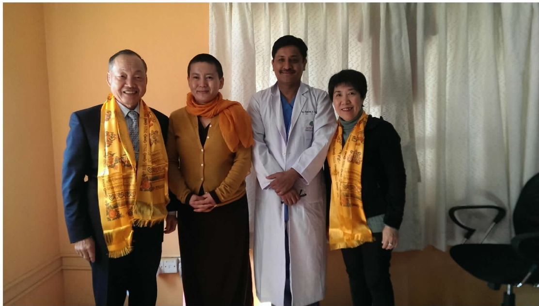
加德滿都洗腎中心與女尼及謝瑞特醫師合影