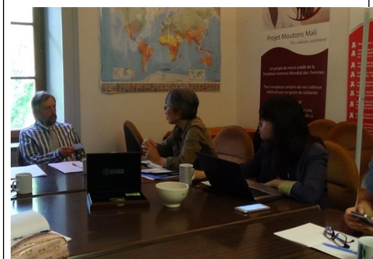
於機構參訪時交流情況