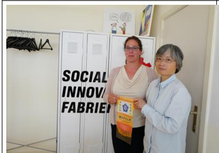
參訪社會創新工廠(Social Innovatie Fabriek)