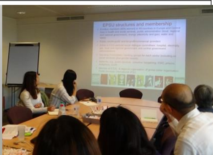
參訪歐洲公共服務工會(European Public Service Union, EPSU)