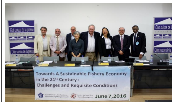
國際平行會議：21世紀永續漁業發展的條件與挑戰