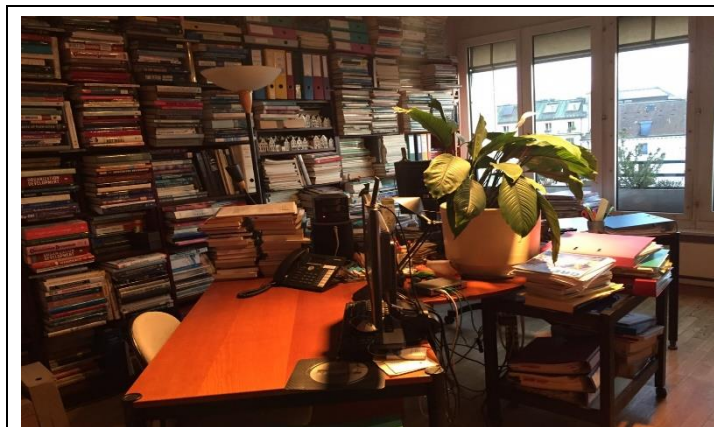
實習機構工作環境