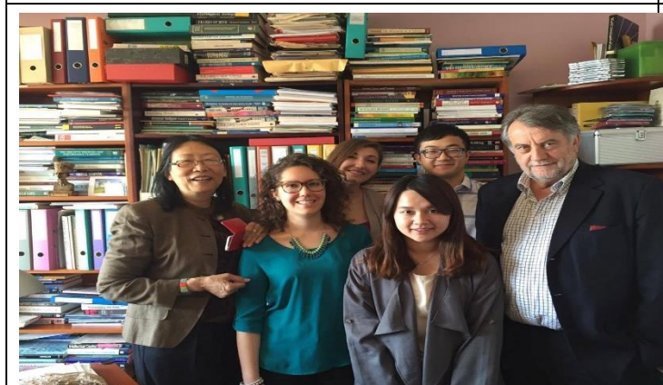
實習生與實習單位執行長