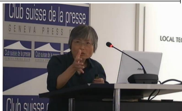
國際平行會議：21世紀永續漁業發展的條件與挑戰