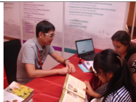
蒲盈志組長協助介紹本校