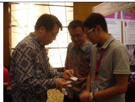
駐印尼代表處至本校攤位參觀