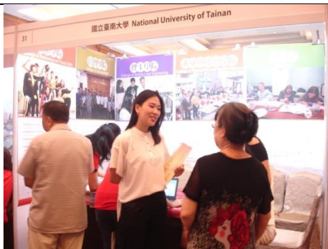
本校經營與管理學系之印尼校友協助介紹本校