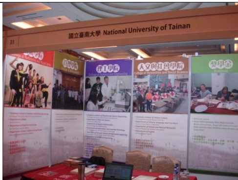
雅加達教育展攤位(正面)