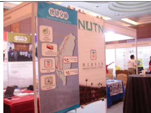
雅加達教育展攤位(側面)