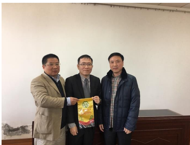
與南京工業大學金融系趙主任(左)及會計系張主任(右)合影