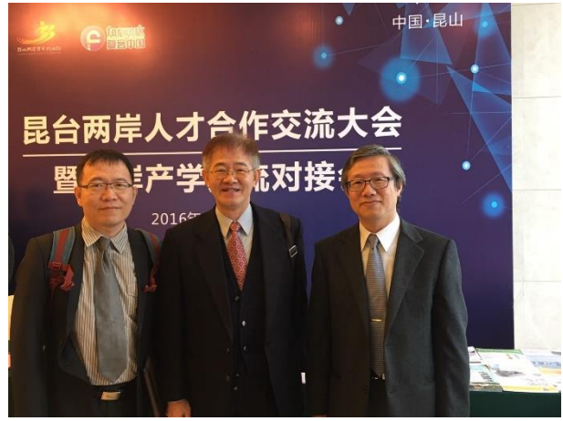
在會場內與王副校長及童老師合影