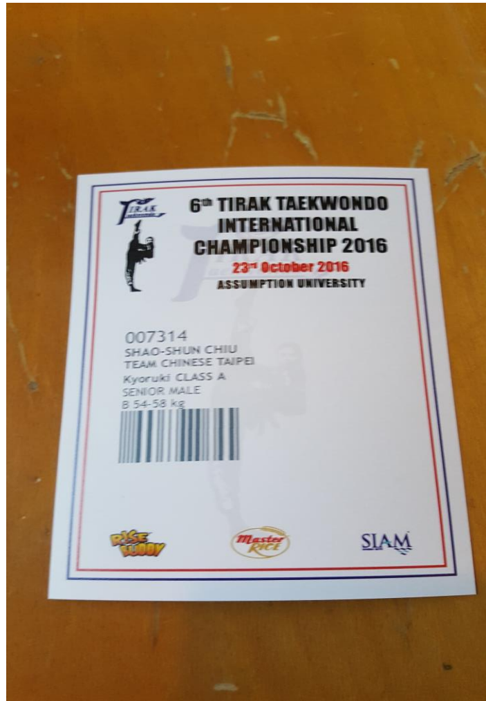
圖 10 本人選手證之掛牌