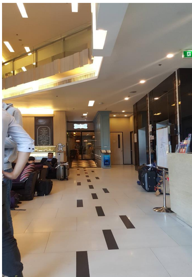
圖 3 抵達住宿飯店 VIC 3 飯店於曼谷市區

競賽期間因適應上的調整與經費考量上，中華隊擇以四星等級飯店作為選手休息的場所，同時飯店內也有簡單的健身房與游泳池能應付簡單的體能維持訓練。