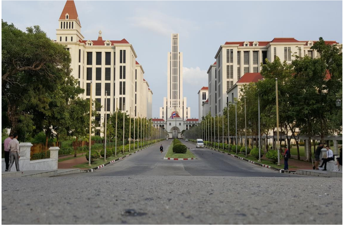
圖 8 易三倉大學(Assumption University)競賽會場一隅