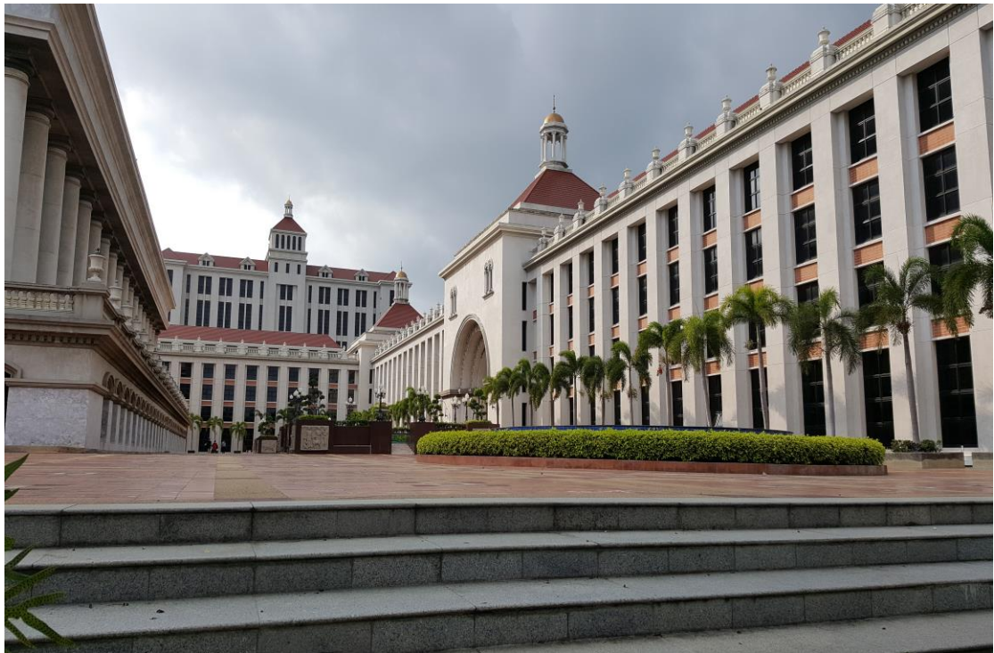
圖 9 易三倉大學(Assumption University)競賽會場一隅 校園的美麗陳設與華麗的顏色會讓人留念，且當下在校園中放鬆散步時會讓人意猶未盡，校內建築獨具一格的设计使人難以忘懷。