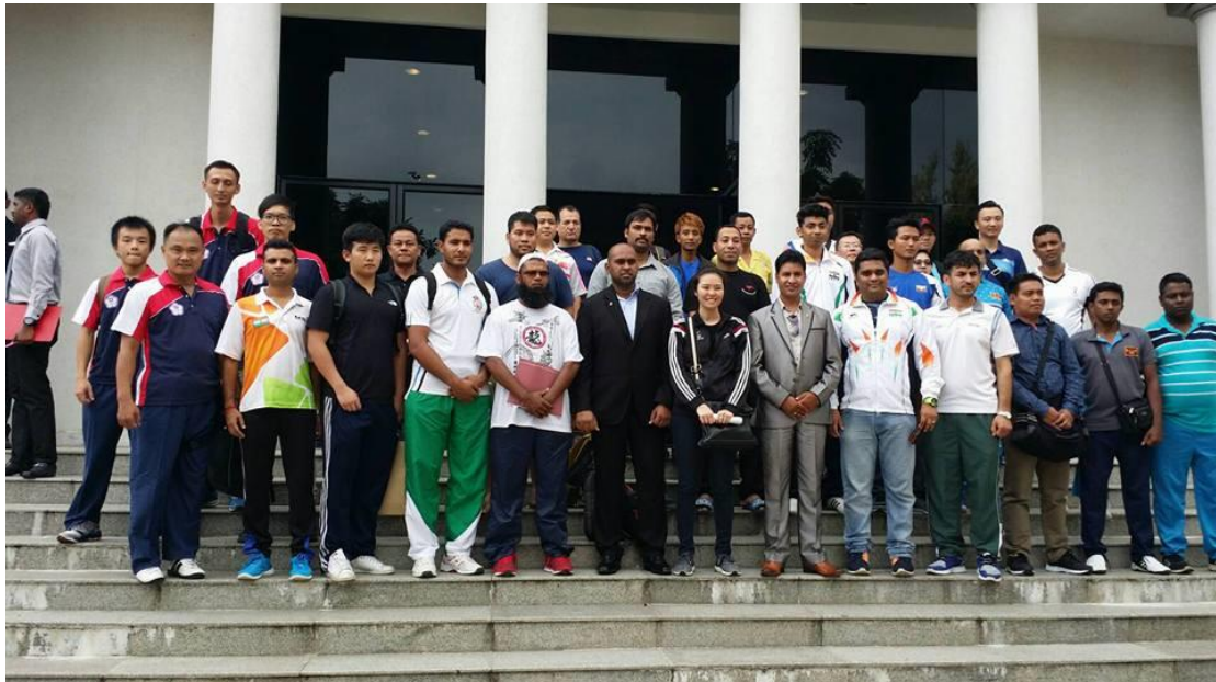
圖 12 各單位選手教練合影(圖左為中華隊本次參賽教練與選手)