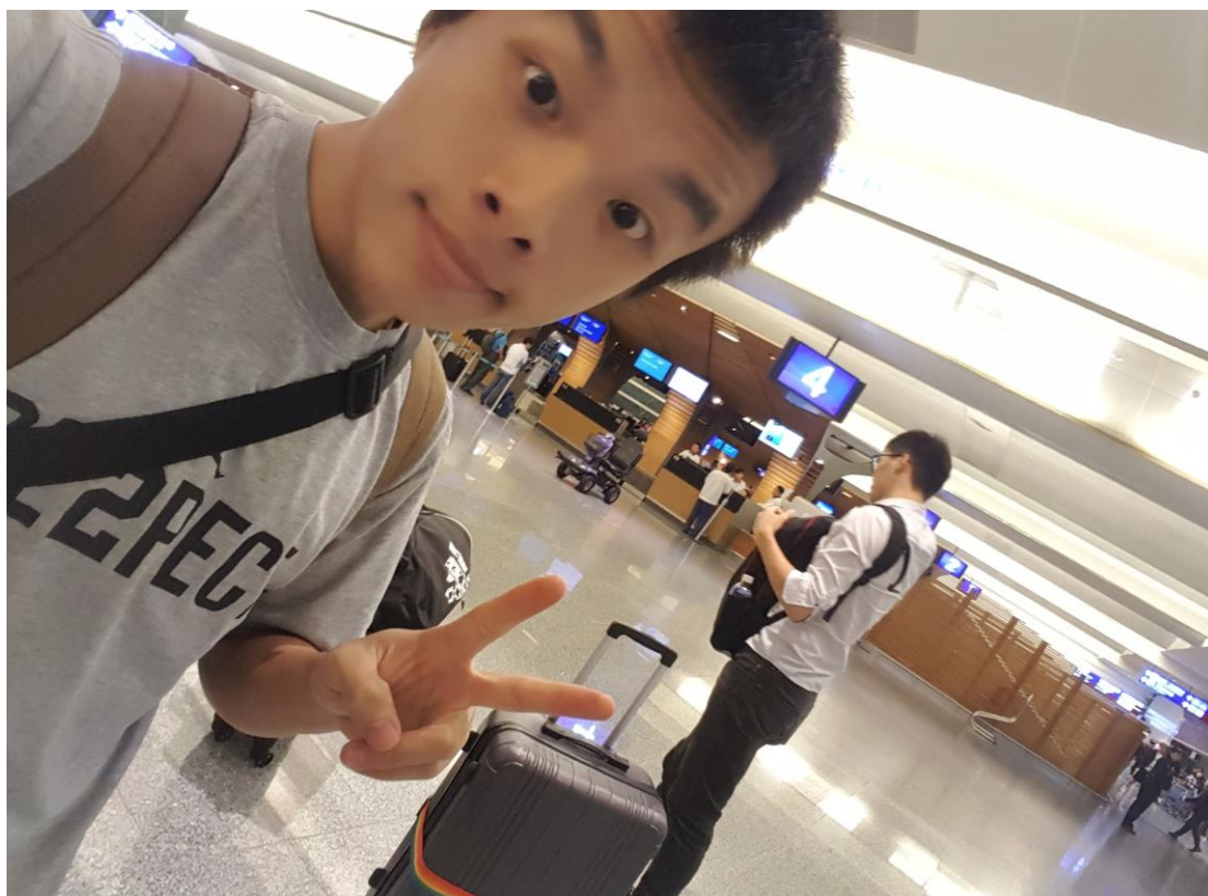
圖 1 出發日與指導教練於機場做行李確認

因此行適逢泰國國喪的服喪日期，故全隊保持尊重態度穿著合適之顏色服裝前往泰國參加賽事。