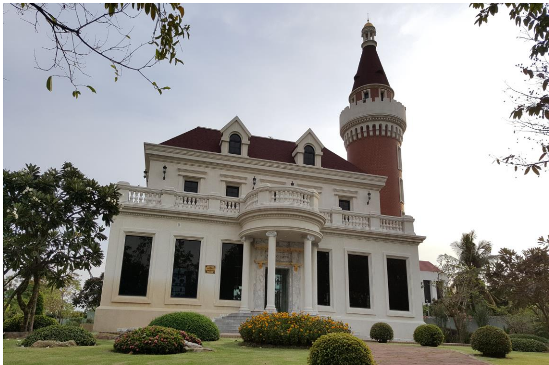
圖 7 易三倉大學(Assumption University)競賽會場一隅

易三倉大學(Assumption University)是泰國一所私立天主教大學，創建於1969年，有三座校園，分別在北欖府素萬那普地區、華馬校區、以及曼谷市中心的Central World Plaza。其英文校名「Assumption」為「 聖母升天 」之意。