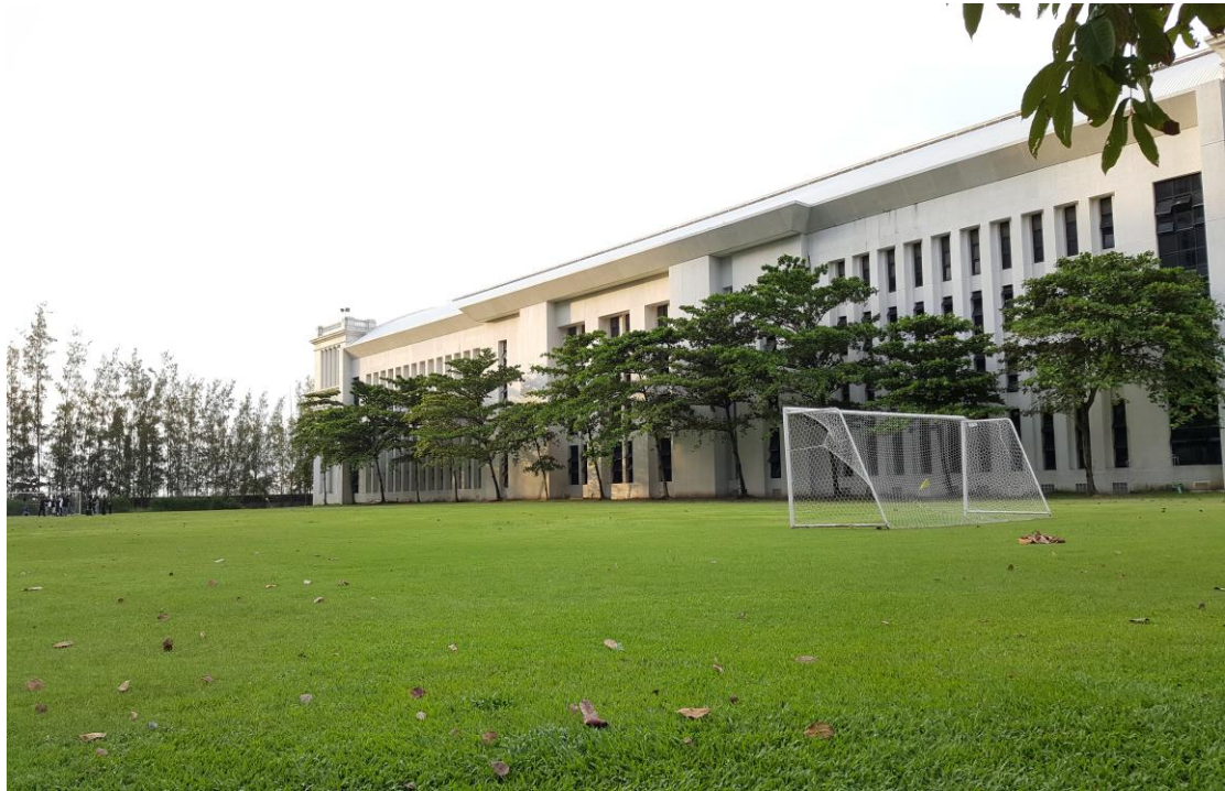
圖 6 易三倉大學(Assumption University)競賽會場一隅