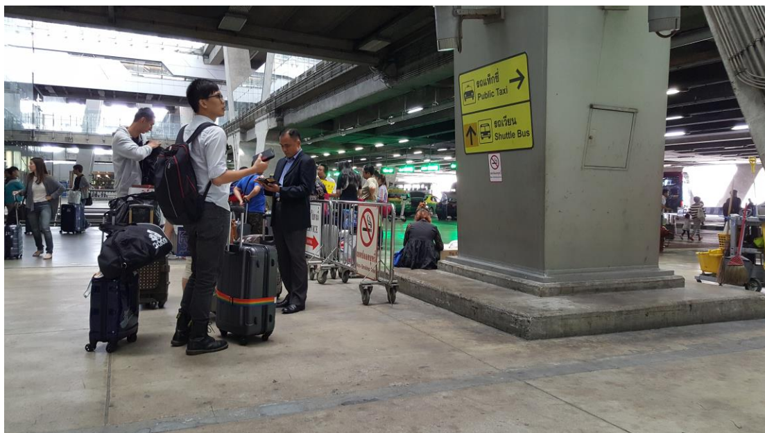
圖 2 抵達曼谷國際機場(BKK)時在等待當地領隊