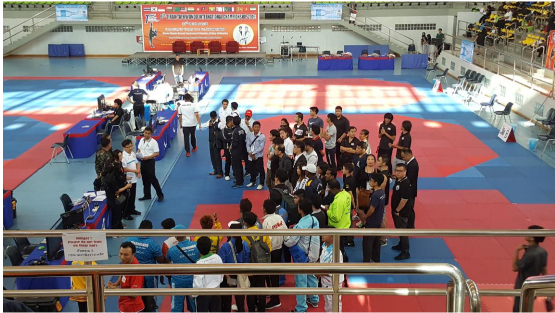
圖 11 賽前教練會議