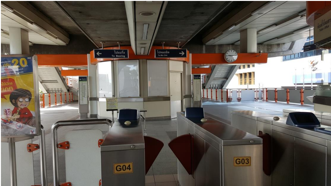
圖 4 & 圖 5 準備搭乘當地捷運至競賽會場附近用餐