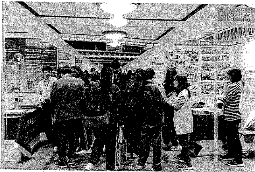
◎ 不少學生到場了解赴台升學資訊。

【專訪】二零一六年台灣高等教育展昨日開幕，並將一連兩天在漁人碼頭舉行，教育展共有八十八所台灣大學參展，向本澳學生提供赴台升學資訊。