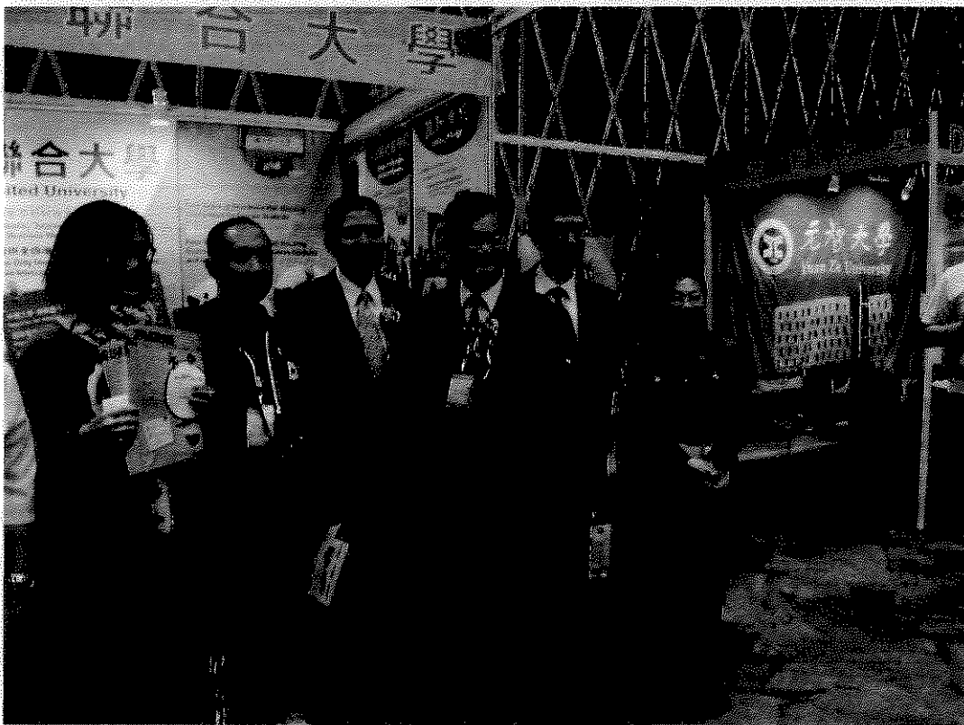
澳處盧處長、海聯會蘇主委、教育部劉專門委員及澳處李組長與國內大學參加教育展人員合影。