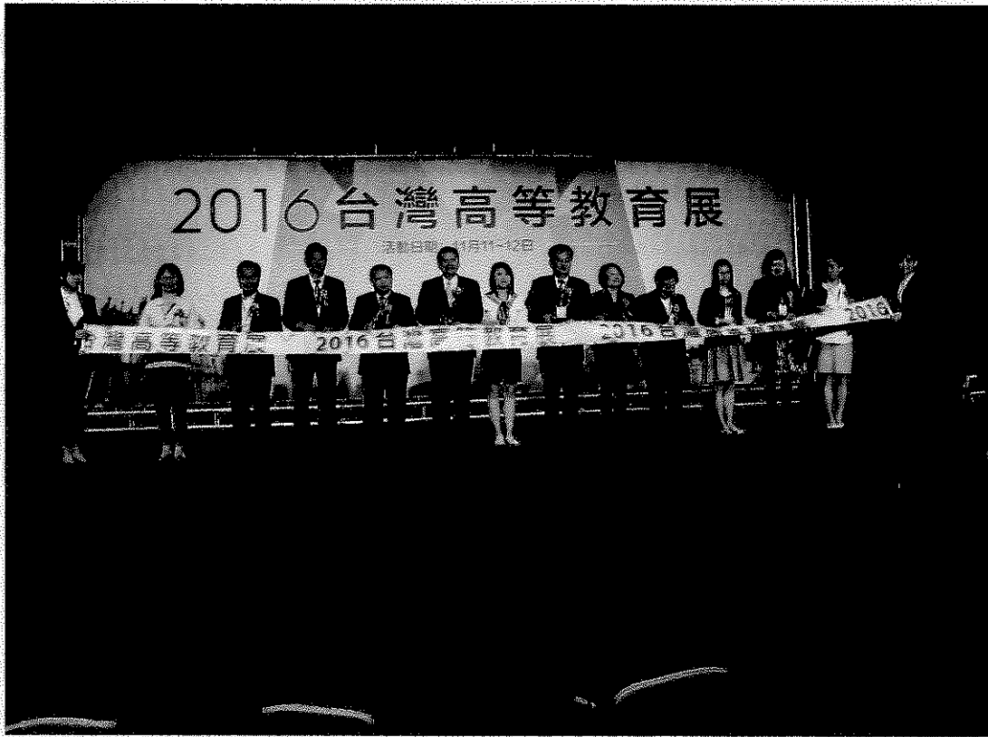
「2016 年臺灣高等教育展」開幕典禮嘉賓剪綵。