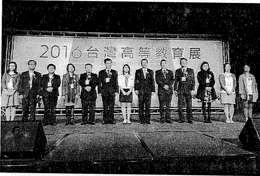
◎ 二零一六年台灣高等教育展昨日開幕。