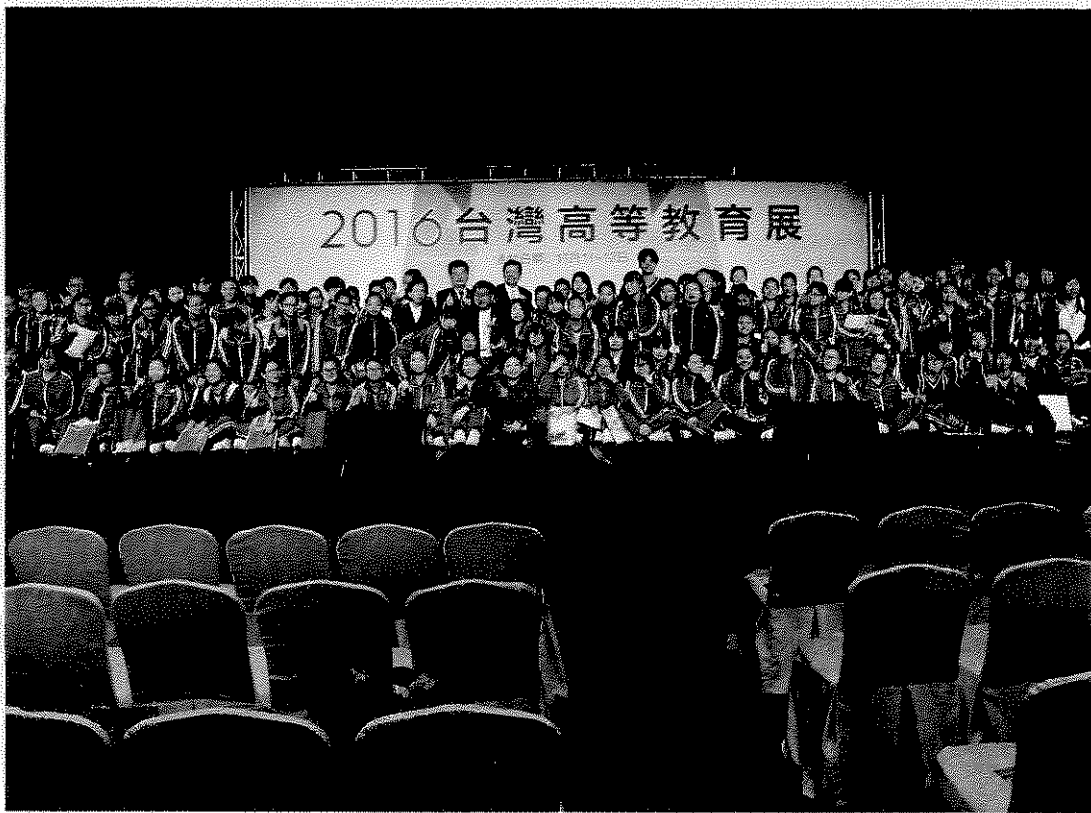
澳處盧處長及李組長與參加教育展之澳門中學生合影。