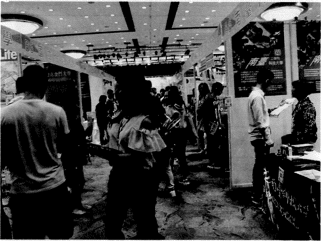
教育展開幕第 2 天參觀人潮。