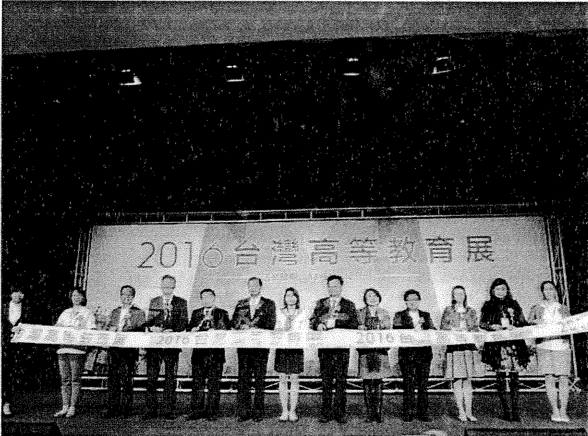
主禮嘉賓舉行剪裁儀式