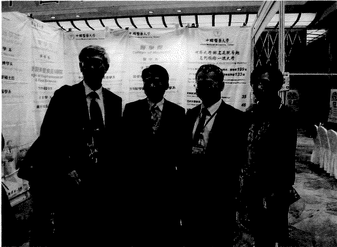
教育部代表與國內大學參加教育展人員合影。