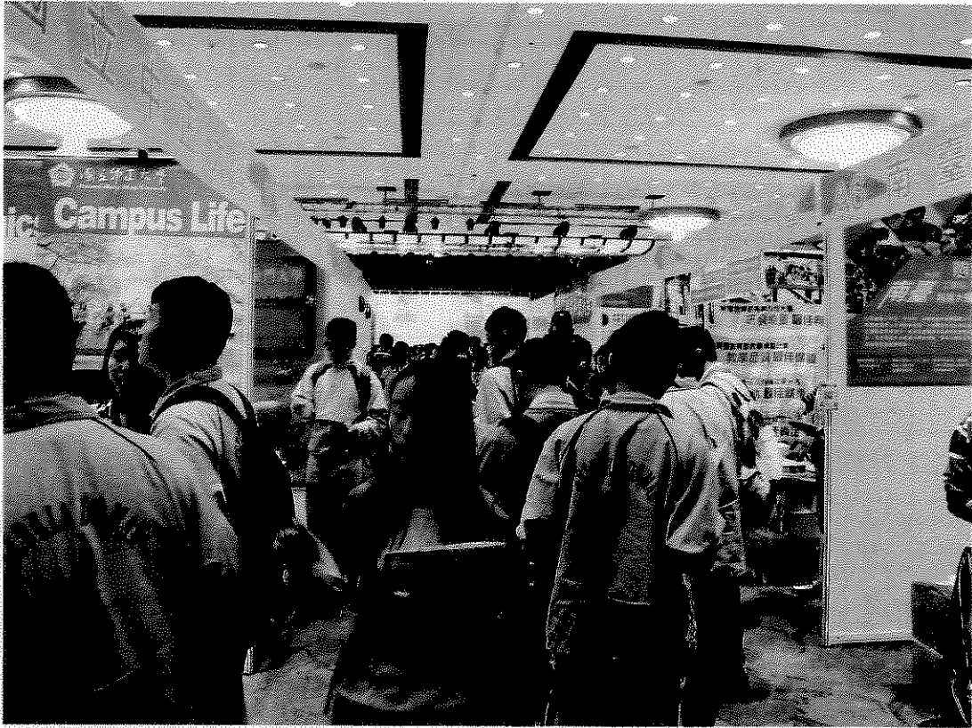
教育展開幕第 1 天參觀人潮。