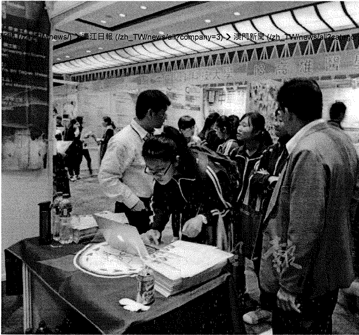
學生向參展大學院校資訊

【特訊】“2016澳門台灣高等教育展”於昨、今兩日假漁人碼頭會議展覽中心舉行，有88所台灣大學院校參展，展期正逢“個人申請”報名期間，本澳學生可與台灣院校代表面對面了解學校辦學理念、教學資源、學系特色等資訊。