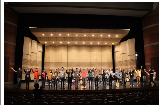
NCO 全體團員於杭州劇院演出前總彩排 (2016.11.12)