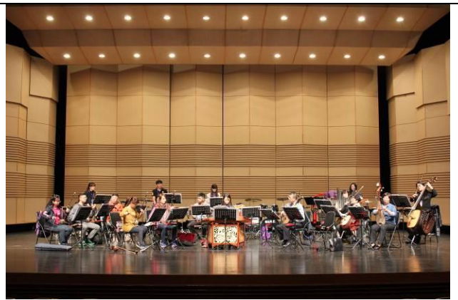
「NCO 全體團員於杭州劇院演出前總彩排 (2016.11.12)