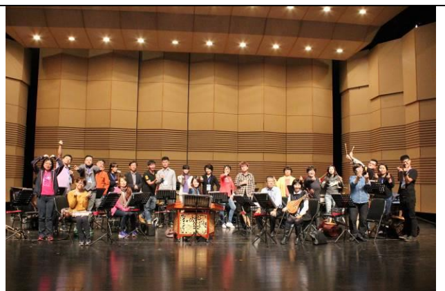
NCO 全體團員於杭州劇院演出前總彩排 (2016.11.12)