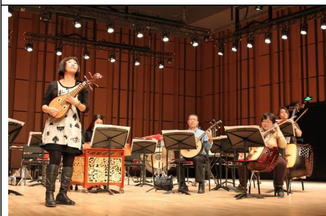
NCO 全體團員於浙江音樂學院音樂廳演出前 總彩排(2016.11.11)