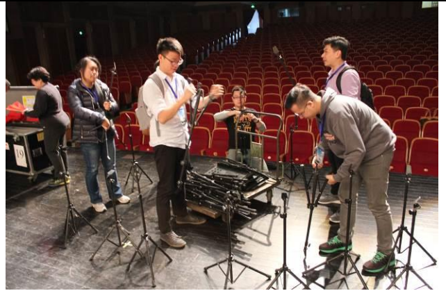
NCO 全體團員於杭州劇院總彩排前裝台 (2016.11.12)