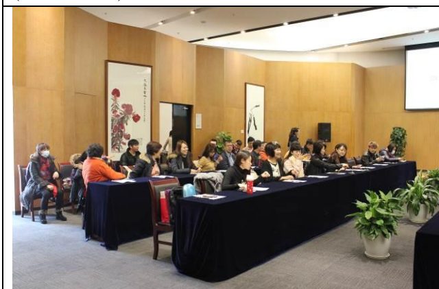
NCO 全體團員與浙江音樂學院中國音樂學系 進行學術交流。(2016.11.11)