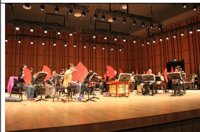
NCO 全體團員於浙江音樂學院音樂廳演出前 總彩排(2016.11.11)