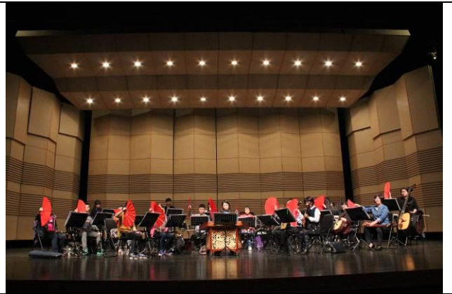
NCO 全體團員於杭州劇院演出前總彩排 (2016.11.12)