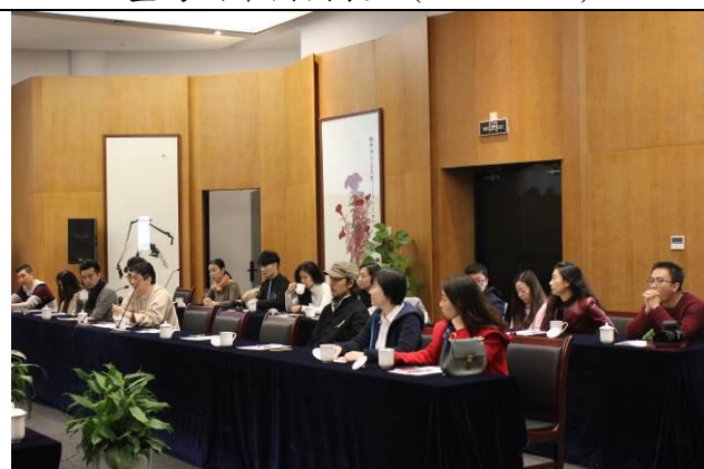
NCO 全體團員與浙江音樂學院中國音樂學系 進行學術交流。(2016.11.11)