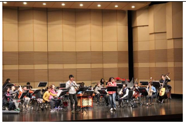
NCO 全體團員於杭州劇院演出前總彩排 (2016.11.12)