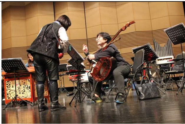
NCO 全體團員於杭州劇院演出前總彩排 (2016.11.12)