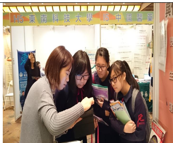
圖 4：與澳門學生解說本校入學管道