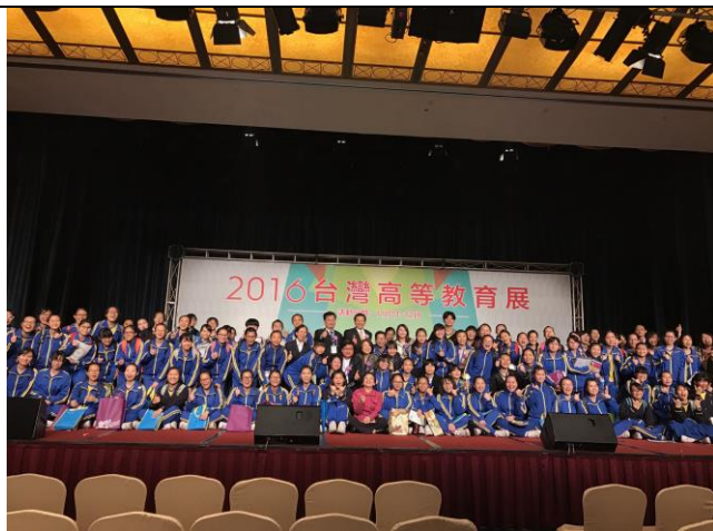
圖 7：澳門教育展盛況