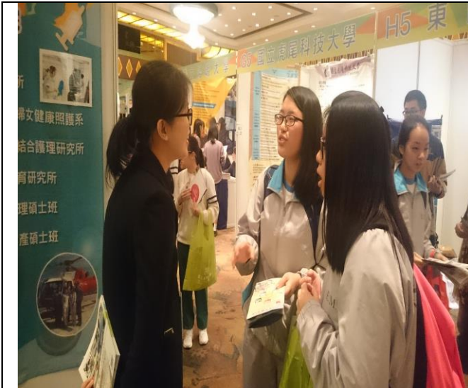
圖 5：與澳門學生解說外籍生入學管道