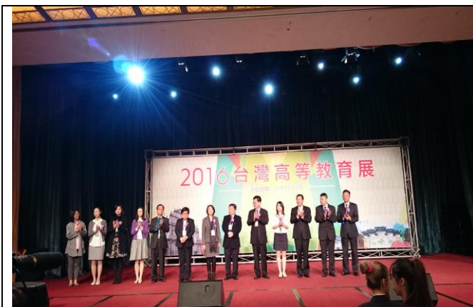
圖 11：澳門教育展開幕式