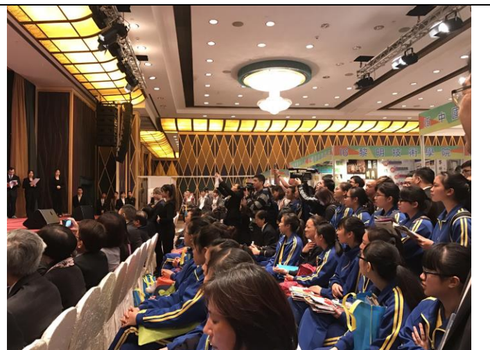
圖 10：澳門學生參加教育展開幕式