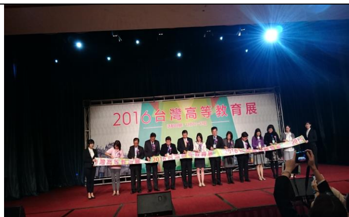
圖 12：澳門教育展開幕式剪綵