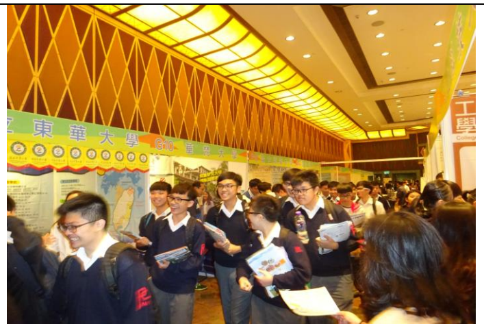
圖 8：澳門教育展盛況