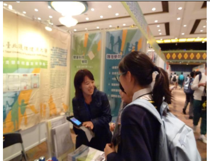
圖 6：與澳門學生解說本校特色科系