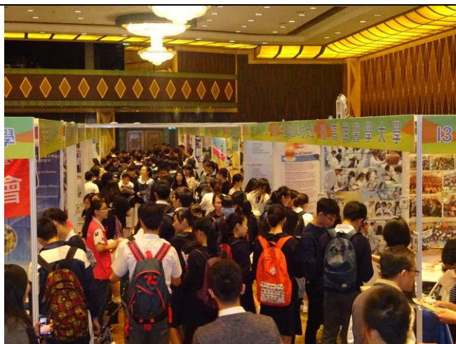
圖 9：澳門教育展參展學生