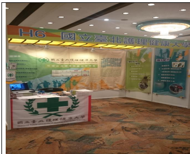
圖 1：澳門教育展攤位