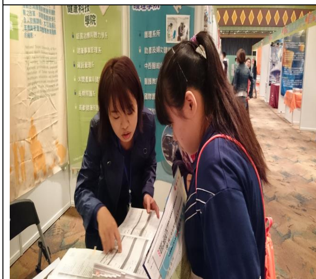
圖 3：與澳門學生解說本校課程