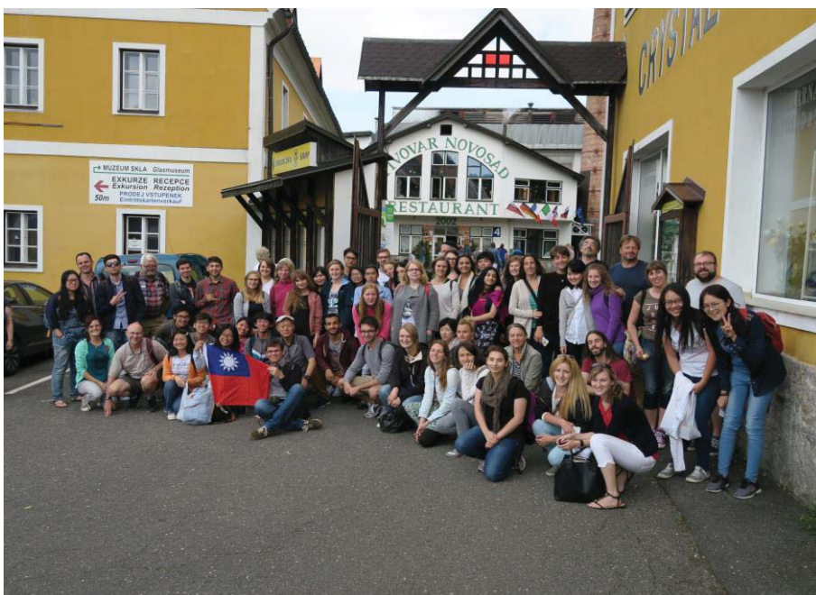
(照片說明：參觀玻璃工廠)