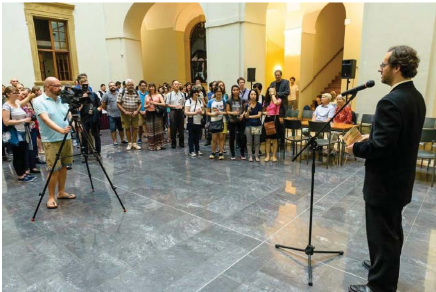
(照片說明：帕拉茨基大學始業晚宴)