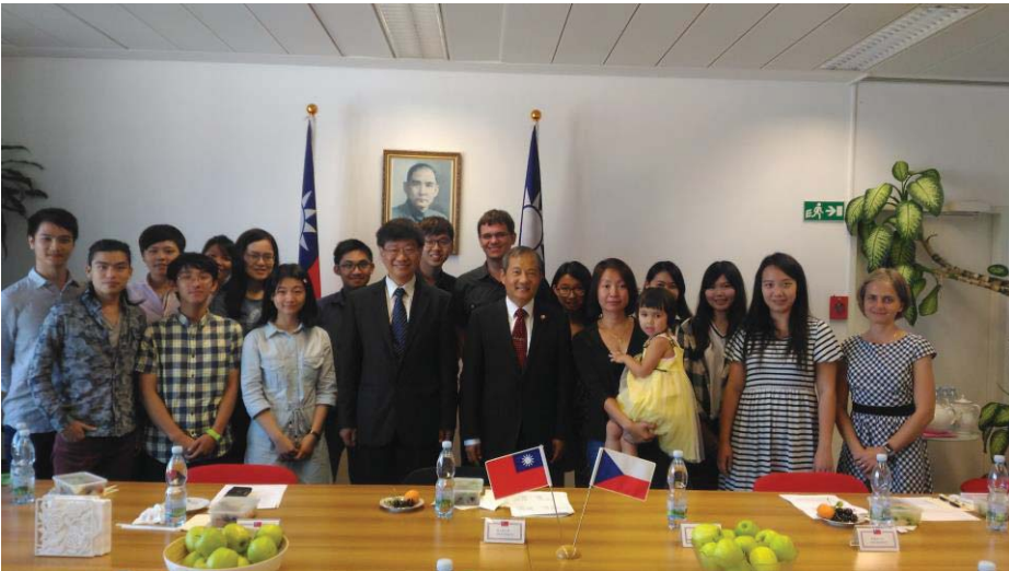
(照片說明：參訪駐捷克台北經濟文化辦事處)