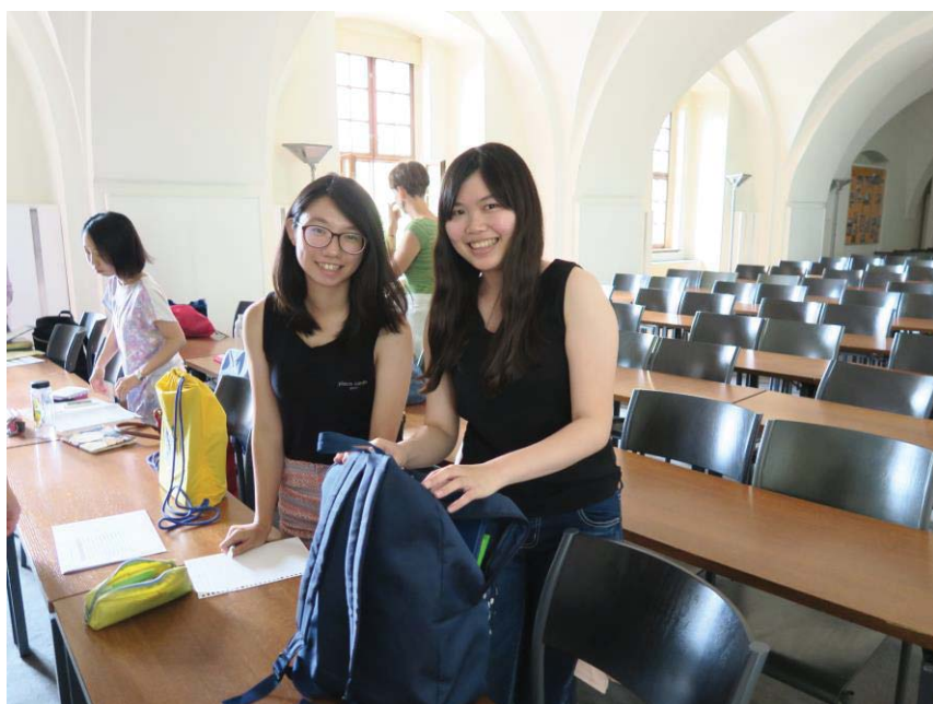
(照片說明：下課時分)