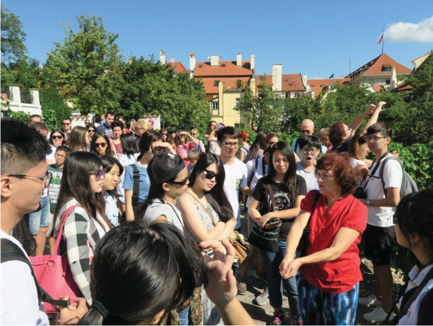
(照片說明：布拉格城堡區導覽)