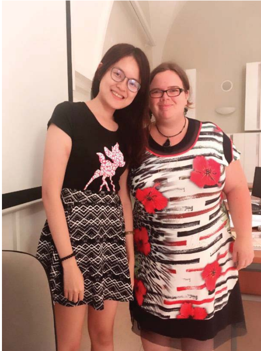
(照片說明：與夏季學校班上教師合影 [左])

這次的旅途，看了台灣看不到的文化，整個人豁然開朗起來，也覺得流連忘返。也期許自己以後有機會可以再踏上這片土地，進行一趟紓壓以及增廣見聞的旅程。這是一個很棒的遊學團，期望更多人也能參加夏季學校，一起學習，一起成長！