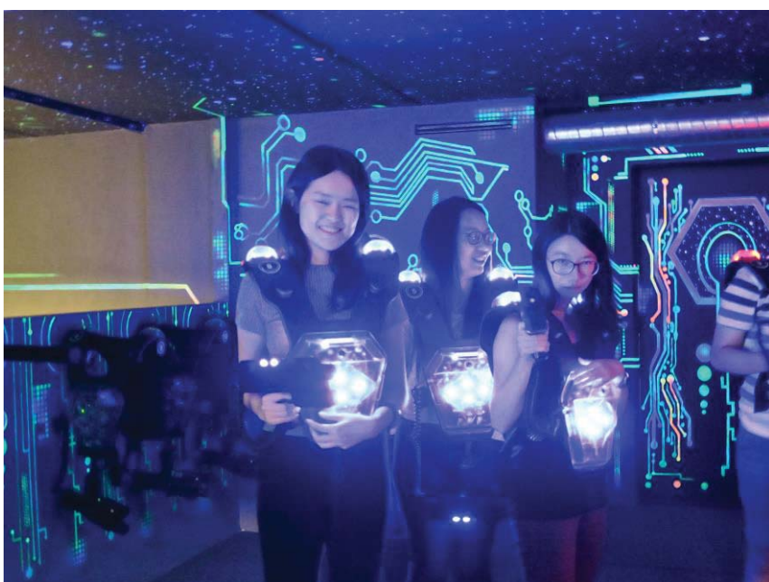
(照片說明：分組進行雷射互動遊戲)