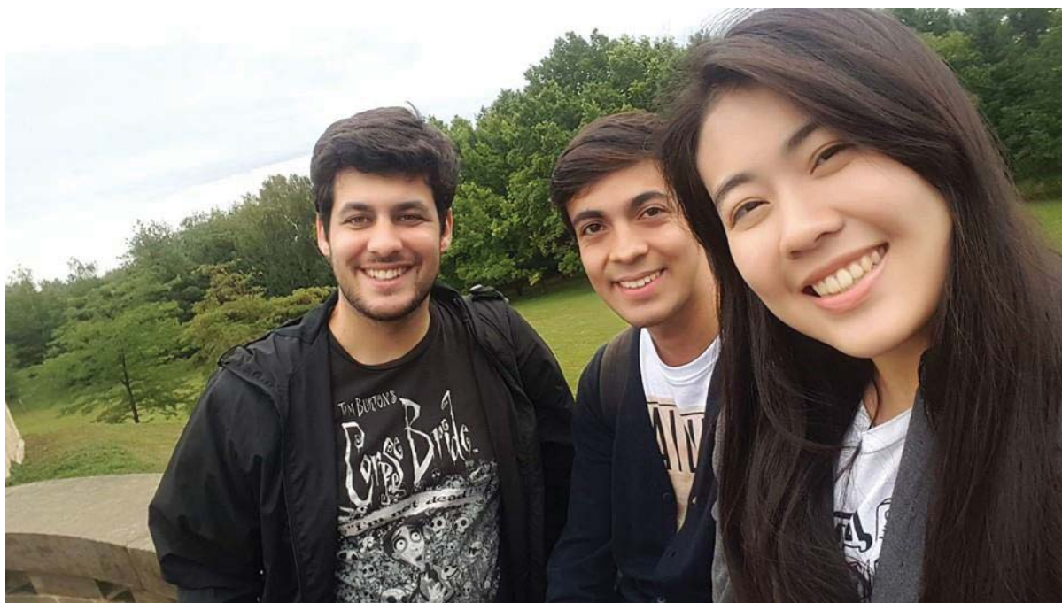
(照片說明：與夏日學校同學合影)

此次研習很幸運能來到捷克，這個國家很大也美麗，除了上課，剩下的時間都被旅遊、散步與參觀展覽等等活動所占滿，生活十分充實。藉由這一個月的時間，真正體會捷克的在地文化，以往課本內無法了解的內容或永遠也被不起來的單字，在布拉格生活著很自然地就能吸收；在暑期學校內更能遇見來自世界各地的新朋友，彼此互相交流，學習捷克語的同時，也在學習正視並珍惜自身的文化。