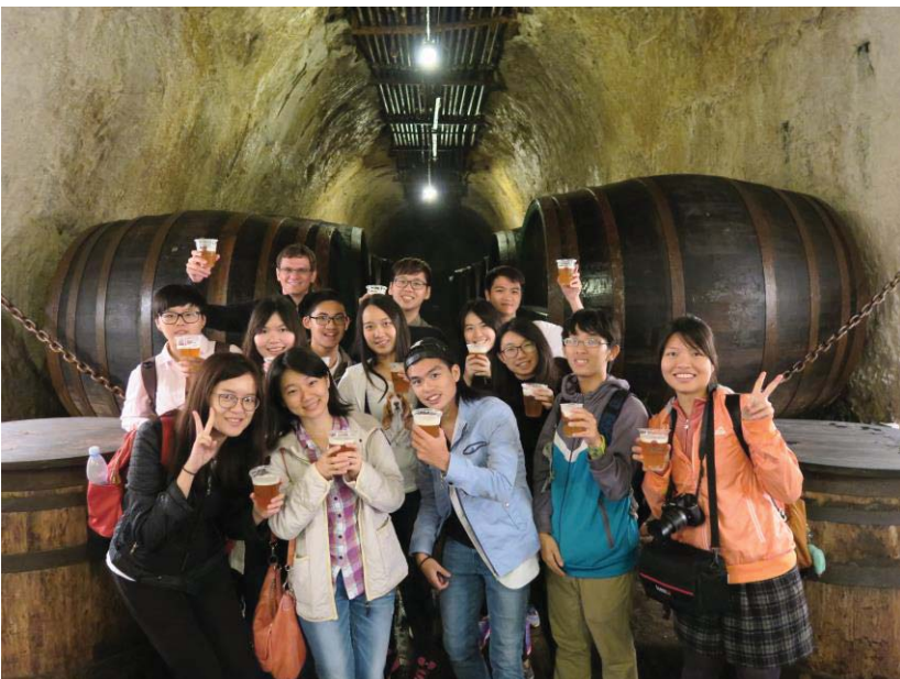
(照片說明：參觀皮爾森釀酒廠)