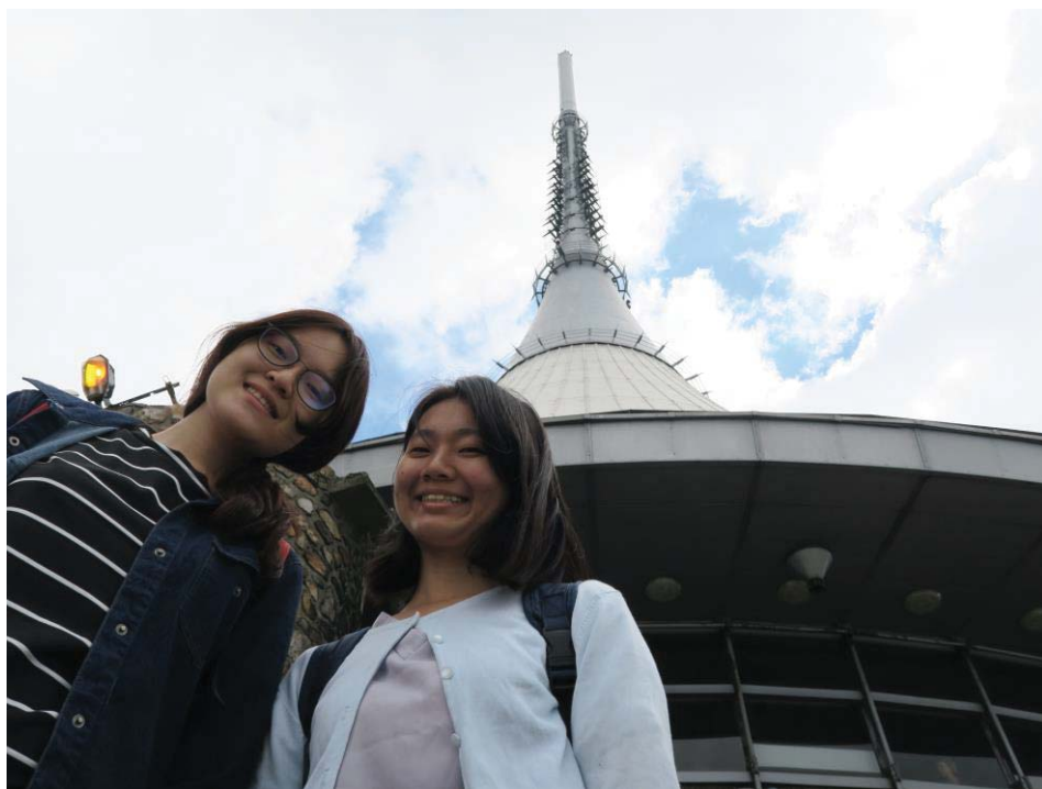
(照片說明：與台灣同學一同出遊[右])

我在 olomouc 的暑期學校待了兩個禮拜，每天在學校有 4 個小時的語言課程，即使是完全不會捷克文的人也可以上，語言學校的課程其實滿扎實的，而且因為課堂中不斷地練習日常對話，以及生活中在餐廳點餐或在路上看到的單字，都會自然而然地學起來，所以其實短短兩個禮拜卻學了很多東西。我們都住在學校的宿舍，我的室友是國際學生，所以不僅課堂上可以認識到外國學生，你也有可能跟外國學生住在一起，所以在暑期學校上課除了能學到捷克文，最重要的是能夠認識到其他國家的人，了解許多不同文化，或是感受到文化衝擊，我認為旅行最有趣的地方就是即使你只去了一個國家，你卻因為認識了許多人，而感覺去了許多國家。短短三個禮拜的時間，捷克這一個文化深厚，盛產啤酒，有著美味食物的國家，我想會吸引我想再去一次的原因會是它讓我感受到的自由、放鬆的生活氣氛。