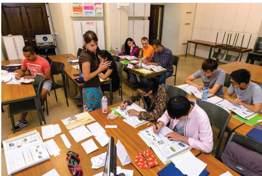
(照片說明：初級班上課實況)