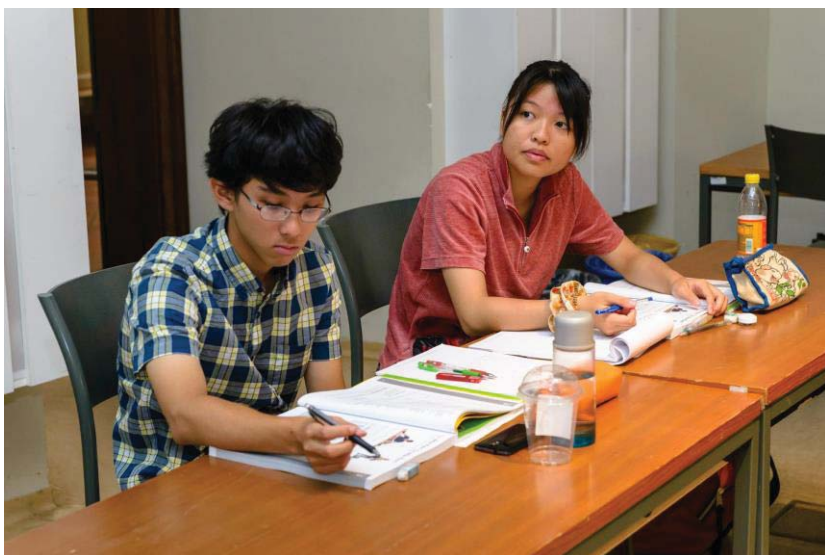
(照片說明：初級班上課實況)