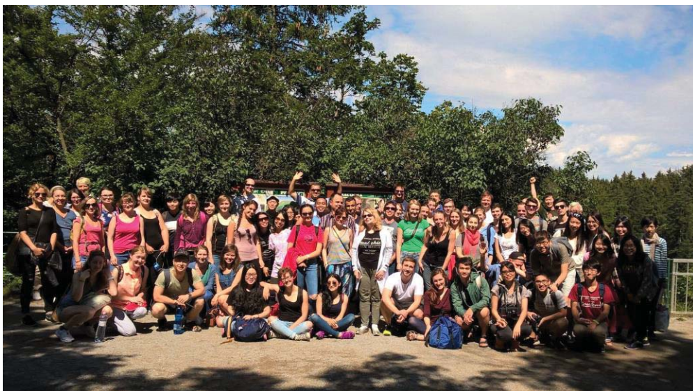
(照片說明：南摩拉維亞喀斯特地形之旅)