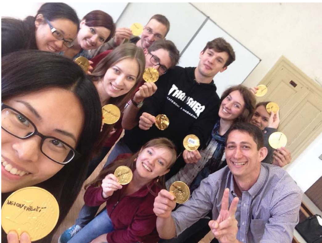
(照片說明：與夏季學校師生合影 [下左一])

在和其他學生來往過程中我漸漸體驗到：我們對歐洲的概念、時事其實並不是很熟悉，絕大多數時候我們以口耳相聞的刻板印象對某個國家有一個框架後，便鮮少有更深入了解，反之亦然，或許是距離所致，東亞對他們來說是一個遙遠且模糊的概念，起初在介紹自己的國家上並非容易，但如果能以文化、節慶方面切入，便能引起他們的濃厚興趣，另一發現是在飯局間的話題經常離不開足球和政治，與台灣不同，在飯局上評論各國內政外交是稀鬆平常的事，對時下各式議題：英國退出歐盟、恐攻事件、敘利亞難民等，多數同學對來自不同國家的人詢問該國現況、對於國家元首施政的看法、外交政策，在我看來這是一個很特別的光景，因為這般在餐桌、酒館、散步聊天談論政治的方式不常出現在台灣，我們經常同仇敵愾地責難一項有缺失的政策或政治人物，這麼做的目的大多是希望的是拉攏同樣想法的群眾，而非道出邏輯性的推論、將各種的想法一起討論，這樣的經驗是值得我們學習，並運用在探討社會議題的方法上。