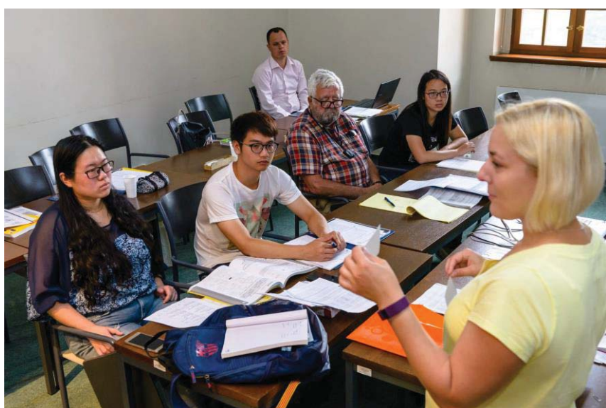
(照片說明：初階班上課實況)