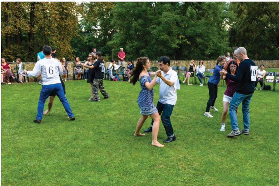
(照片說明：民俗舞蹈之夜)