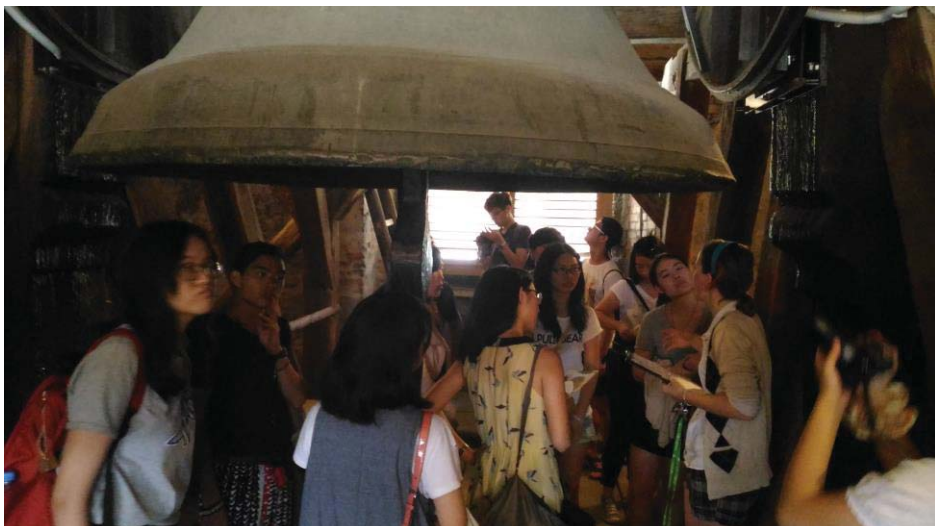
(照片說明：在 Lípnič 小鎮參觀鐘樓)