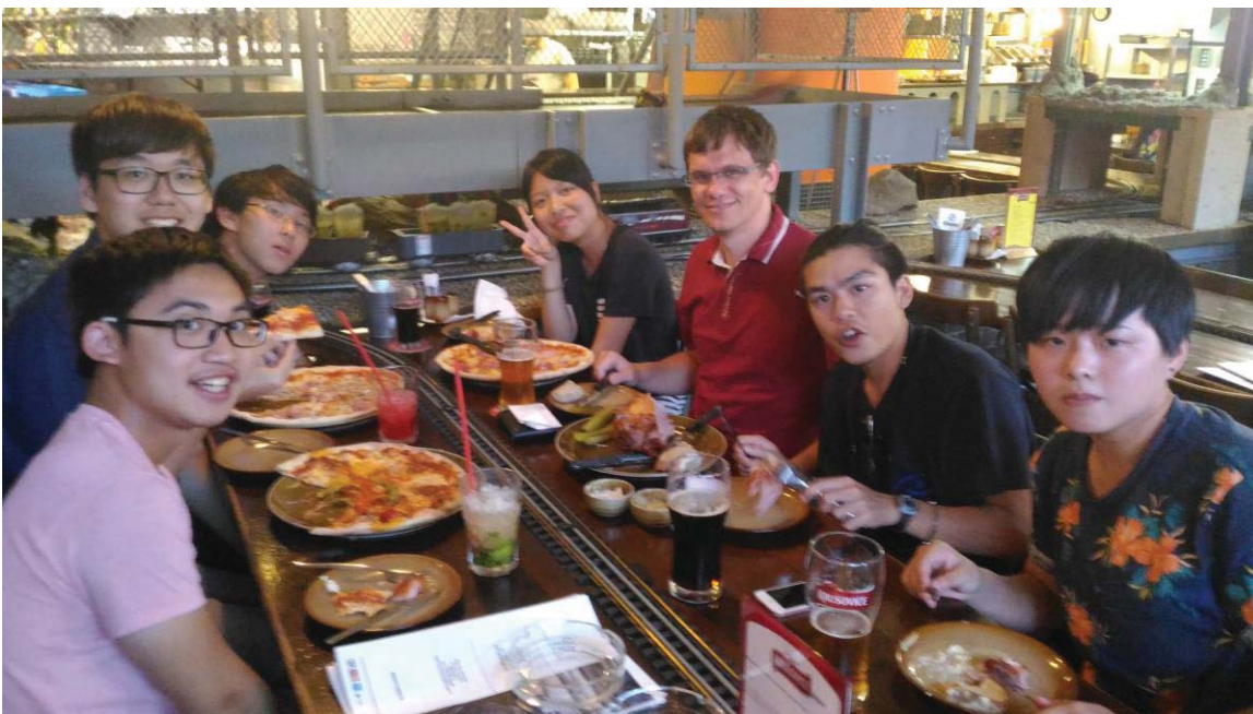
(照片說明：於 Vytopena 晚餐[左中])

離開學校後我們又回到了布拉格。而查理大橋，是離開捷克最後的臨去秋波。為了避開拍照人潮，我們清晨就前往，沒想到已經有多組拍婚紗照的新人在橋上拍照，委實浪漫，亦更添興味。最後充滿不捨的離開捷克，盼有緣能再造訪此地，締造不一樣的回憶。