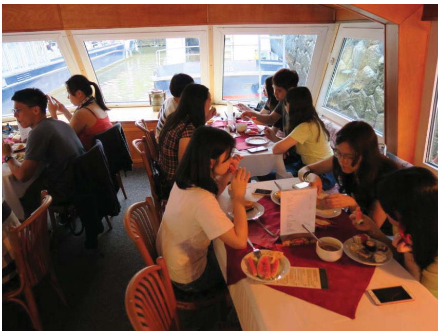
(照片說明：在伏爾他瓦河乘船導覽及用餐)