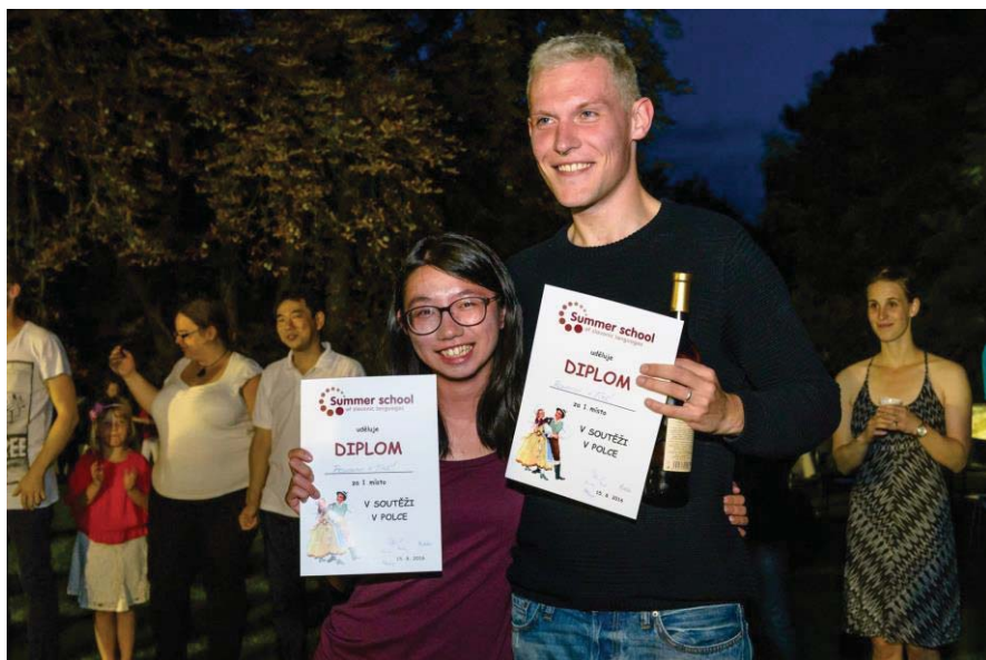
(照片說明：結業晚會)