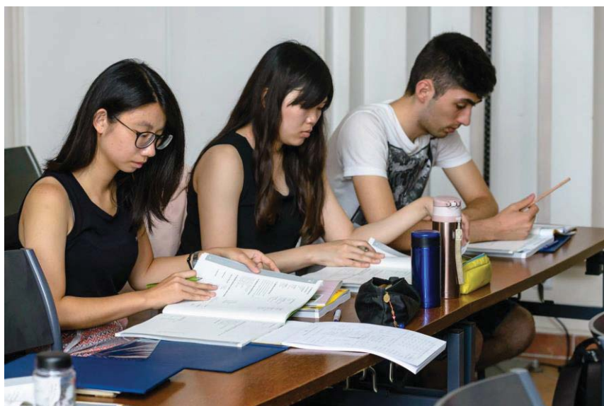
(照片說明：進階班上課實況)