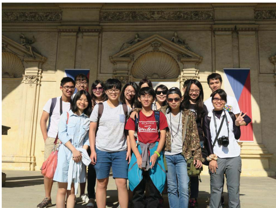
(照片說明：與台灣學生出遊[前排中])

在台灣聽著捷克的故事、看著捷克的照片、說著捷克文，總覺模糊而沒有交集，但在踏上捷克後，一切都有了連結。