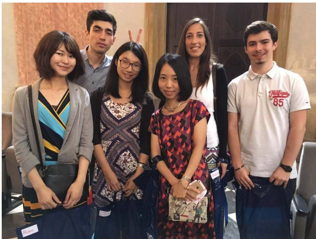
(照片說明：與夏季學校同學合影 [前排左 2])

學了捷克文一年，卻總覺得很空虛。直到踏上捷克這塊土地，沐浴在捷克文的環境裡，我才真正能夠使用語言、也同時感受到捷克豐富的文化與生活。在蓋伯特老師的帶領下，我們能夠更深度的旅遊，並體驗捷克不同地方的風俗民情；而夏日學校有每日的捷克文課程、課後有許多自由選擇的課程，舉凡文化、電影與工作坊、假日也有出遊的行程，讓我們對捷克有更全面性的了解。藉由這次的遊學經歷，不只在捷克文上有很大的進步、結交來自各地的外國朋友，也對學習捷克語有更大的熱忱，同時也擴大了我的視野。不論是否學習過這個語言，都很建議可以去國外生活看看，不只增加國際觀也會製造很多美好的回憶。