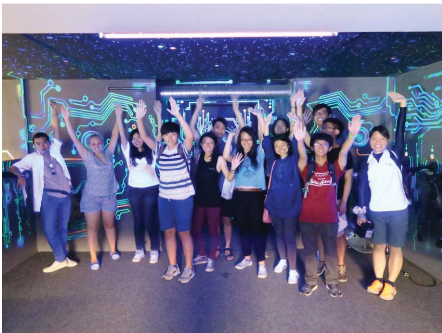
(照片說明：雷射互動遊戲)