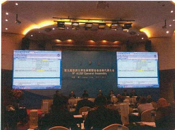
AUSF 會員大會開會情形