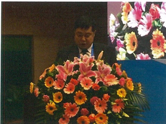
曾秘書長慶裕為 2017 臺北世大運宣傳開場致詞