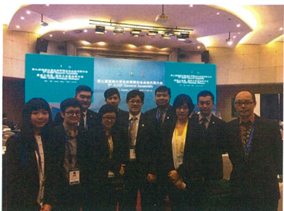
選舉後本團人員與臺北市府合影