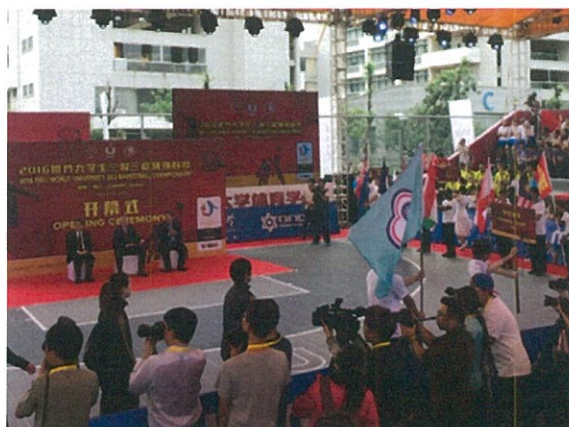
2016 世界大學 3 對 3 籃球錦標賽開幕典禮