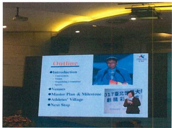
2017 年臺北世大運會議現場簡報