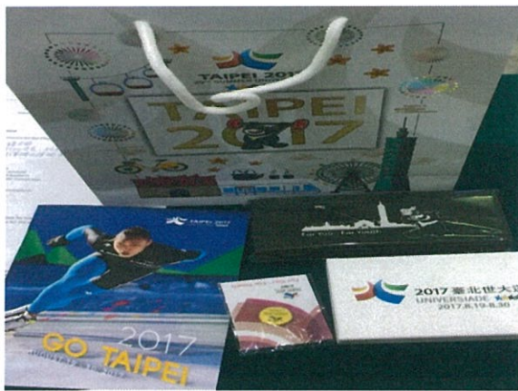
2017 年臺北世大運會議現場發放文宣品