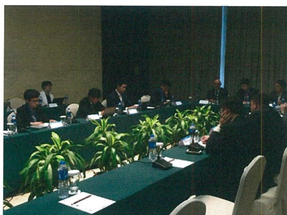
新任 AUSF 執委會開會情形