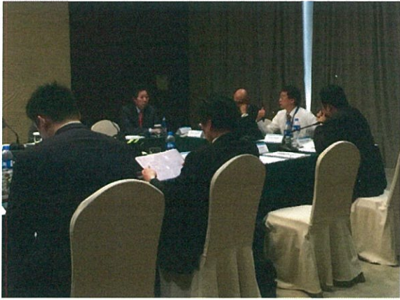
AUSF 第 2 次執委會開會情形