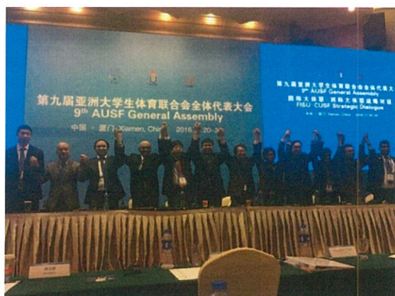
新任 AUSF 執委會成員