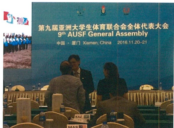
2017 臺北世大運游副執行長適銘與與會代表交流