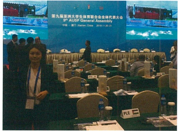
AUSF 會員大會開會情形