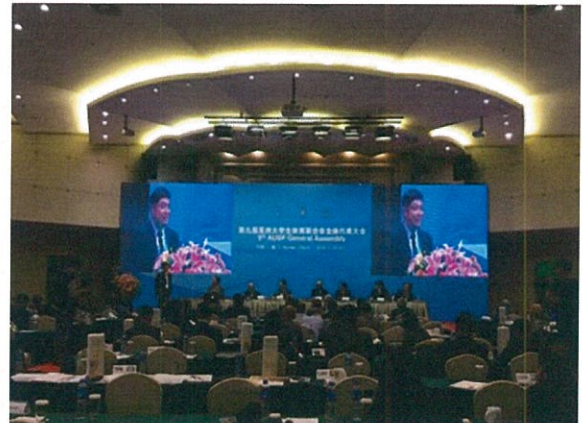
曾秘書長慶裕為 2017 臺北世大運宣傳開場致詞