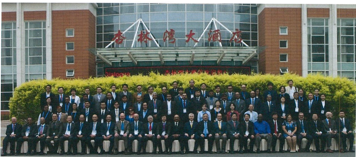
本次 AUSF 所有與會代表會後合影