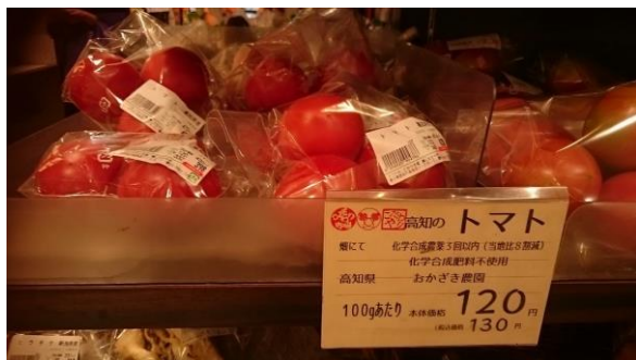
圖 4：池榮青果株式會社池袋捷運站內販售減農藥番茄。