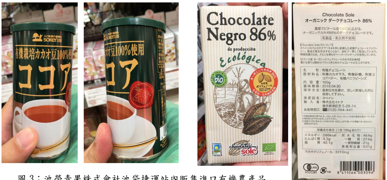
圖 3：池榮青果株式會社池袋捷運站內販售進口有機農產品 (左 2 圖：進口業者未經驗證；右 2 圖：進口業者有經驗證)。