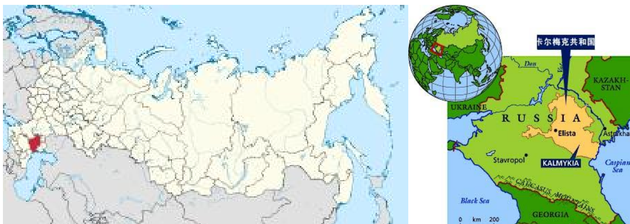
圖一、喀爾瑪克共和國在俄羅斯聯邦中的位置