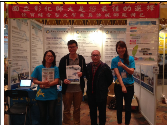
澳友校友會代表赴本校教育展攤位加油打氣。