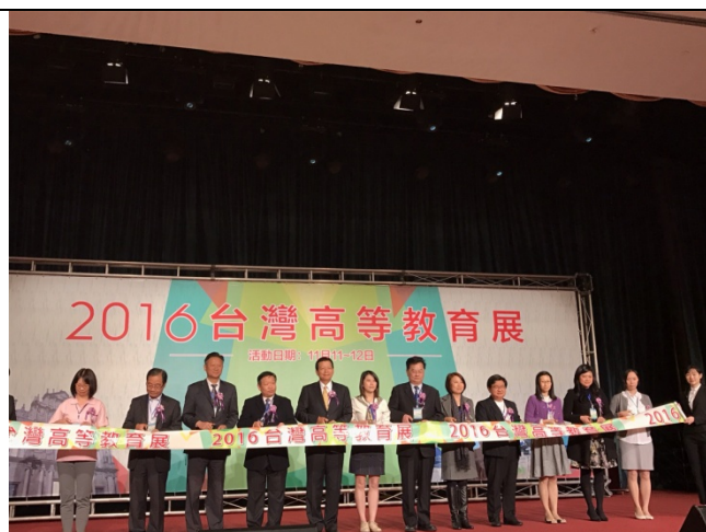
2016臺灣高等教育展開幕儀式。