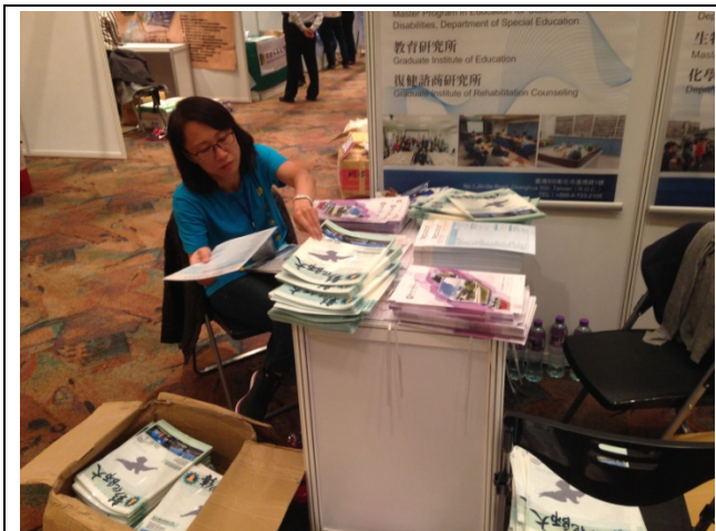
本校參展人員佈置本校攤位及文宣品整合。