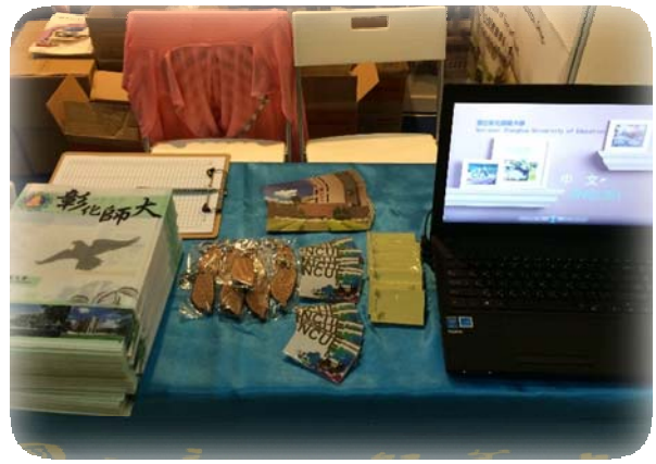
校景明信片、鑰匙等文宣品