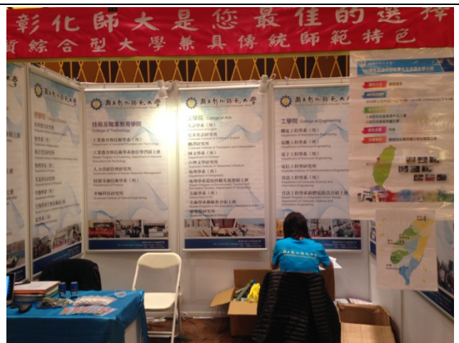
教育展攤位佈置。(各學院背景掛圖8幅、本校紅布條、本校自招報名宣傳海報)