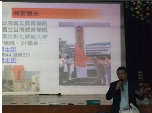
於澳門培道中學進行升學講座