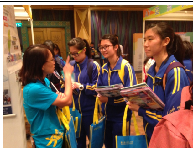
本校參展人員於會場向學生解說。