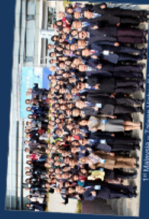
1 st Malaysia - Taiwan Higher Education Forum, 2013