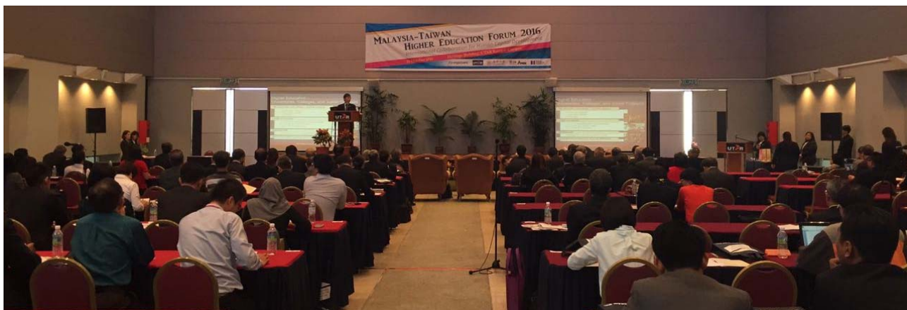
陳政務次長專題演講會場場景

我國目前高等教育政策在於協助研究型大學邁向頂尖，成為世界級的一流大學；透過加強產學合作提升我國產業競爭力；提高我國教學品質；協助東南亞國家培育高等技術人才。