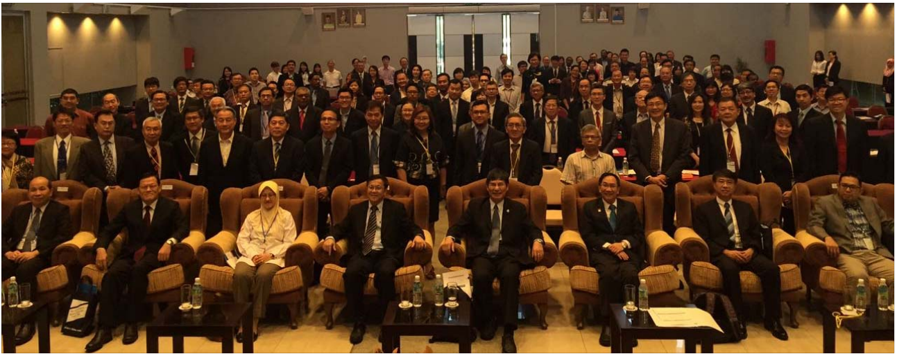
陳良基政務次長（前排右 4）和與會嘉賓合影。