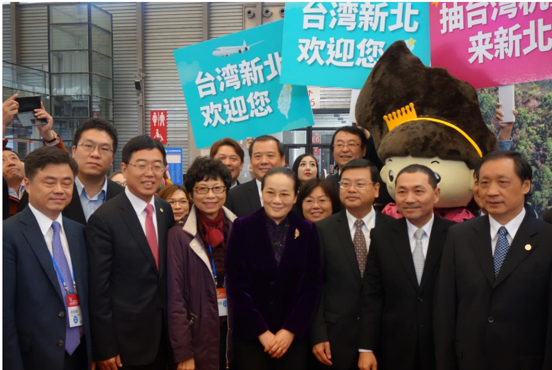
CITM 臺灣館-海旅會李金早會長蒞臨台灣館參觀