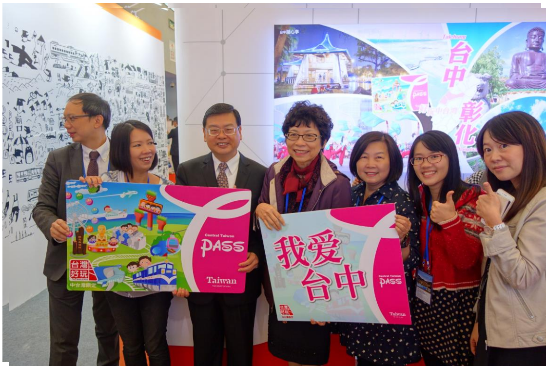
巡視 CITM 臺灣館，與臺灣各參展單位交流相關推廣經驗。