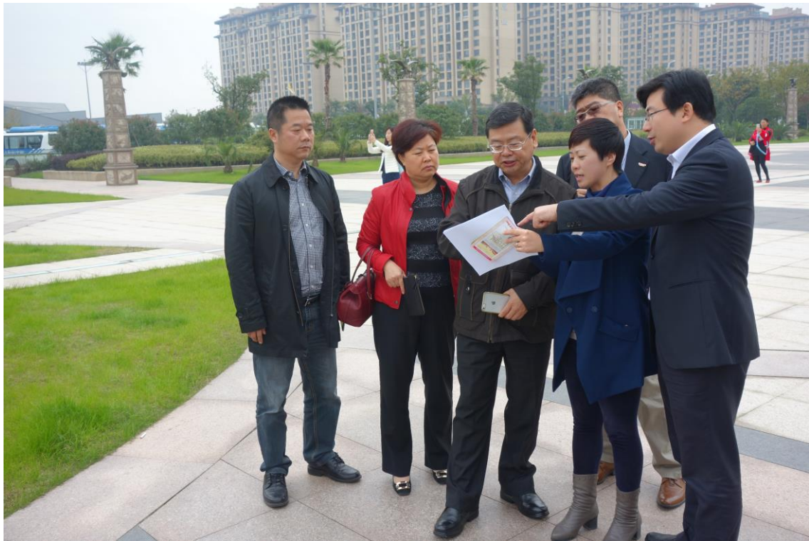
2017 臺灣江蘇燈會交流活動預定場地-常州恐龍園會勘