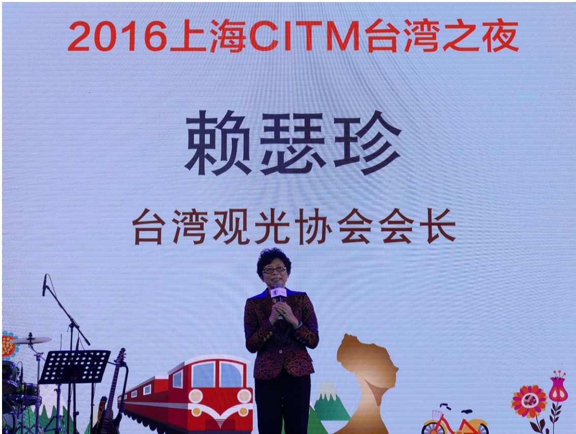
臺灣之夜-賴會長致詞