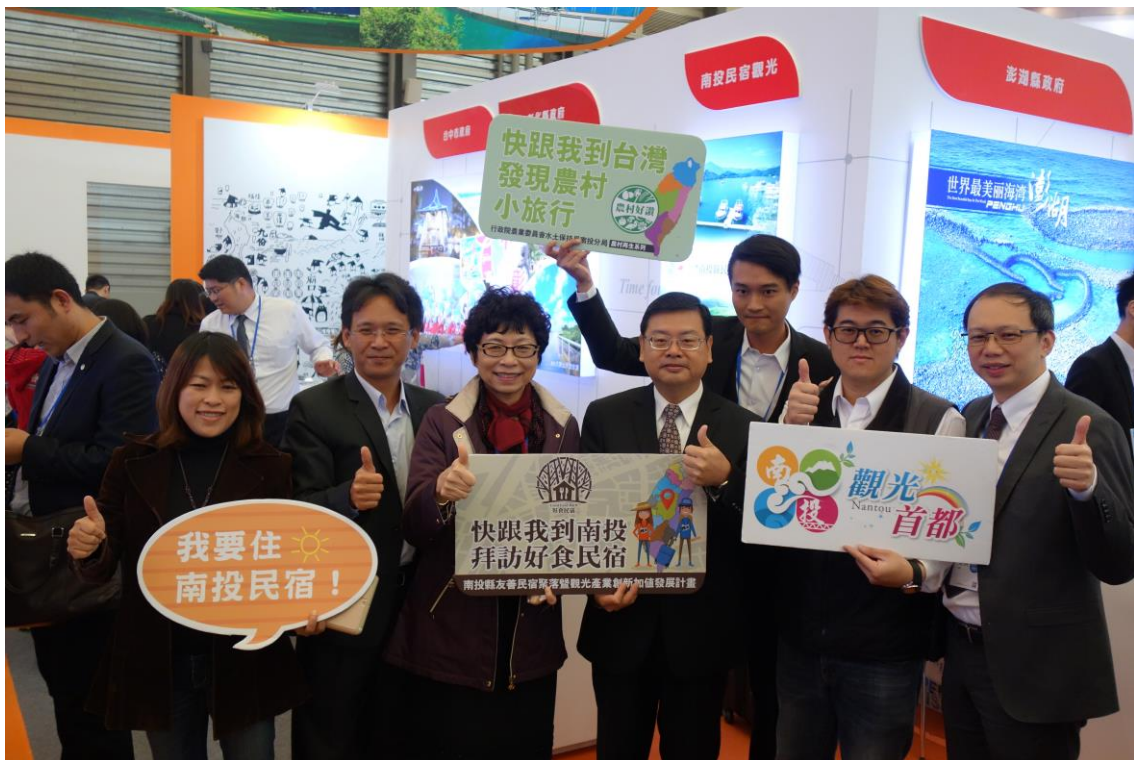
巡視 CITM 臺灣館，為各參展單位加油打氣