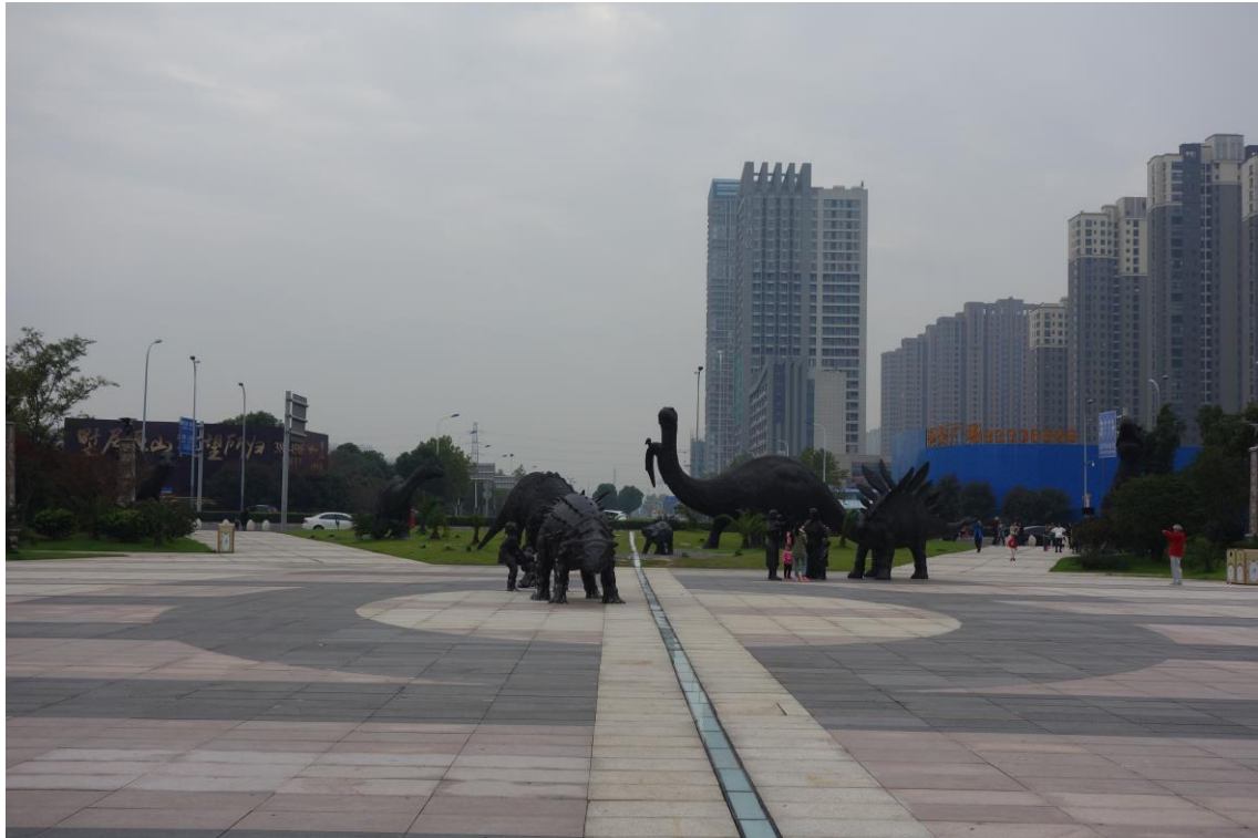
2017 臺灣江蘇燈會交流活動預定場地-常州恐龍園前廣場