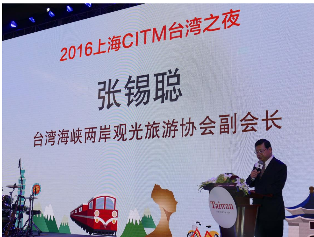
臺灣之夜-張副局長致詞