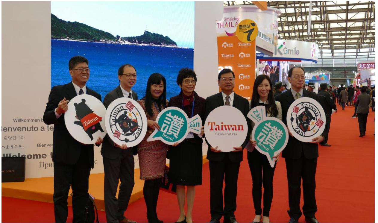
巡視 CITM 臺灣館