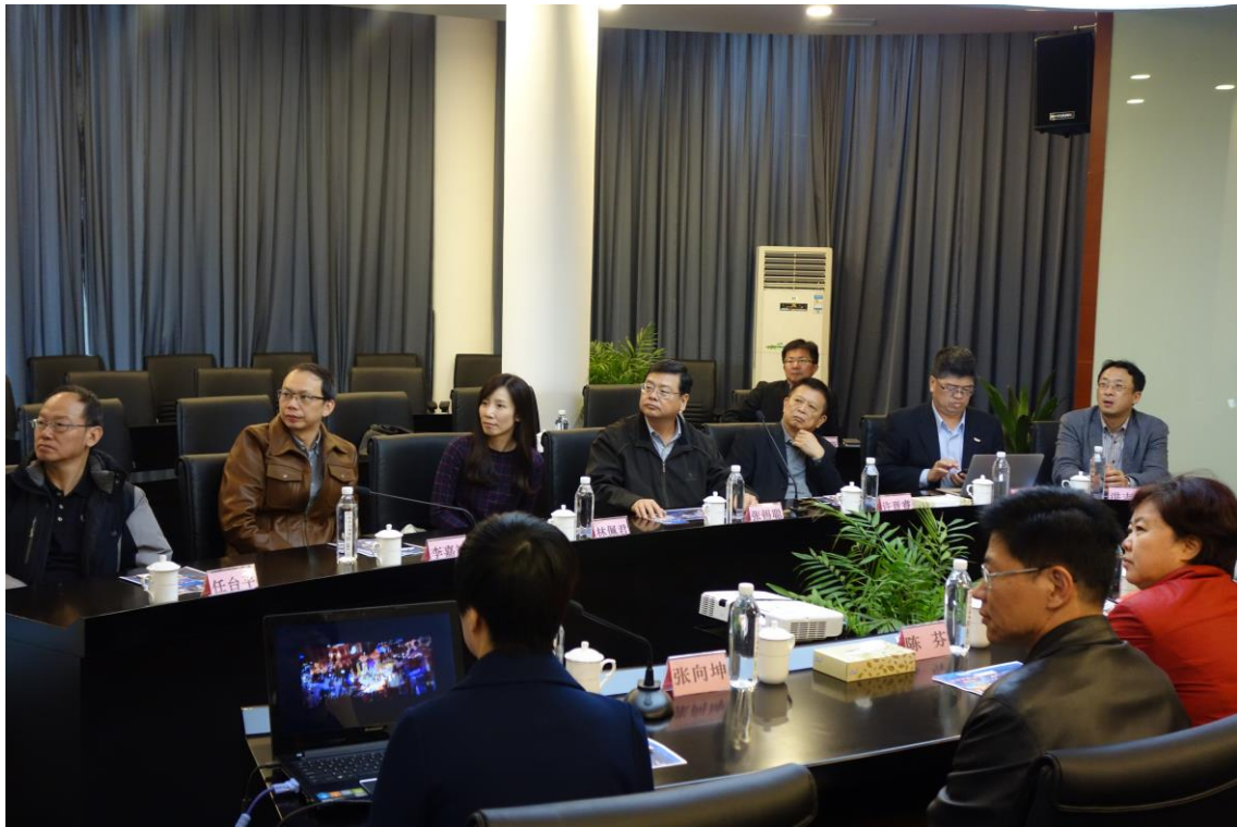
2017 臺灣江蘇燈會交流活動之討論及簡報