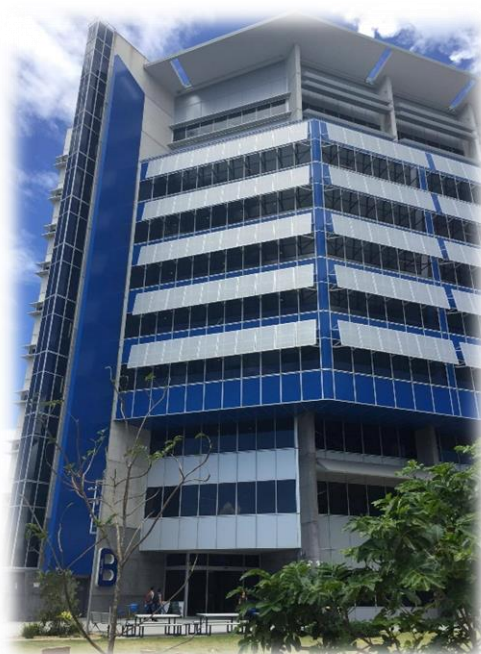
SCU 校舍 2