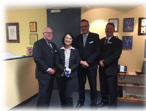
與學術及行政主管合影