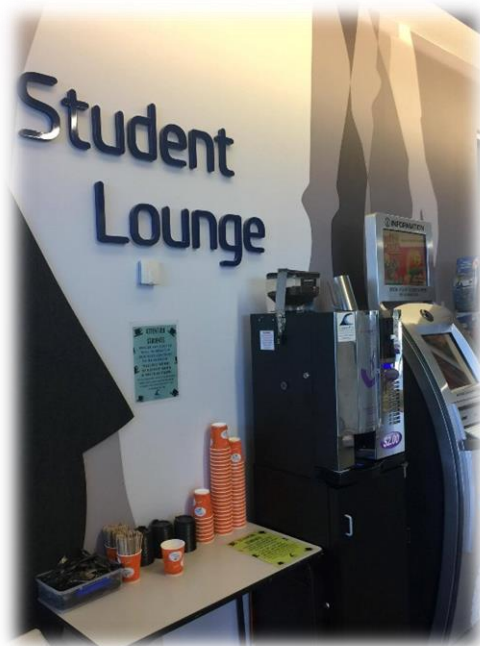
學生休息區提供免費咖啡