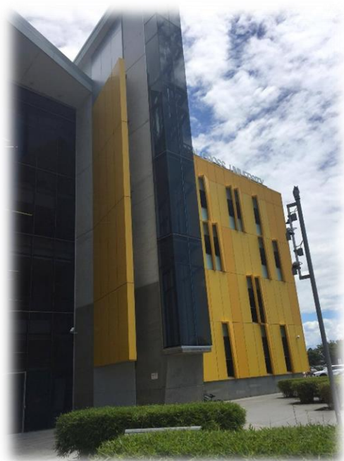
SCU 校舍 1