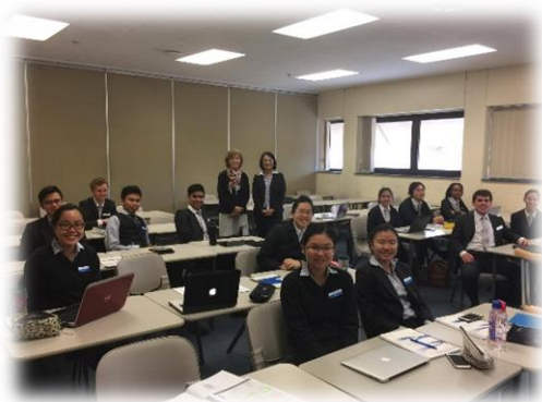
與學生在學校 Lobby 合影