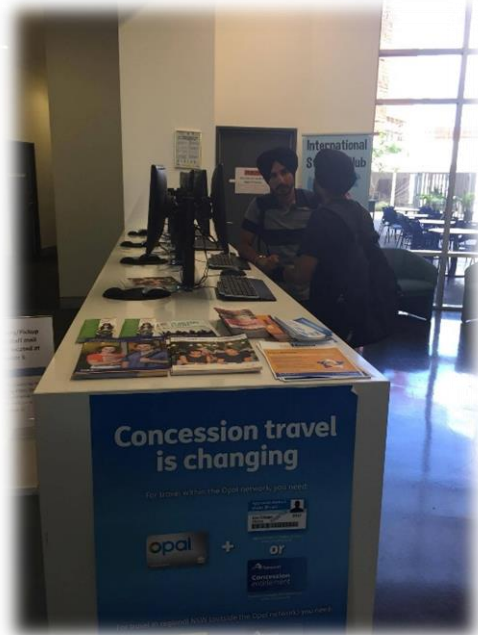
SCU 服務學生櫃檯, 一站到底