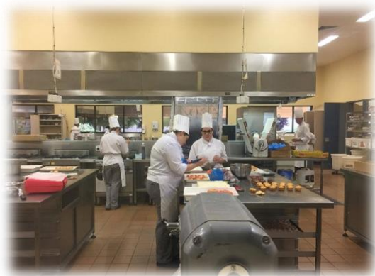
與實習業務主管合影