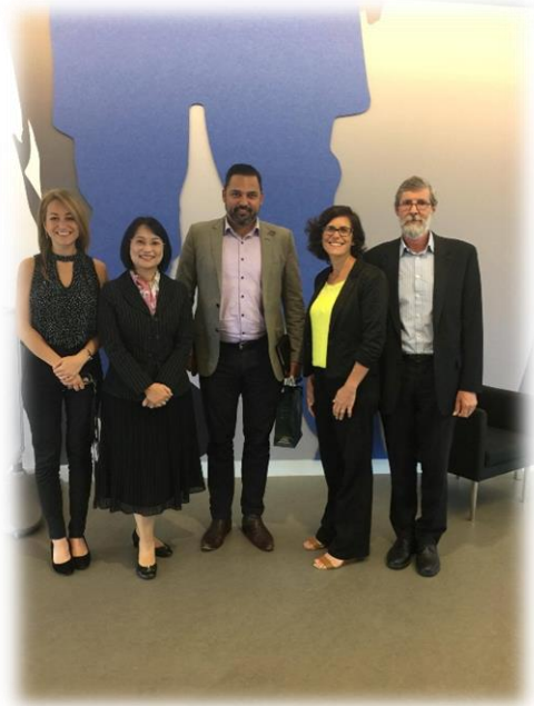
與 SCU 主管們合影