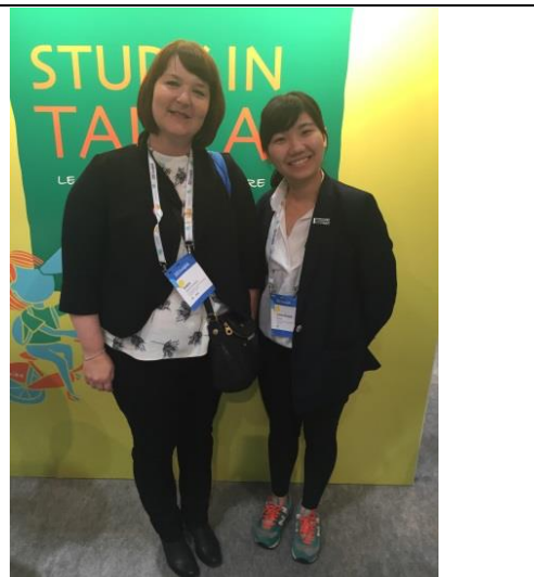
與諾丁漢特倫特大學學校代表會面