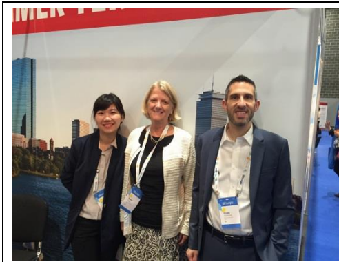
與波士頓暑期計畫辦公室與會