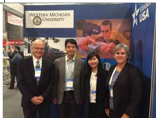
與美國西密西根大學學校代表會面