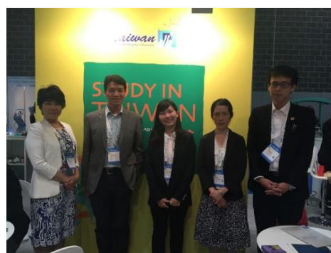
與日本東北大學學校代表與會