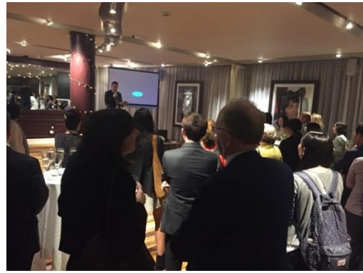
臺灣之夜活動之剪影

此活動主要宣傳 2017 APAIE 亞太教育者年會，並透過簡單餐會與友校進行交流。