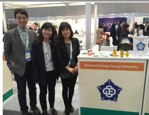
與加拿大湖首大學學校代表合照