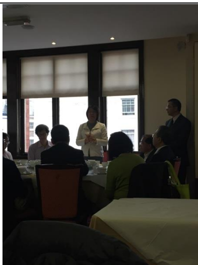
臺灣參展學校團與教育部駐英國教育組餐會，圖中為教育部國際及兩岸教育司司長楊敏玲小姐。