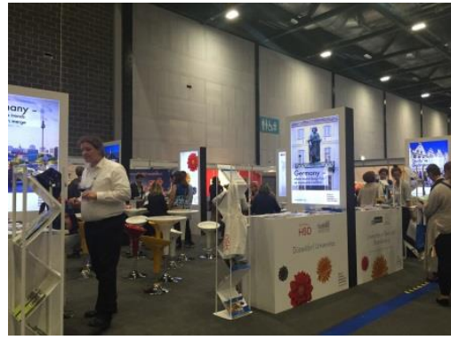
各國家之特色擺攤一景-德國攤