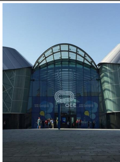
2016 歐洲教育者年會大會入口