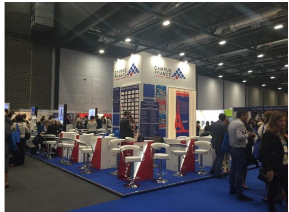
各國家之特色擺攤一景-法國攤