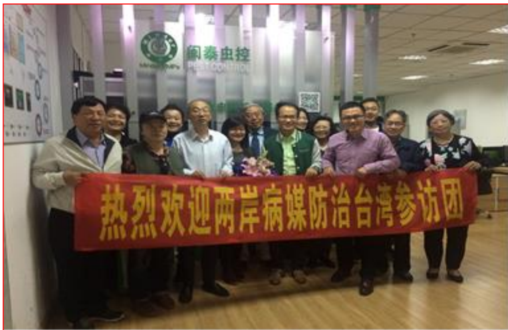
參訪中國蟲害管理聯盟交流會