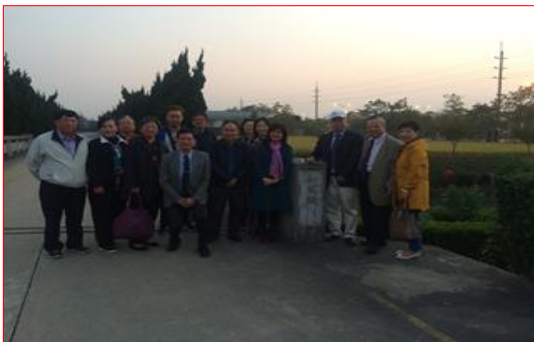
參訪團與允發化工公司及上海惠光環境科技公司合影

105.11.04 上午赴江蘇省南通市廣益機電有限責任公司進行參訪，實際參觀其所