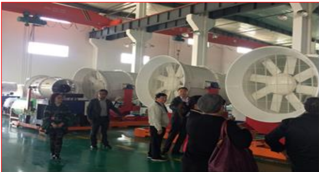
參訪廣益機電公司現場設備操作情形

下午先前往南通功成精細化工有限公司參訪，該公司生產公共衛生殺虫劑、家庭衛生殺虫劑與農林業殺虫劑等項目，並了解其在大陸營運情形，另實地參觀檢測分析實驗室，並對優良實驗室(GLP)認證數據認可方式進行意見交流。而後至金陵金哈島飯店參加中國蟲害管理聯盟所召開之交流會，針對病媒防治業服務概況、網路服務機制、環境施藥人員訓練、環藥專責人員培訓及未來兩岸業者之交流合作進行討論。