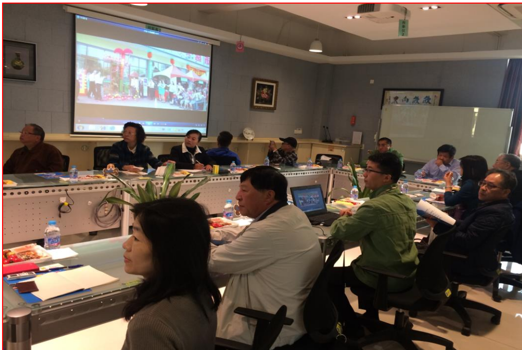
參訪興農藥業(中國)有限公司現場情形

下午拜訪允發化工(上海)股份有限公司及上海惠光環境科技有限公司等 2 家事業，參訪了解該等事業在大陸目前農藥製劑生產及經營現況，並於現場參訪其農藥製程之懸浮劑與液態劑之加工與分裝設備及