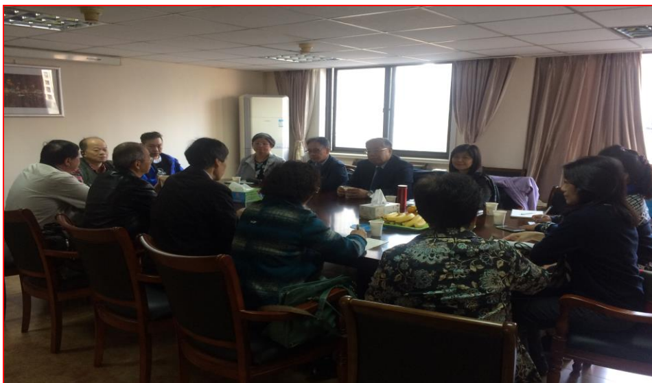
拜會閩泰環境衛生服務有限公司及上海市健康促進協會