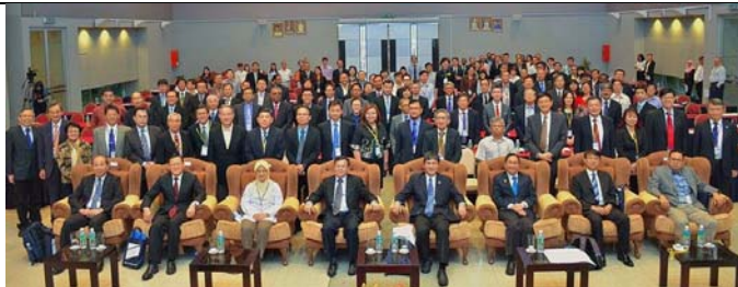
台馬高教論壇開幕