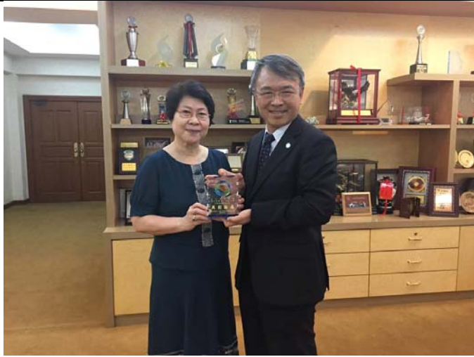
與巴生興華中學簽訂策略聯盟並致贈紀念品