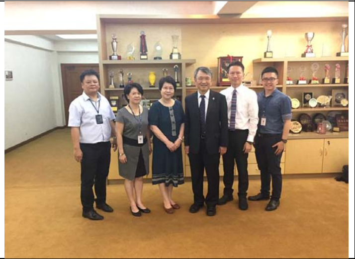
拜會巴生興華中學