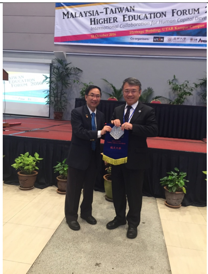
校長與拉曼大學校長互贈校旗