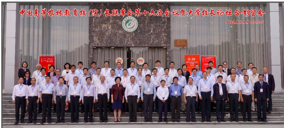
照片 1：合影：中國高等農林教育校（院）長聯席會第十六次會議暨大學校長論壇