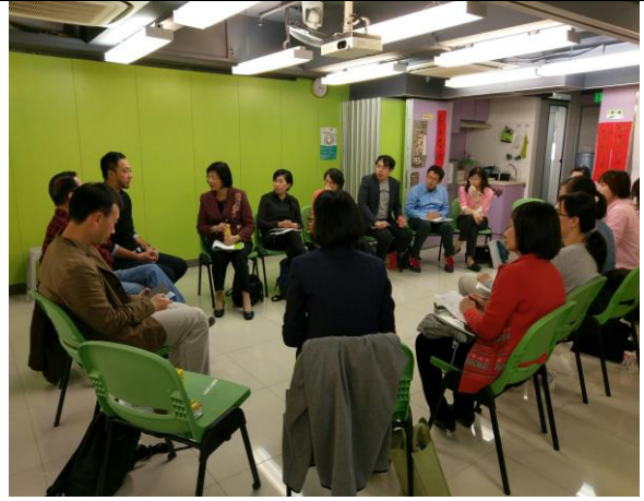
與香港社會工作者總工會熱烈提問交流