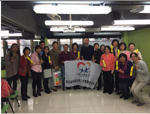
與香港社會工作者總工會參訪合照