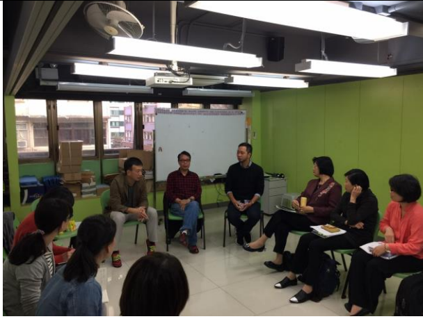
至香港社會工作者總工會參訪交流