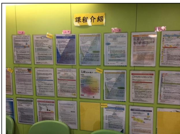
香港社會工作者總工會課程介紹牆面