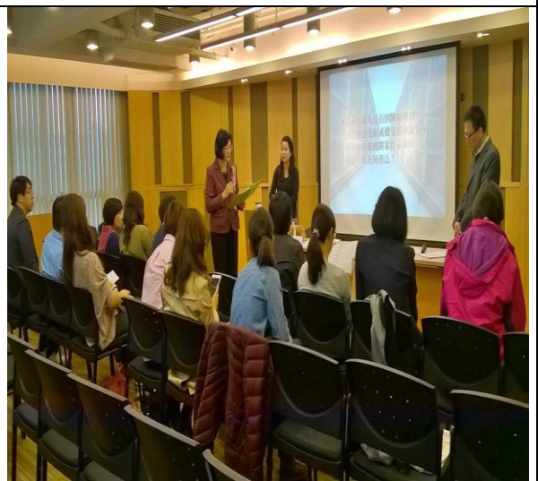
成員於簡報後提問互相交流