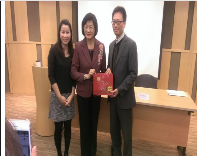
衛福部李美珍司長致贈伴手禮