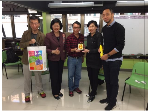
致贈政府宣導品予香港社會工作者總工會