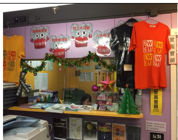
香港社會工作者總工會行政辦公空間及布