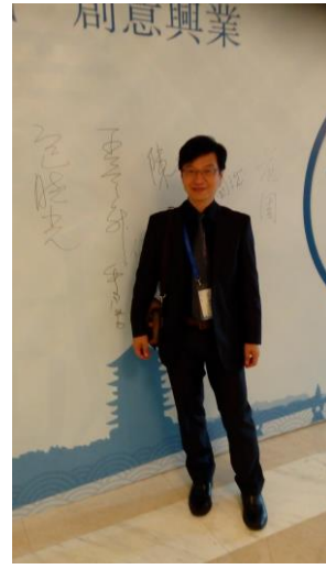
本人參與第十四屆海峽兩岸文化創意產業高校研究聯盟論壇簽名牆前留影。