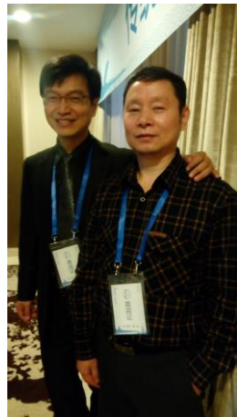
與大陸學者代表合影留念。