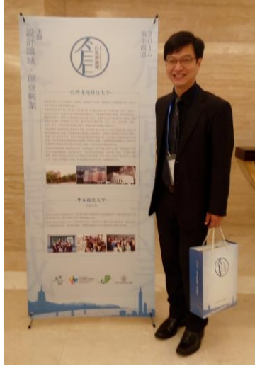
本人參與第十四屆海峽兩岸文化創意產業高校研究聯盟論壇，虎尾科大資料看板前留影。