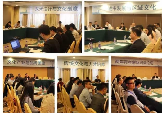
本人參與第十四屆海峽兩岸文化創意產業高校研究聯盟各論壇會議情形。