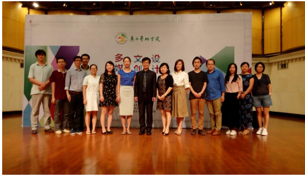
受邀至廣西藝術學院演講，合影留念。