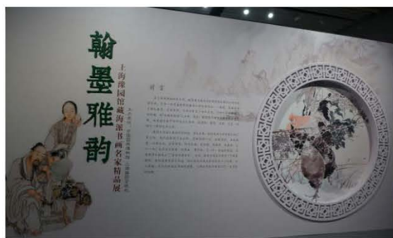
「翰墨雅韻」展場一景