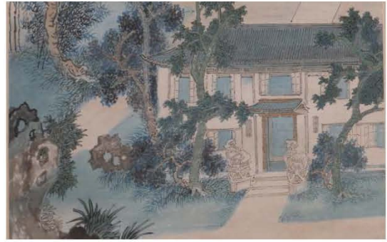
汪琨，〈內園先賢神祠圖〉（局部）