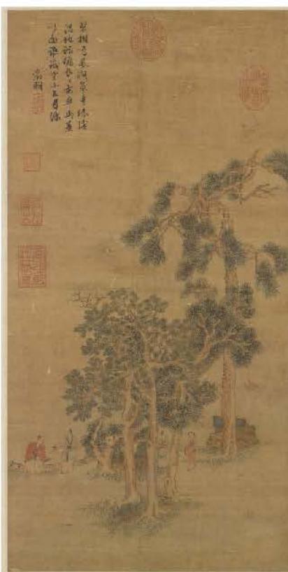
本院藏文徵明〈綠陰清話〉