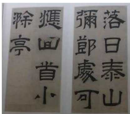
文徵明隸書〈毛先生餞行詩冊〉