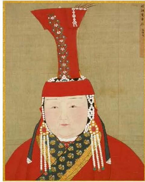
院藏〈元代后半身像冊〉的姑姑冠