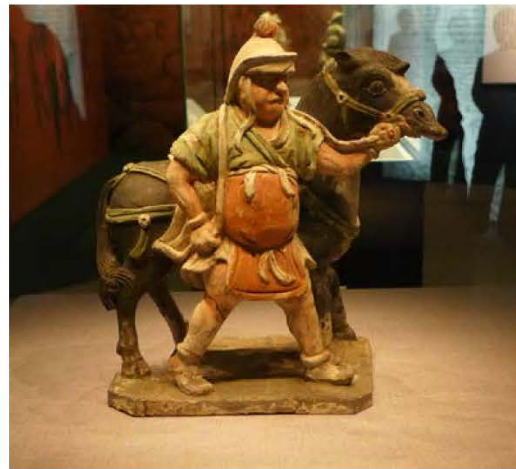
彩繪蒙古人御馬俑