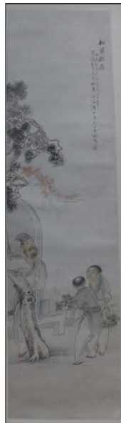
沈心海，〈松菊猶存圖〉