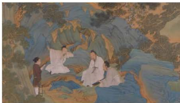
仇英〈桃源仙境圖〉(局部)