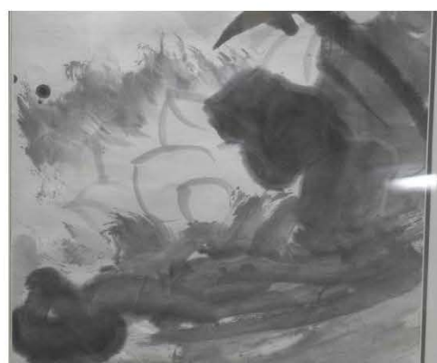
齊白石、張大千合作〈荷蝦〉(全圖、局部)