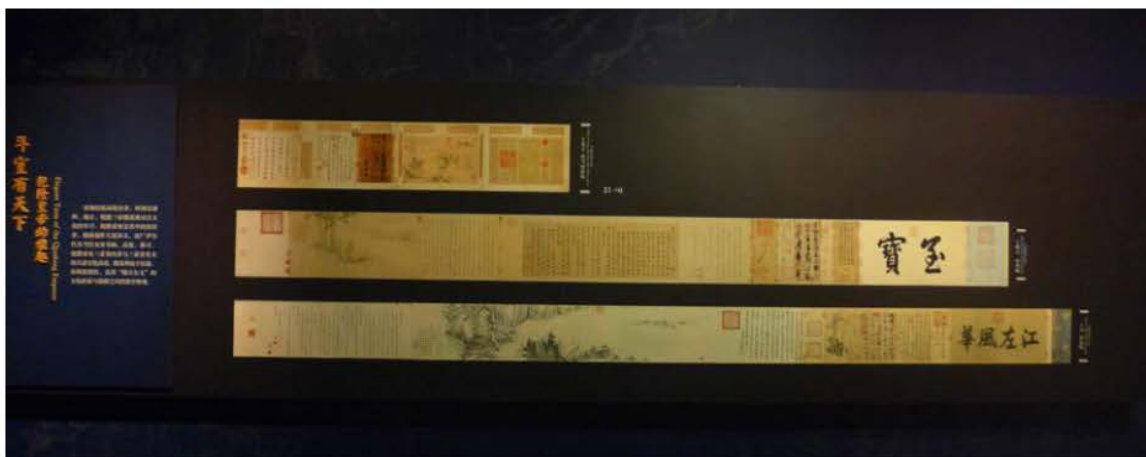
以大圖輸出介紹「三希」，最上方是本院收藏的〈快雪時晴帖〉