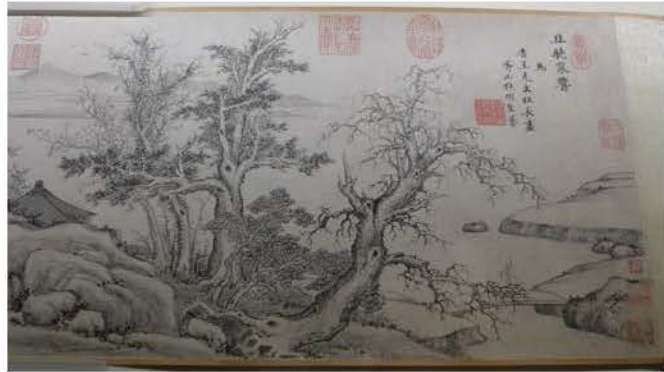
項聖謨〈且聽寒響〉(局部)