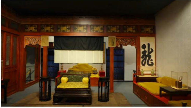
養心殿東暖閣——慈禧太后垂簾聽政處