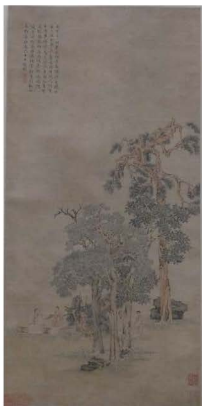
文徵明〈松石高士圖〉