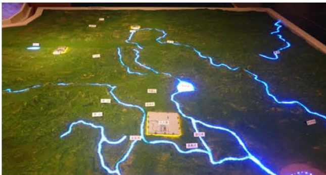
元代三都城的方位圖

「大元三都」則是個用心甚深的研究展，匯集十五個考古文博單位收藏之力，總成十數年考古發掘的成果，以元代上都（開平）、大都（北京）、中都等三地的都城建設為經，貴族與平民的生活為緯，交織出令人流連忘返的敘事空間。現場除了展示三都的復原模型，更依出土的漢白玉雕磚的尺寸，構築了一座大城牆分割展場，前半部介紹三都的建築與現前都城考古發掘的狀況，後半部則藉由墓葬出土文物講述當時社會各階層人民的生活。展品中有蒙古婦女頭戴的「姑姑冠」、各式彩繪出行陶俑、彩繪磚等，難得一見。尤其是「姑姑冠」，院藏〈元代後半身像冊〉已有描繪，然其實際如何卻是第一次見到。以之與畫中描繪者比對，又發現了更多有待探究的問題。然此展覽的企圖心太大，意欲包羅所有層面，小子題很多，導致展示的層次不甚清晰，有些凌亂之感，是其小小缺點。現場見到當地中學生在該展場進行校外教學，跑來跑去找答案，彼此競相表達對展品的想法，令人感到這仍是一個相當生動而成功的展覽。