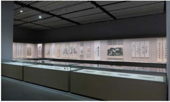
「翰墨雅韻」展場一景