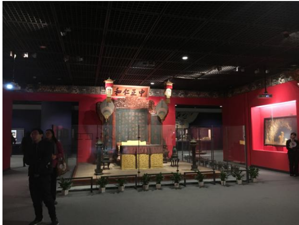
圖十八 養心殿空間複製