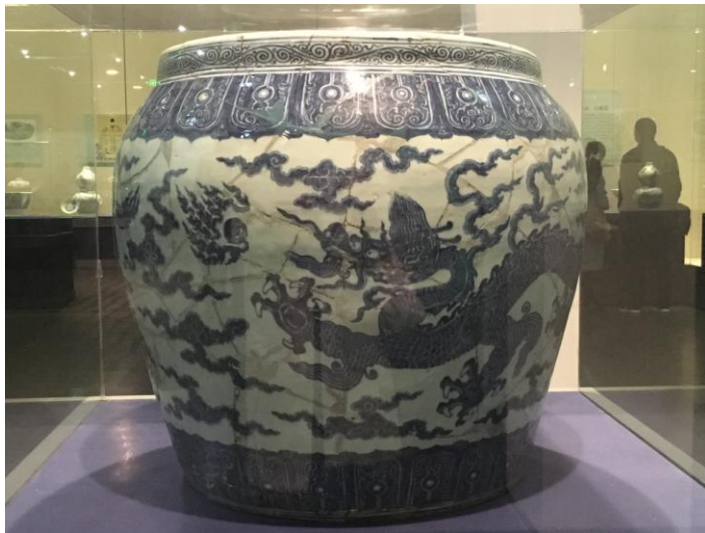
(圖十四) 明正統 青花龍缸