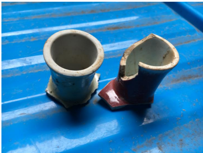
(圖八)景德鎮陶瓷考古研究所收藏之白釉及紅釉高足碗足底