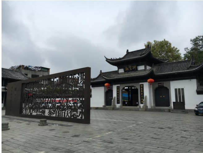
(圖九) 考古遺址公園入口