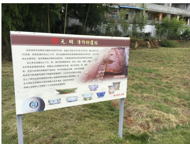
(圖十一) 考古完成後，回填後之標示牌