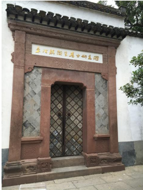
(圖七)景德鎮陶瓷考古研究所