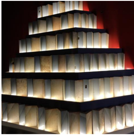
(圖三)明永樂 甜白瓷磚