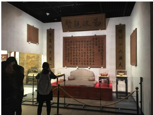
圖十九 養心殿原狀陳列