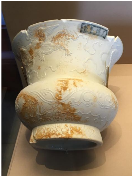
(圖一) 明正德 澀胎堆塑獅子戲球花盆半成品

品質的要求：不僅器形需端正，釉色要純正，紋飾也須仔細不能出錯，否則就是敲打擊碎掩埋的命運。明代的御器廠會將落選器、殘次品打碎掩埋，而不外流。自 20 世紀 80 年代起，景德鎮御器廠週邊陸續進行相關考古工作，發掘出大量的官窯落選瓷器的破片。這種將入選品和落選品同時展出的展覽方式，帶給參觀者強烈對比的特殊感受，結合傳世品和出土品的展覽方式，也讓人看到明代成化時期陶瓷燒造更完整的面貌(圖六)，對日後研究此一時期的陶瓷史應有助益。