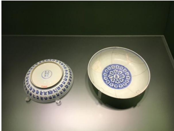
(圖五) 明成化青花梵文碟傳世品與出土品的對比展示