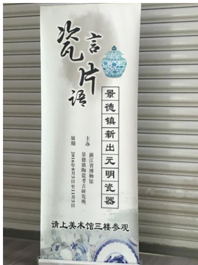
(圖十二) 「瓷言片語」展覽 宣傳海報

「瓷言片語-景德鎮新出元明瓷器」的展期為 2016 年 8 月 5 日至 11 月 5 日，展出的地點是浙江省博物館西湖館區(圖十二)。該展依序陳列由元代到明代中期的作品。主要依照時代區分，展示元代、明代洪武、永樂、宣德、空白期、成化、弘治、正德各時期的作品，在時間段的區隔之下，再依釉彩種類順序展出。本展除了可以看到新出土作品外，部分歷年出土之重要作品，如明永樂甜白釉盤口獸耳長頸瓶(圖十三)、明正統青花龍缸(圖十四)也在陳列室中展出，令人在學習之餘大飽眼福。