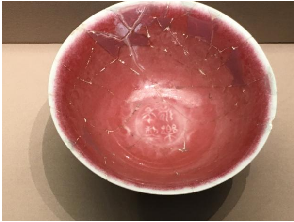
(圖二)明永樂 紅釉高足碗內之「永樂年製」篆字款