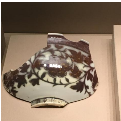
(圖四)北京故宮出土的明洪武釉裡紅花卉紋碗破片