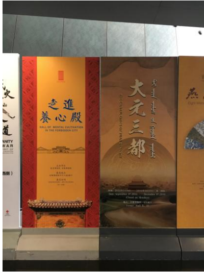
圖十五 「大元三都」展及「走進養心殿」展展覽海報