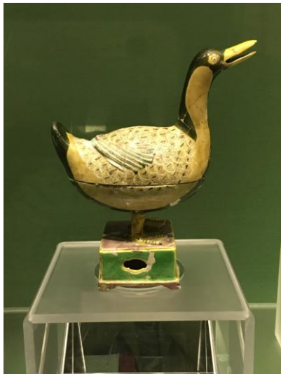
(圖六) 傳世品中未曾得見的明成化三彩鴨形香薰