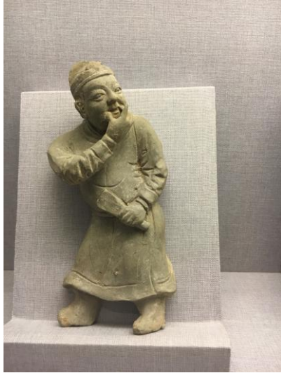
圖十七 反映庶民生活的陶俑