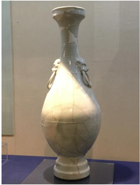
(圖十三) 明永樂甜白釉盤口獸耳長頸瓶