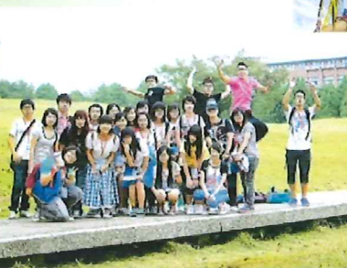
▲校園優美，為學生提供良好的學習環境。