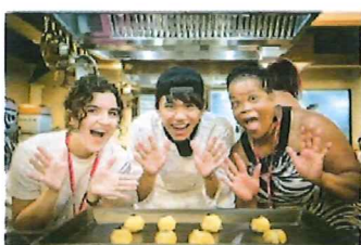
▲不少外國學生選擇在臺灣留學，環境見聞。

本港的大學聯會在國際上擁有極高的知名度，但原來所開辦的科目並不廣泛，相反臺灣就有許多本港大學未有提供的科目，如農業、森林及航法等，選擇甚多而且精細，學生有更廣闊的發展所長空間。課校長指出，「有學生很喜歡研究魚類生態，在本港的大學未必找到合適科目，後來課校長推薦入讀國立臺灣海洋大學修讀水產養殖系文憑課程，並無學士學位作為升學配對，相反臺灣多所大學都設有航天文學系，讓有志於此的學生盡情探索太空的奧秘。」