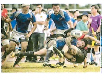
▲校園生活多姿多采，課外活動種類繁多。