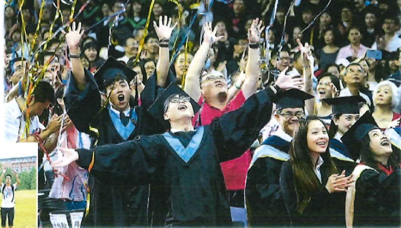
▲臺灣大學林立，學額充足，近年不少香港學生選擇在臺灣留學。

本港大學學位競爭激烈，受盡歡迎的「神科」入學門檻高不可攀，令許多學生只能修讀無甚興趣的科目，難以享受愉快的大學生活。近年臺灣已成為受歡迎的升學地區，皆因當地大學學位充裕，大部分學科的入學門檻相對較低，更開設了許多在本港的大學未有開辦的科目，讓不同志向的學生找到真正發揮興趣的廣闊空間。「2016臺灣高等教育展」將於本月21及22日啟德郵輪碼頭舉行，逾90所臺灣院校代表參展，加上連串升學輔導講座，讓學生全面了解臺灣升學概況，有意到臺灣升學的學生及副學位畢業生不容錯過。