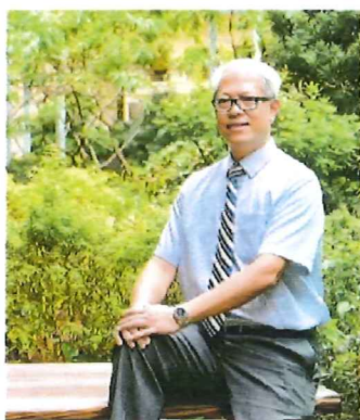
▲課程分枝長表示，臺灣的大學開辦的學科範圍廣泛，部分更是本港大學未有提供的科目。