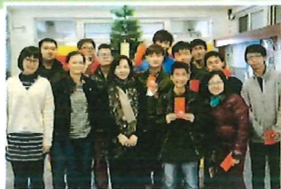
▲當地大學為港生提供支援，助他們融入校園生活。