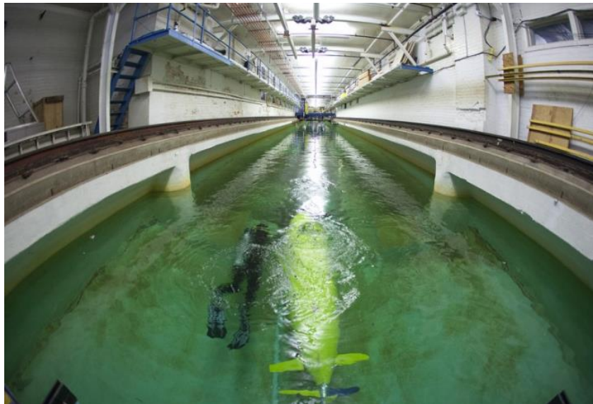
Aaron Friedman Marine Hydrodynamics Laboratory

本系有拖曳式水槽一座，長 109.7 公尺，寬 6.7 公尺，深 3.2 公尺，可進行船模阻力及推進試驗、6 自由度耐海性能測試以及船模操作性能試驗等。該座水槽已有 112 年歷史，於本年 4 月間完成整修工程並重新命名為 Aaron Friedman Marine Hydrodynamics Laboratory。