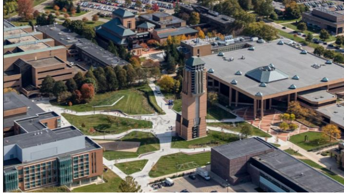
密西根大學北校區，主要為工程學院所在地