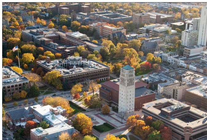
密西根大學中校區，主要為醫學院、法學院以及文學院等所在地