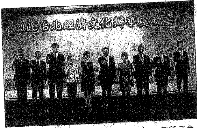
◎台北經濟文化辦事處成員向來賓祝酒。