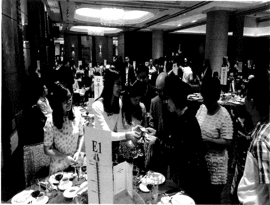
相片一：杜處長與現場嘉賓交換名片