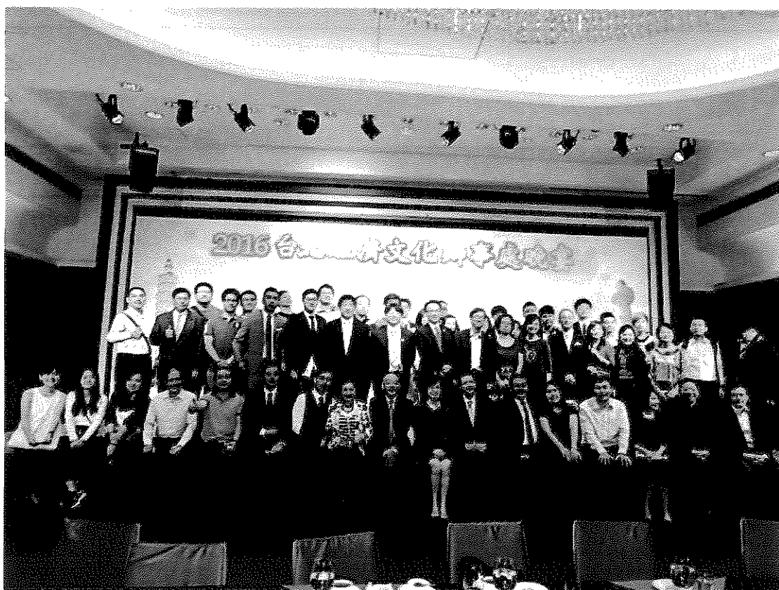
照片四：餐會結束後，杜處長、盧處長與澳門臺鄉及留臺校友大合照