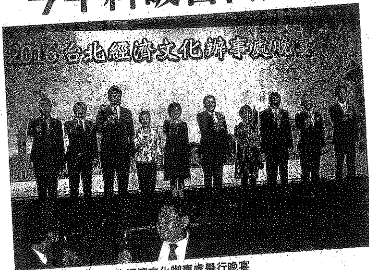
台北經濟文化辦事處舉行晚宴

【本報訊】兩岸關係在台灣政黨輪替後不進反退，但台澳交往依然持續、穩定發展。台北經濟文化辦事處表示，今年首八個月，台客訪澳同比增超過一成，預估全年訪澳人次將超過一百萬人次。