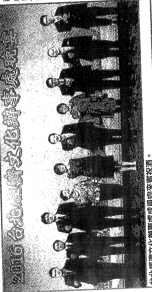
台北經濟文化辦事處成員向來賓祝酒。

杜嘉芬致辭時表示，台灣政府將會積極參與多邊與雙邊經濟合作，包括TPP、RCEP等，並且推動新南向政策等以提升對外經濟的格局及多元性，告別以往過於依賴單一市場的現象；並配合擴大招收澳門學生來台就學，推動青年國際交流及旅遊體驗。她相信台澳關係必能達到相輔相成的效果，創造互利共贏的新合作模式。