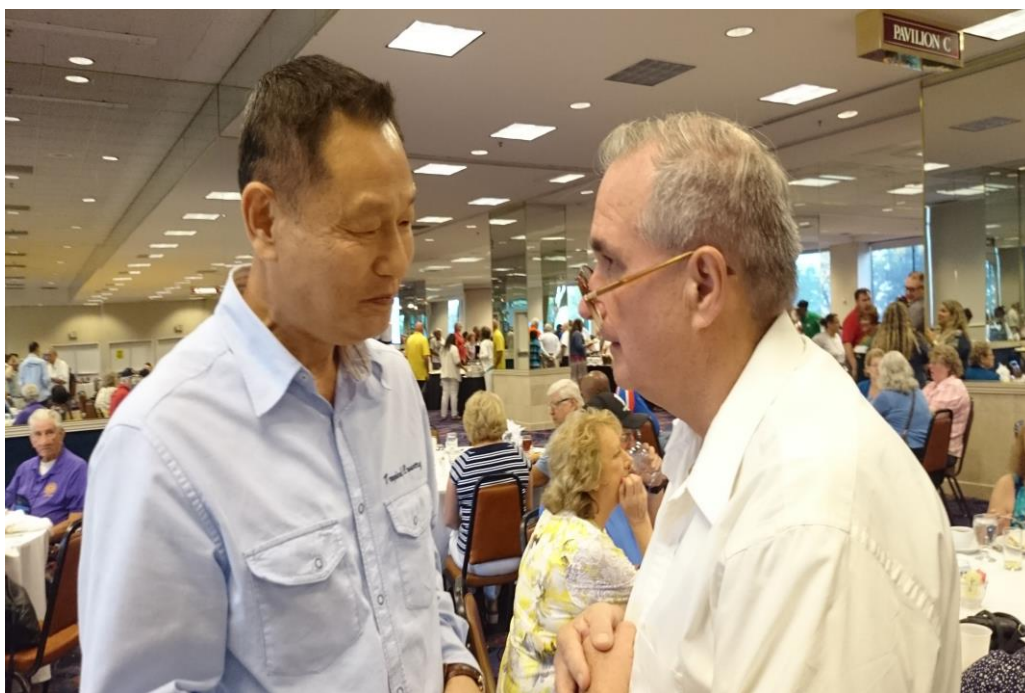
AMVETS 退伍老兵淚水盈眶感謝李主委出席大會，並頒贈勳章給總會長，同時表示將永遠支持中華民國