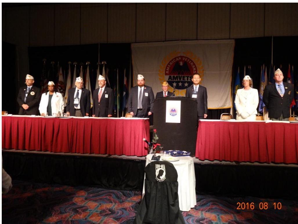
大會播放中華民國國歌時美國退協全體會員肅立致敬