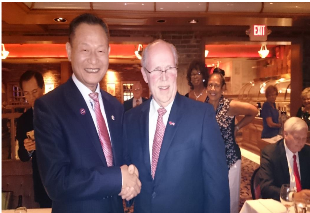
李主任委員為皮金總會長別上象徵兩國情誼之兩國國旗徽章