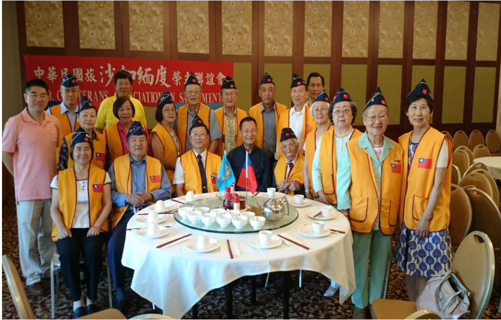
李主任委員與沙加緬度榮光會會員合影