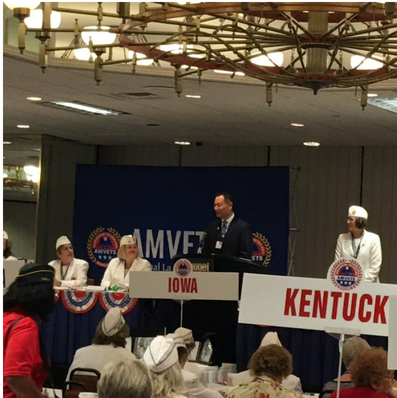
李主任委員於美國退協婦女總會大會致詞情形