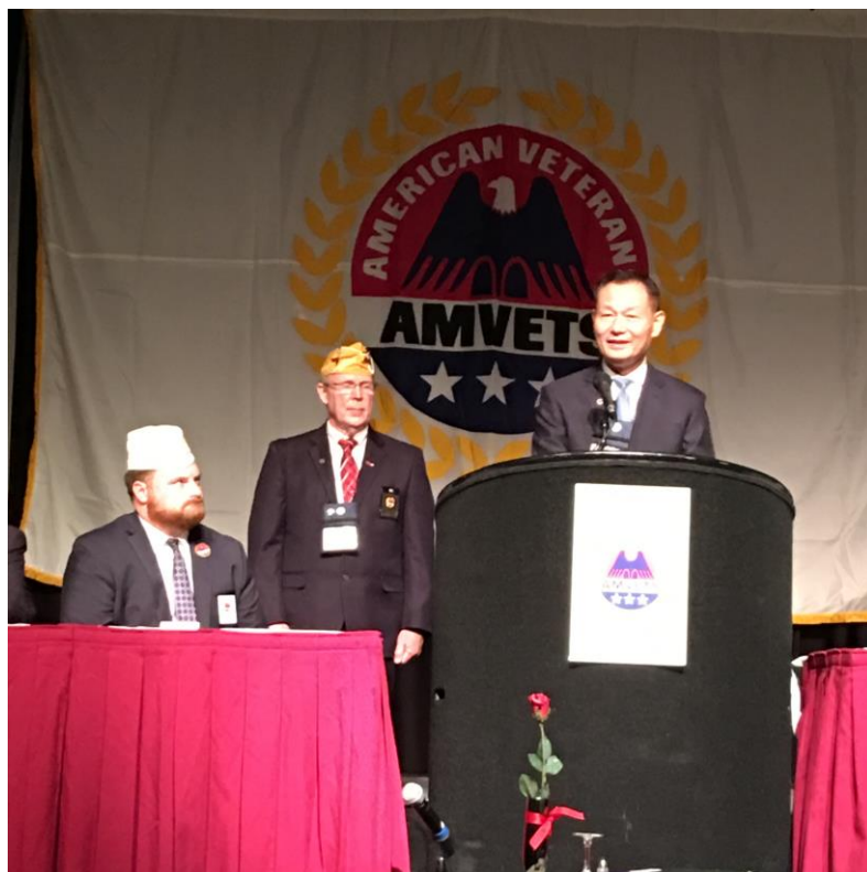
李主任委員於美國退協聯合開幕大會致詞情形