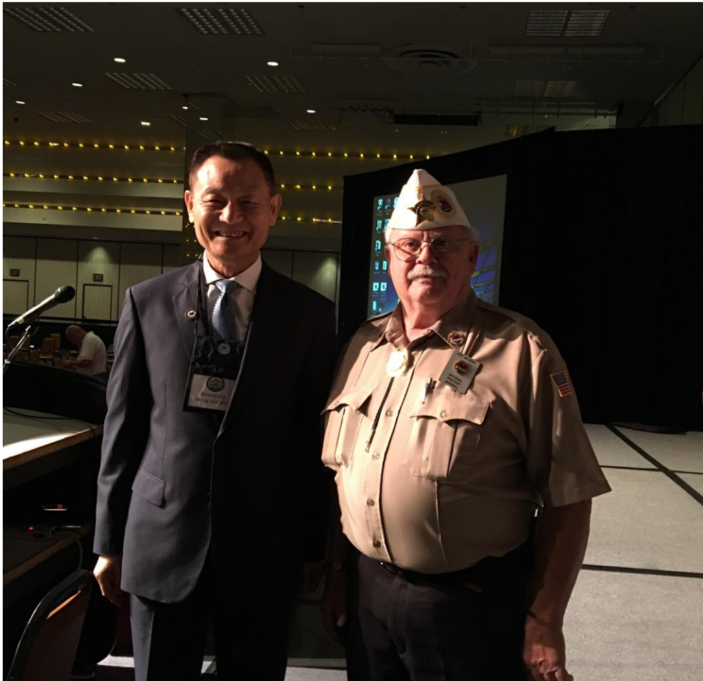
AMVETS 老兵感到能夠與李主委合影與有榮焉