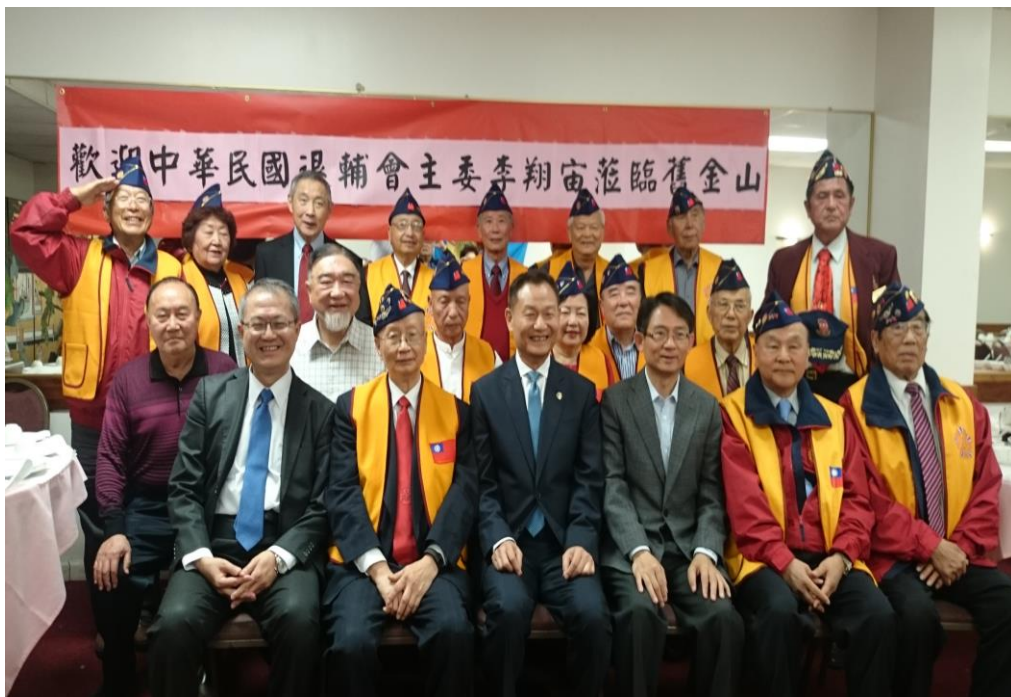
李主任委員與舊金山榮光會會員合影