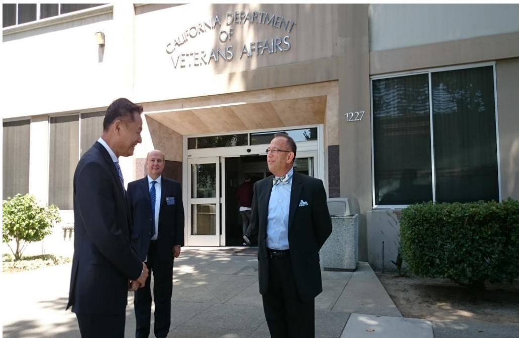
李主任委員與加州退伍軍人事務處處長印巴相尼博士於辦公大樓前道別