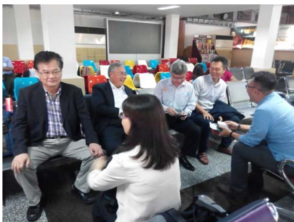
於仰光機場候機預備前往曼德勒

第二日，8 月 28 日上午 8:30 退房，前往孔教學校出發。接近孔教東區校門口，鑼鼓喧天，歡迎貴賓來訪的孔教學校師生儀仗隊及迎賓團，分列於校門兩側，排成長長的迎賓隊伍，各方賀詞字軸一一展開，隨著隊伍人龍緩緩進入校門，井然有序的登記賀詞，簽名留言，拍照留念，並在迎賓同學引導下，到第一排貴賓席就坐。