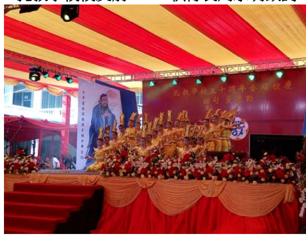
孔教學生千手觀音表演精彩萬千

中午時分，孔教學校席開近百桌，緬甸地區的華校校董、校長從四面八方群聚在一起，共同參與此一盛會。