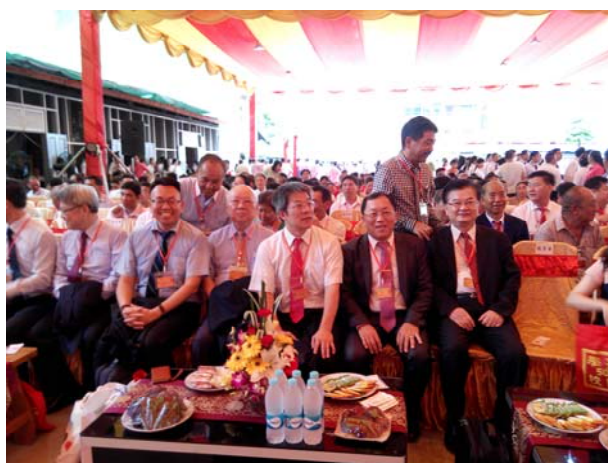
臺灣祝賀團座席於會場第一排