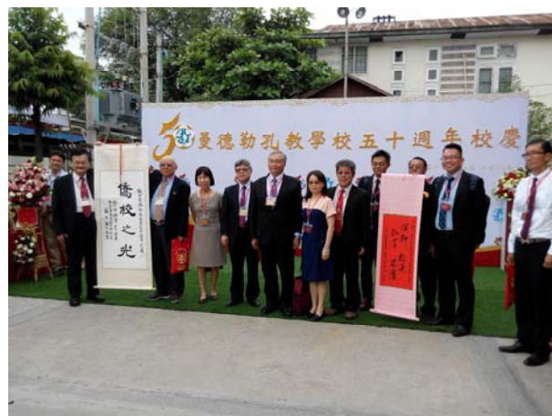
臺灣祝賀團於孔教學校校門合影