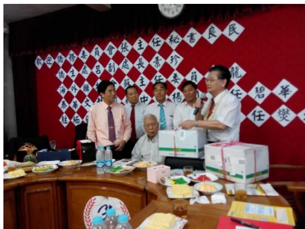
蘇校長親帶兩大箱化學實驗贈與孔教學校