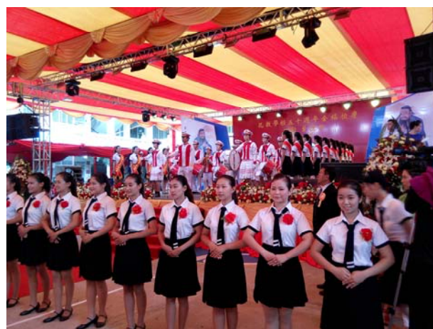
孔教學校儀仗隊表演揭開慶典序幕

09:30 正式開始金禧校慶典禮，由兩位落落大方的青年主持人開場，娓娓道出這 50 年創校興啟的風雨兼程。孔教學校董事會任秘書長緊接著介紹整個活動流程，首先請段必堯董事長宣佈校慶典禮儀式開始，由孔教學校再由尹正榮校長致歡迎辭，細數從 1966 年吳中庸校長創校開始的艱辛歷程，1992 年由段必堯董事長捐地興學，拓展成目前全緬規模最大的四個校區。緊接著邀請僑委會張良民主任秘書致辭，肯定孔教學校半世紀以來對維繫中華文化的