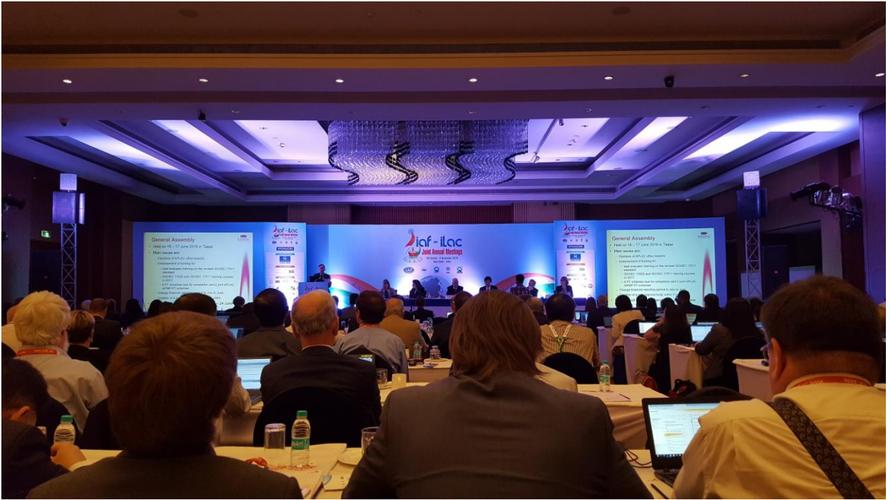
照片一、2016 ILAC/IAF 聯合會員大會會議現場