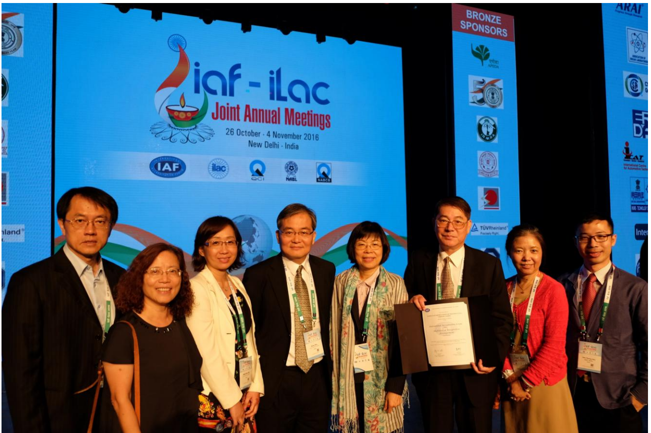
照片三、我方部分代表出席會議合照