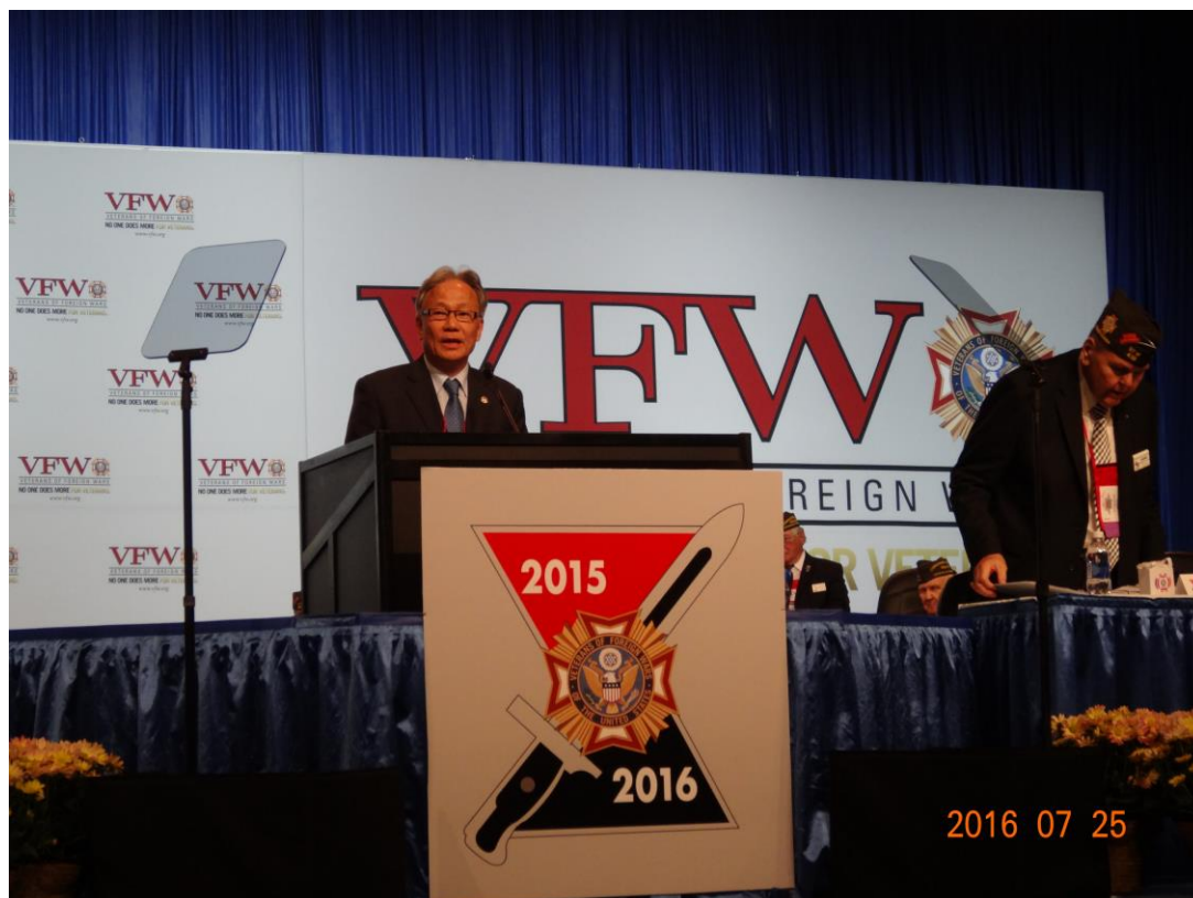
呂主任秘書於美國海外作戰退協大會開幕致詞情形