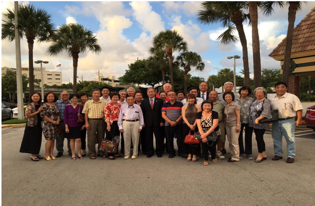
呂主任秘書與邁阿密榮光會會員合影情形