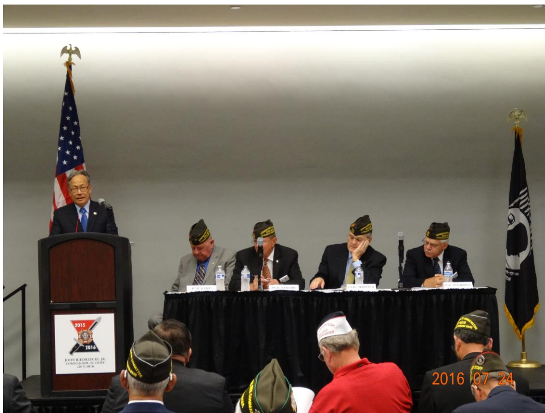
呂主任秘書於國家安全及外交事務暨戰俘/失蹤軍人委員會致詞情形