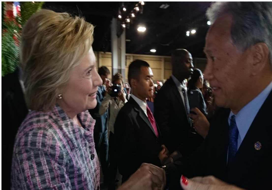
呂主任秘書與美國民主黨候選人希拉蕊女士握手致意情形