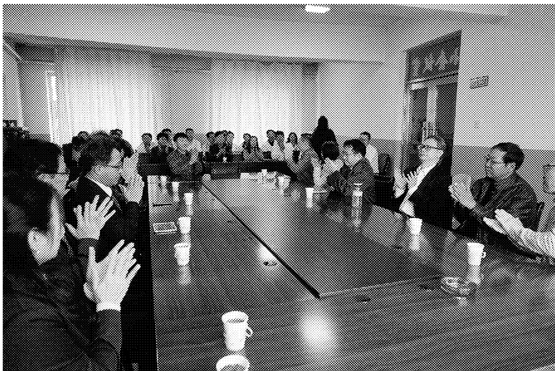
臺灣醫療團訪視莫力達瓦達斡爾族自治旗人民醫院