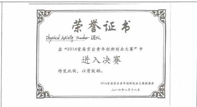
所指導團隊出席決賽榮譽證明