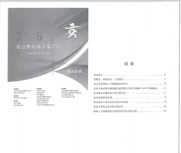
2016/8/16 2016 京台青年科學家論壇會議指南封面暨目錄