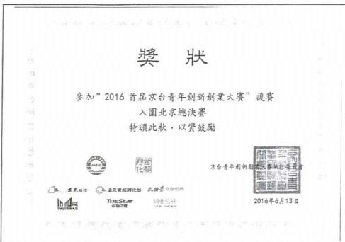
所指導團隊複賽入圍獎狀