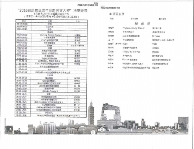
106/8/18 決賽手冊-決賽流程