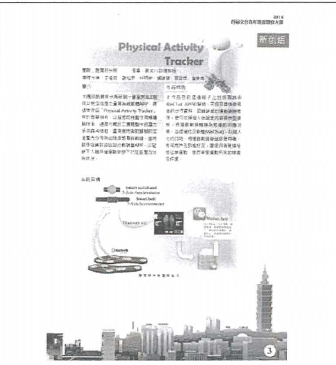
106/8/18 決賽手冊-所指導團隊作品介紹